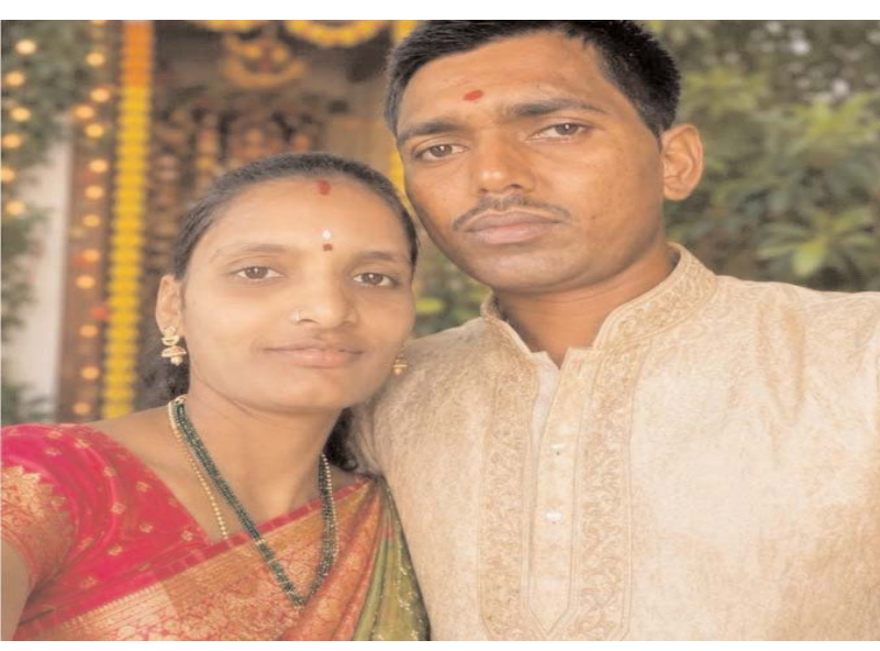
ఘటనాస్థలికి చేరుకున్న పోలీసులు మృతదేహాన్ని పరిశీలించి, కేసు నమోదు చేశారు. అనంతరం మృతుడి భార్యతో పాటు ఆమె ప్రియుడిని అదుపులోకి తీసుకుని విచారణ చేపట్టారు. పోస్టుమార్టం నివేదికతో పాటు విచారణలో లభించే ఆధారాల ఆధారంగా తదుపరి చర్యలు తీసుకోనున్నట్లు పోలీసులు తెలిపారు.