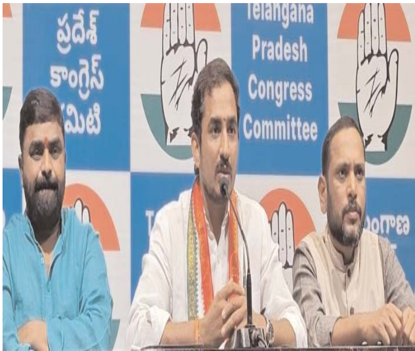
దర్శాప్త జరగాలి రాముల వారికి బీజేపీ గురించి తెలుసు అందుకే అయోధ్యలో బీజేపీ ఓడిపోయింది