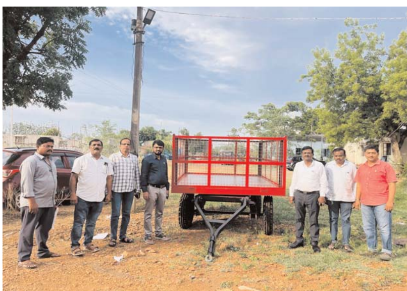
ఉండేందుకు ఈ మొబైల్ డిటీఆర్ ట్రాలీలో అందుబాటులో ఉంచిన ట్రాన్స్ఫార్మర్లను తాత్కాలికంగా వినియోగించి వెంటనే విద్యుత్ సరఫరా పునరుద్ధరించవచ్చని పేర్కొన్నారు.

ములుగు జిల్లాలోని మారుమూల, అటవీ మరియు గిరిజన ప్రాంతాల్లో విద్యుత్ అంతరాయాల సమయంలో వినియోగదారులకు త్వరితగతిన సేవలు అందించేందుకు ఈ మొబైల్ డిటీఆర్ ట్రాలీ ఎంతో ఉపయోగపడుతుందని తెలిపారు. దీనివల్ల విద్యుత్ సరఫరా పునరుద్ధరణ సమయం గణనీయంగా తగ్గి వినియోగదారుల ఇబ్బందులు నివారించబడతాయని చెప్పారు.