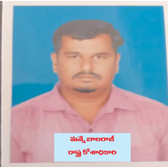
మనో బాలరాజ్ రాష్ట్ర కోశాధికారి