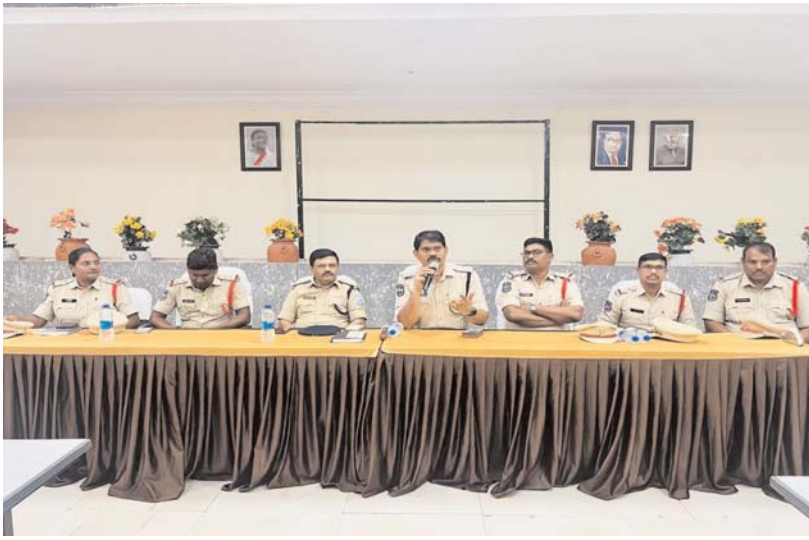
పెద్దపల్లి, జూన్ 17, ప్రజాబలం ప్రతినీధి :