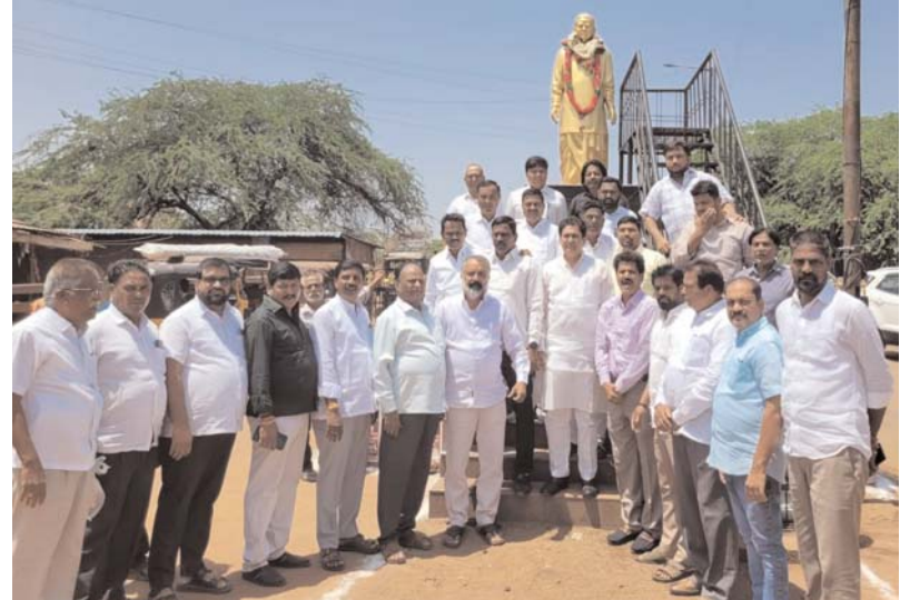
జూన్ 17 ప్రజాబలం ప్రతినీధి: