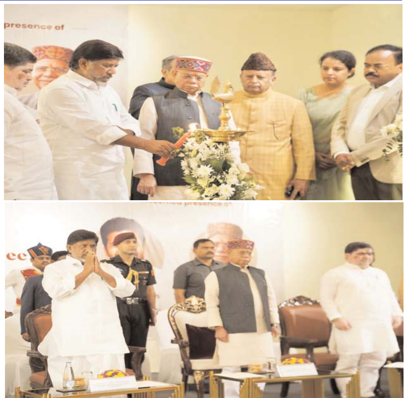
తాగి ఇక్కడి సంస్కృతిని అన్వదించాలని ఆయన కోరారు. మన బిర్యానీ, హాలీమ్, మీరే హైదరాబాద్ జాపకాలకు అసలైన చాయ్ కేవలం ఆహార పదార్థాలు కావు.. తెలంగాణ సాంస్కృతిక ఆర్థిక వ్యవస్థకు ఈ అమూల్యమైన సంపదను మరింత అభివృద్ధి చేయాలని, భవిష్యత్తు తరాలకు సగర్వంగా అందించడమే మనం ఆయనకు ఇచ్చే నిజమైన కాపాడుకుంటూ వస్తున్న క్యూరేటర్లు, కన్సర్వేటర్లు, సెక్యూరిటీ, క్లీనర్లు, అడ్మినిస్ట్రేటివ్ స్టాఫ్ కు డిప్యూటీ సీఎం కృతజ్ఞతలు తెలిపారు. కావాలాదారులు. సలార్ జంగ్-3 సేకరించిన ఈ అమూల్యమైన సంపదను మరింత అభివృద్ధి చేయాలని, భవిష్యత్తు తరాలకు సగర్వంగా అందించడమే మనం ఆయనకు ఇచ్చే నిజమైన కాపాడుకుంటూ వస్తున్న క్యూరేటర్లు, కన్సర్వేటర్లు, సెక్యూరిటీ, క్లీనర్లు, అడ్మినిస్ట్రేటివ్ స్టాఫ్ కు డిప్యూటీ సీఎం కృతజ్ఞతలు తెలిపారు.

నిర్మిస్తాయని ఉప ముఖ్యమంత్రి భట్టి విక్రమార్కు చెప్పారు. సలార్ జంగ్లీ మ్యూజియం 75వ వసంతాల వేడుకలలో పాటు, మీర్ యూసుఫ్ అలిఖాన్ (సలార్ జంగ్-3) 137వ జయంతి ఉత్సవాల్లో ఆయన ఆదివారం నాడు పాల్గొన్నారు. ఈ సందర్భంగా ఆయన మాట్లాడుతూ.. ?ప్రపంచాన్ని ఒడిసిపట్టిన మహోన్నత వ్యక్తి సలార్ జంగ్-3 అన్నారు. సాధారణంగా మనం మన కళ్ళతో, మొఖైల్ ఫోన్, కార్ కీస్ లాంటి వస్తువులనే మర్చిపోతుంటాం. కానీ సలార్ జంగ్-3 ఏకంగా ప్రపంచ నాగరికతలనే భద్రపరిచారని