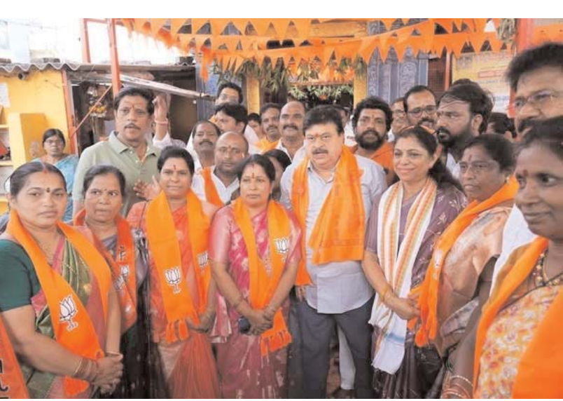
మాట్లాడుతూ 4,399 రోజుల ఈ సేవా ప్రయాణం కేవలం పదవీకాల రికార్డు మాత్రమే కాదు. శక్తివంతమైన, సమృద్ధిశాలి, అభివృద్ధి చెందిన, ఆత్మనిర్భర్ భారత్ నిర్మాణంలో ఇది ఒక స్వర్ణమ అధ్యాయం.మోదీ నాయకత్వంలో దేశం సేవ, సుశాసన్, గరిష్ట కల్యాణ్, వికసిత భారత్ సంకల్పంతో ముందుకు సాగుతోంది. ఆయన ప్రజా జీవితంలోని ప్రతి రోజు మా భారతి సేవకు, 140 కోట్ల భారతీయుల సంక్షేమానికి అంకితమైంది తెలిపారు.