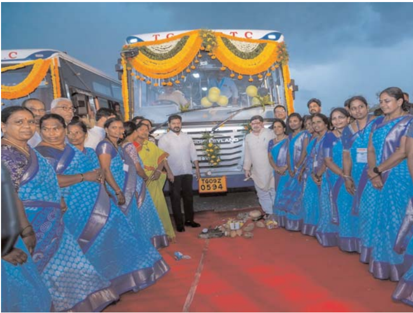
మిగతా 4 లో

మహిళా శక్తి కార్యక్రమంలో భాగంగా మండల మహిళా సంఘాలు కొనుగోలు చేసిన 553 టీజీఎన్ఆర్టీసీ బస్సులను సికింద్రాబాద్ పరేడ్ గ్రౌండ్స్ లో సోమవారం ముఖ్యమంత్రి ప్రారంభించారు. రాష్ట్ర నలుమూలల నుంచి భారీ సంఖ్యలో హాజరైన మహిళా సంఘాల సభ్యులను ఉద్దేశించి మాట్లాడిన ముఖ్యమంత్రి, మహిళలు సమాజంలో సగం, ఆకాశంలో సగం అని పేర్కొంటూ అభివృద్ధి ఫలితాలలో కూడా వారికి సమాన భాగస్వామ్యం ఉండాలని అన్నారు. మహిళలను రుణగ్రహీతల స్థాయి నుంచి ఆస్తుల యజమానుల స్థాయికి తీసుకువెళ్లే దిశగా ప్రభుత్వం చర్యలు చేపడుతోందని ముఖ్యమంత్రి తెలిపారు.