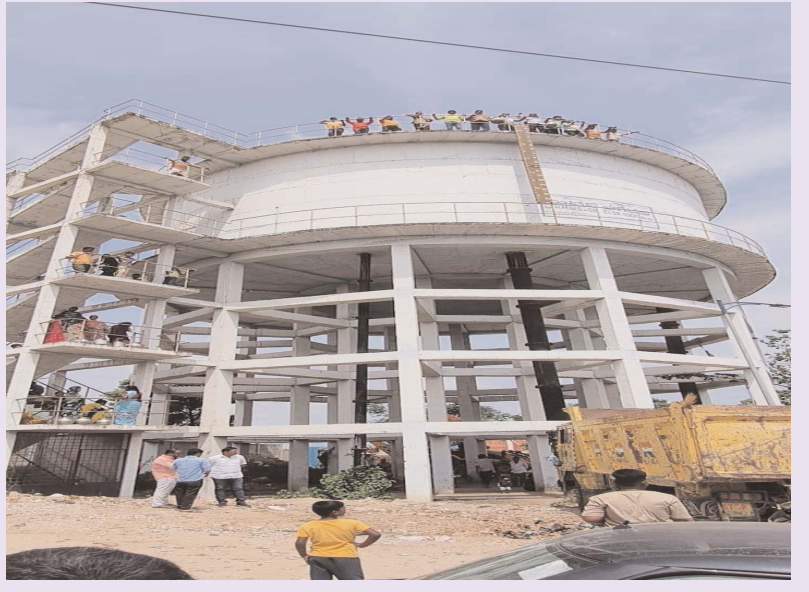
మిర్ పేట్ తాగునీరుకు చుక్క నీళ్లు ఇవ్వలేని ఎమ్మెల్యే మాకొద్దని మిర్పేట్ డబల్ డెడ్ రూమ్ కాలనీ ప్రజలు నిరసనకు దిగారు. డౌన్ డౌన్ రేవంత్ రెడ్డి, జిల్లా కలెక్టర్ డౌన్ డౌన్ అంటూ నినాదాలతో బిందెలతో నీళ్ల ట్యాంకు పైకి ఎక్కి నిరసన తెలిపారు.