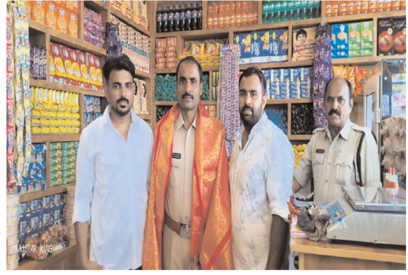
చాక్లెట్స్ కేక్ పంచిపెట్టారు.