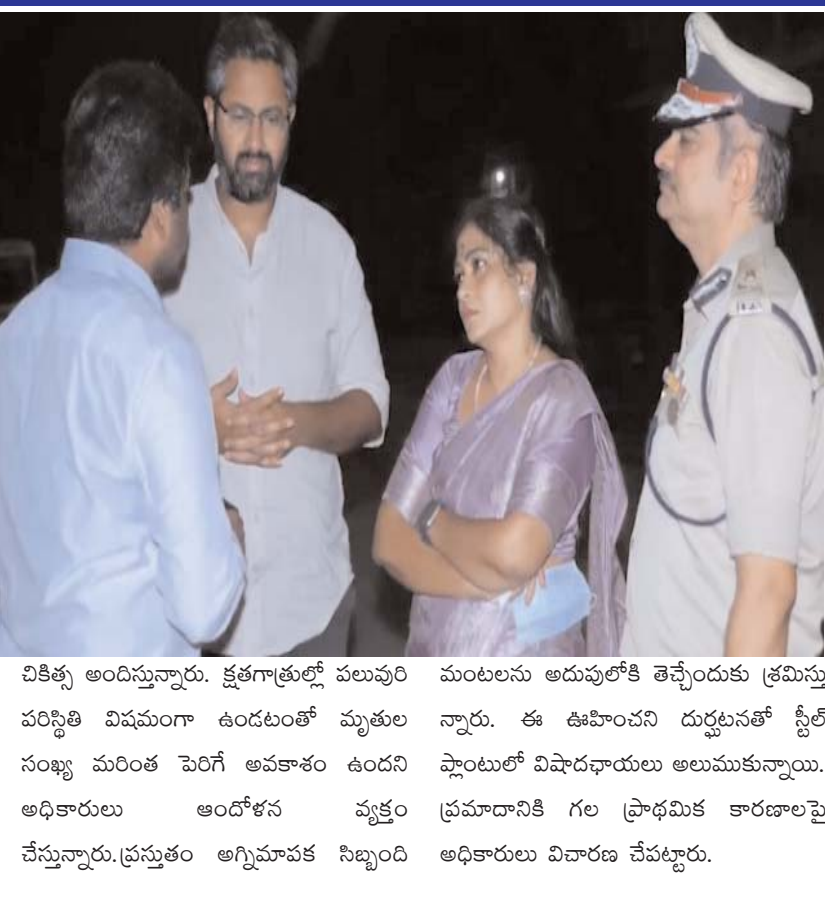
విశాఖ స్టీల్ ప్లాంట్ లో ప్రమాద స్థలాన్ని సందర్శించిన హోంమంత్రి అనిత హాట్ మెటల్ పడి ఎనిమిది మంది సజీవ దహనం హాట్ మెటల్ ల్యాడిల్స్ కిందపడి సజీవదహనం స్టీల్ మెల్టింగ్ స్టేషన్-2లో చోటుచేసుకున్న ఘటన పలువురికి తీవ్ర గాయాలు.. ఆసుపత్రికి తరలింపు మృతుల సంఖ్య పెరిగి అవకాశం ఉందని ఆందోళన

విశాఖ స్టీల్ ప్లాంట్ ప్రమాద స్థలాన్ని సందర్శించిన హోంమంత్రి అనిత హాట్ మెటల్ పడి ఎనిమిది మంది సజీవ దహనం హాట్ మెటల్ ల్యాడిల్స్ కిందపడి సజీవదహనం స్టీల్ మెల్టింగ్ స్టేషన్-2లో చోటుచేసుకున్న ఘటన పలువురికి తీవ్ర గాయాలు.. ఆసుపత్రికి తరలింపు మృతుల సంఖ్య పెరిగి అవకాశం ఉందని ఆందోళన విశాఖపట్నం స్టీల్ ప్లాంట్ లో సోమవారం అత్యధిక ఉష్ణోగ్రత వద్ద ఉన్న ఉక్కు ద్రవం.. హోర అగ్నిప్రమాదం సంభవించింది. ఈ కింద పనిచేస్తున్న కార్మికులపై పడింది. ఈ దుర్ఘటనలో ఎనిమిది మంది కార్మికులు సజీవ దహనం కాగా, మరికొందరు తీవ్రంగా గాయపడ్డారు. స్టీల్ మెల్టింగ్ స్టేషన్-2 విభాగంలో ఈ విషాదం ఘటన చోటుచేసుకుంది. స్టీల్ మెల్టింగ్ స్టేషన్-2లో కన్నేయర్ ద్వారా హాట్ మెటల్ (మరుగుతున్న ఉక్కు ద్రవం) ఉన్న ల్యాడిల్ ను తరలిస్తుండగా అవి ఒక్కసారిగా కుప్పకూరాయి. దీంతో అత్యధిక ఉష్ణోగ్రత వద్ద ఉన్న ఉక్కు ద్రవం.. కింద పనిచేస్తున్న కార్మికులపై పడింది. ఈ ప్రమాదంలో ఎనిమిది మంది కార్మికులు అక్కడికక్కడే మృతి చెందగా, సమావేశంలో ఉన్న మరికొందరు తీవ్రంగా గాయపడ్డారు. ప్రమాద సమాచారం అందిన వెంటనే అగ్నిమాపక సిబ్బంది, ప్లాంటు అధికారులు హుటాహుటిన ఘటనా స్థలానికి చేరుకున్నారు. గాయపడిన వారిని వెంటనే ఆసుపత్రిలోకి తరలించి అత్యవసర సమావేశంలోని ఆసుపత్రికి తరలించి అత్యవసర