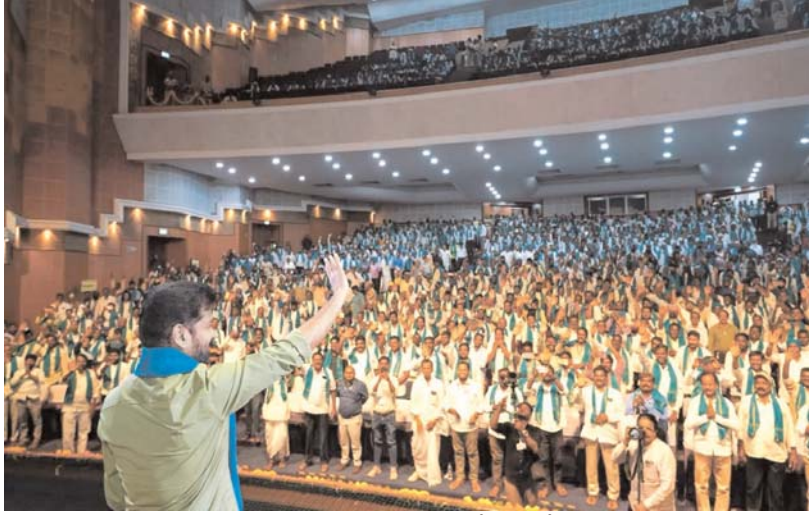
ముదటి పేజీ తరువాయి

రైతు అత్యగ్రంథం వ్యవసాయం చేసుకునే పరిస్థితులు కల్పించడమే ప్రభుత్వ ప్రధాన లక్ష్యమని స్పష్టం చేశారు. గత రెండున్నరేళ్లలో వ్యవసాయం, సాగునీరు, ఉచిత విద్యుత్, పెట్టుబడి సాయం, పంటల కొనుగోళ్లు, రైతు బీమా తదితర కార్యక్రమాల కోసం సుమారు రూ.1.75 లక్షల కోట్లను ప్రభుత్వం వెచ్చించినట్లు తెలిపారు. రాష్ట్ర ఆర్థిక పరిస్థితులు క్షిప్రంగా ఉన్నప్పటికీ ప్రజలకు, ముఖ్యంగా రైతాంగానికి ఇచ్చిన హామీలను ప్రభుత్వం చిత్తశుద్ధితో అమలు చేస్తోందన్నారు. రైతు రుణభారాన్ని తగ్గించేందుకు రూ.2 లక్షల వరకు రైతు రుణమాఫీ పథకాన్ని అమలు చేసి, 25.35 లక్షల మంది రైతులకు రూ.20.677 కోట్ల మేర రుణమాఫీ చేసినట్లు తెలిపారు. ఇది దేశంలోనే అతిపెద్ద రైతు రుణమాఫీ కార్యక్రమాల్లో ఒకటిగా నిలిచిందన్నారు. ఉద్యోగులకు సకాలంలో జీతాలు, పెన్షన్లు రైతు భరోసా పథకం కింద వార్షిక పెట్టుబడి సహాయాన్ని రూ.10 వేల నుంచి రూ.12 వేలకు పెంచామని, ఇప్పటికే రూ.27 వేల కోట్లకు పైగా రైతుల ఖాతాల్లో జమ చేశామని తెలిపారు. తాజా విదతలో మరో రూ.9 వేల కోట్లను రైతుల