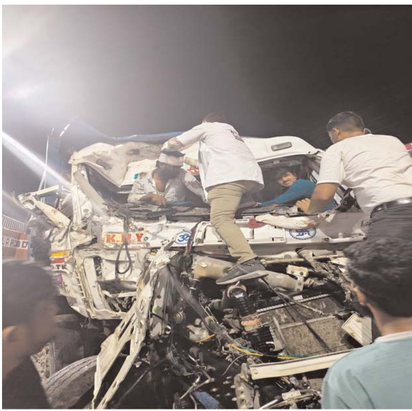
vivo V70 | 23mm f/1.88 1/33s ISO1623