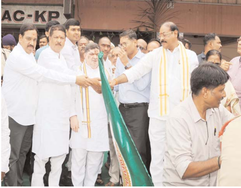
మేధుల్ మల్కాజ్ గిరి జిల్లా ప్రతినిధి ప్రజాబలం మే 27: పర్యావరణ హితమైన, ప్రయాణికులకు అనుకూలమైన ప్రజా రవాణా సేవలను అందించాలనే సంకల్పంతో కూకట్ పల్లి డిపో నుండి 60 ఎలక్ట్రిక్ బస్సులను ప్రయాణికులకు అందుబాటులోని తెచ్చామని రవాణ శాఖ మంత్రి పాస్పం ప్రభాకర్ అన్నారు. బుధవారం తెలంగాణ రాష్ట్ర రోడ్డు రవాణా సంస్థ (టీజీఎస్ఆర్టీసీ) ఆధ్వర్యంలో కూకట్ పల్లి డిపోలో 60 ఆత్మాధునిక ఎలక్ట్రిక్ బస్సులను రవాణ శాఖ మంత్రి పాస్పం ప్రభాకర్ ఘనంగా ప్రారంభించారు. ఈ సందర్భంగా