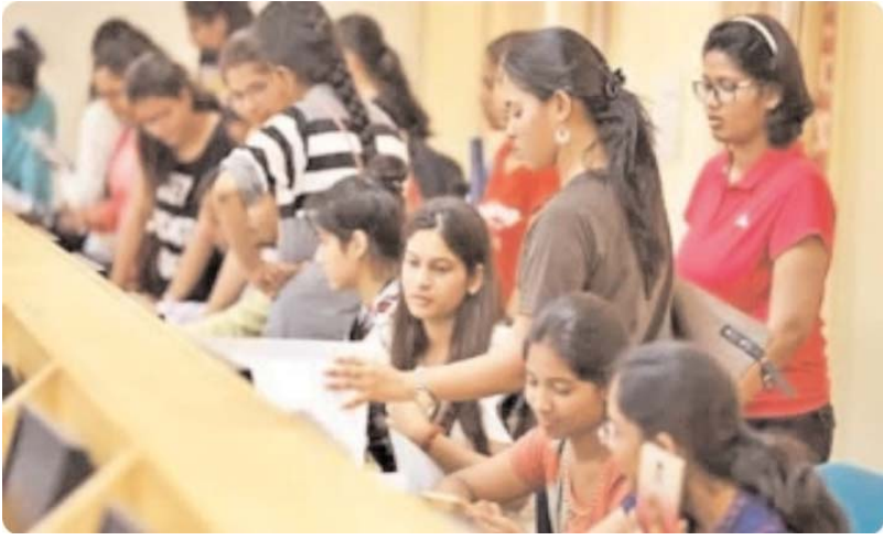
వివరాలు ఎంటర్ చేసి ఫలితాలను పొందొచ్చు.