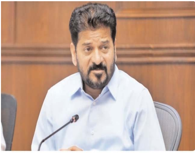
హైదరాబాద్ మే 21 :రాష్ట్రంలో కార్మికులకు సీఎం రేవంత్ రెడ్డి గుడ్ ?న్యూస్ చెప్పారు. కార్మికులు