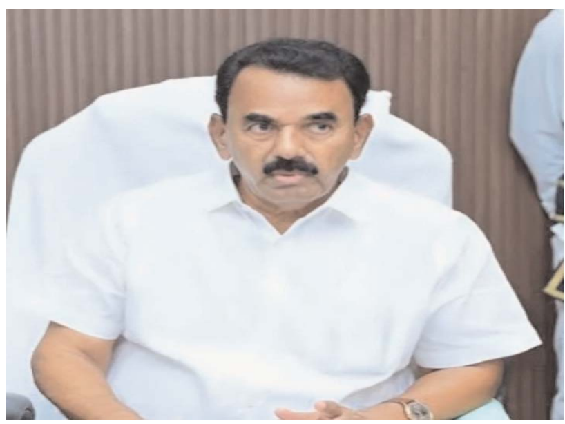
సమీక్ష అనంతరం ఈ మేరకు మాట్లాడారు.