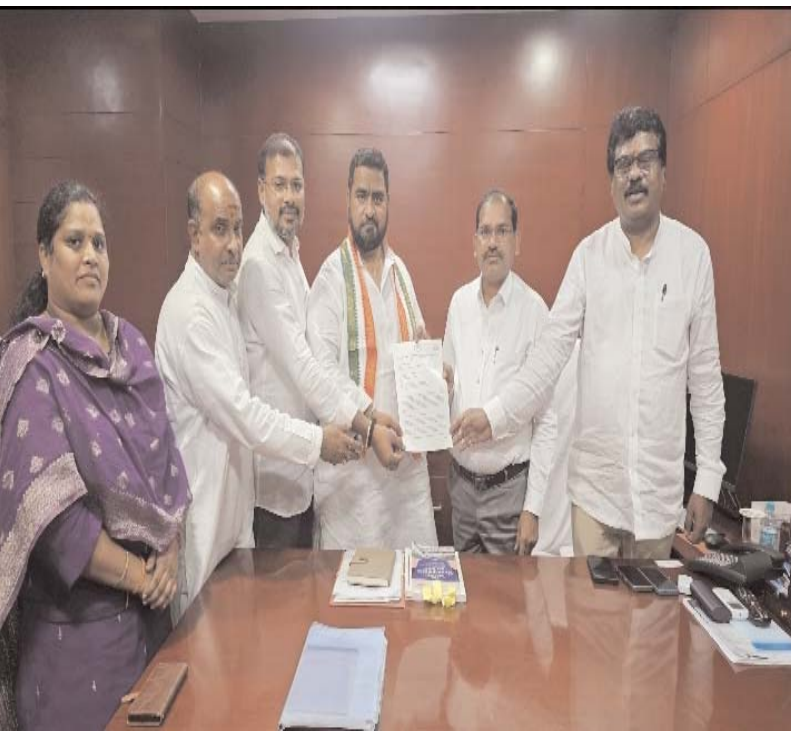
వ్యతిరేకిస్తున్నామన్నారు. ఎందుకంటే ఈ వీ2 మోడల్ ఈవీఎం లకు వివిపివీటీ ( Voter Verifiable Paper Audit Trail ) సౌకర్యం లేదు. ఓటర్లు ఇచ్చిన ఓటు సరిగ్గా వారు ఇష్టపడే అభ్యర్థికి పోయిందో తెలుసుకునే సౌకర్యం లేదు అందువలన ఎన్నికలకు బ్యాలెట్ పేపర్‌ను వినియోగించాలని కోరారు.