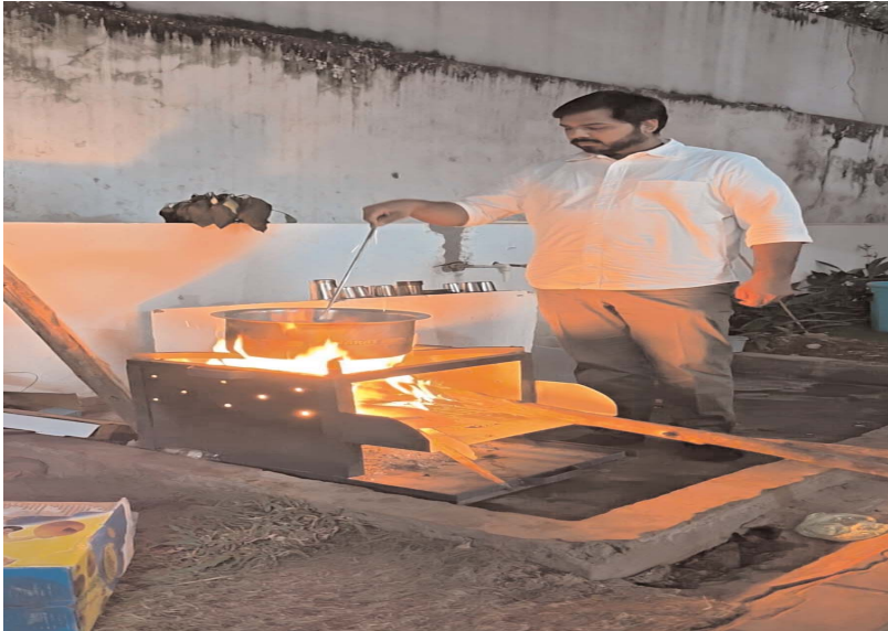
సరఫరాను తక్షణమే పునరుద్ధరించాలని కేంద్ర ప్రభుత్వాన్ని ఎంపీ డిమాండ్ చేశారు. ప్రజల సమస్యలపై ఎప్పటికప్పుడు స్పందిస్తూ వారి తరఫున పోరాటం కొనసాగిస్తామని ఎంపీ స్పష్టం చేశారు.

ప్రచారాల్లో మాత్రమే అభివృద్ధి: గ్యాస్ కొరతపై కట్టెల పాయింట్ నిరసన తెలిపిన ఎంపీ గడ్డం వంశీకృష్ణ