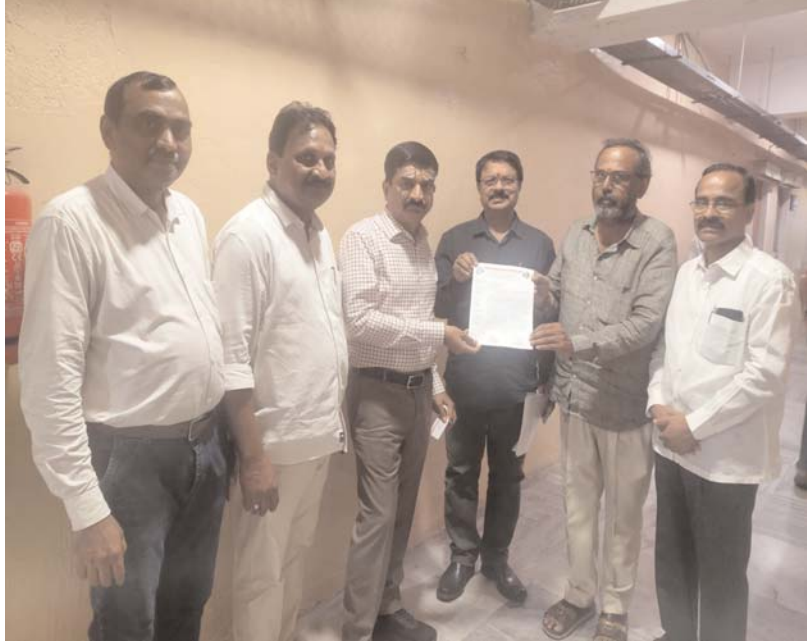
హైదరాబాద్ ప్రజాబలం ప్రతినిధి జర్నలిస్టుల పట్ల ప్రభుత్వం మానవతా దృక్పథంతో హైదరాబాద్, మే 15 : దశాబ్దాలుగా సాంతింటి కల నెరవేరక ఇబ్బందులు ఎదుర్కొంటున్న జర్నలిస్ట్ మ్యూచువల్ ఎయిడెడ్ కోఆపరేటివ్