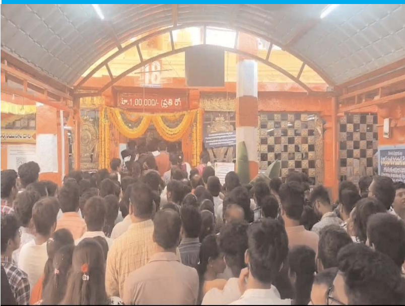
హైదరాబాద్ : 12 మే, వైశాఖ బహుళ దశమి

హనుమంతుని పురస్కారం కోసం ఉదయం 5 గంటల నుండి భక్తులు ఆధిక సంఖ్యలో విచ్చేసి శ్రీ స్వామివారి సింధూభిషేకము అర్చనలు జరిపించడానికి ఆలయానికి విచ్చేసినారు.