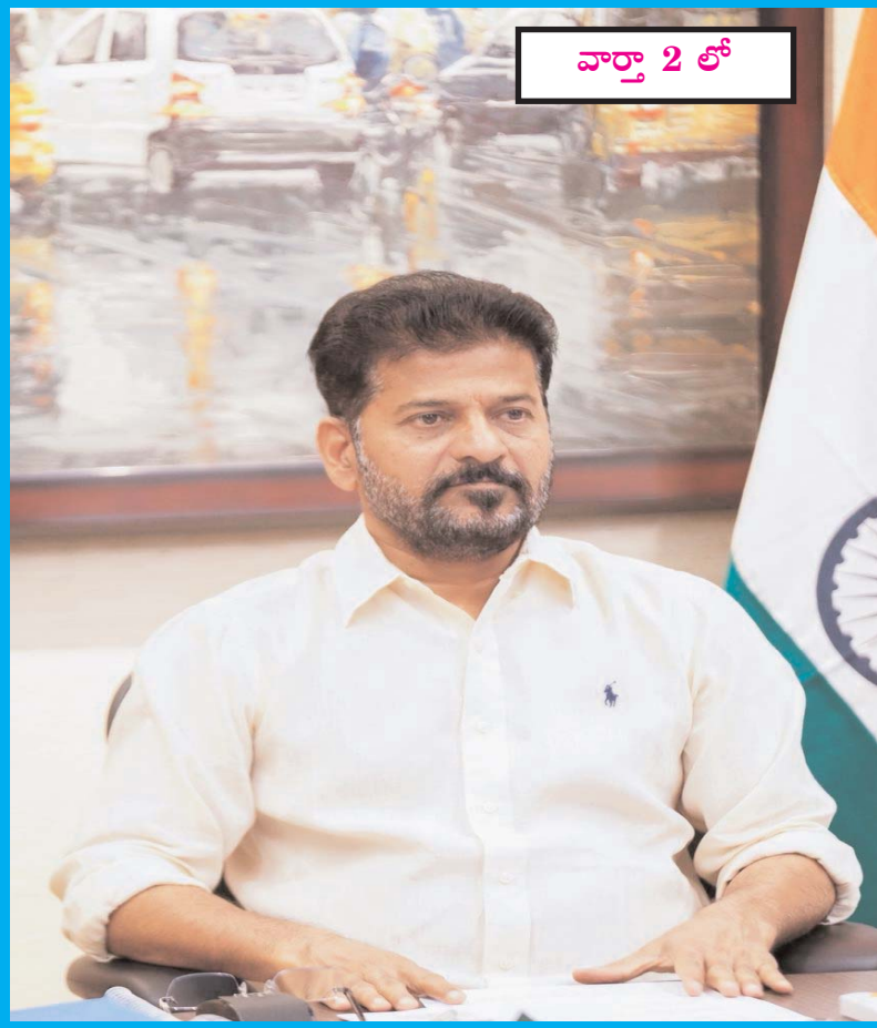
వార్తా 2 లో