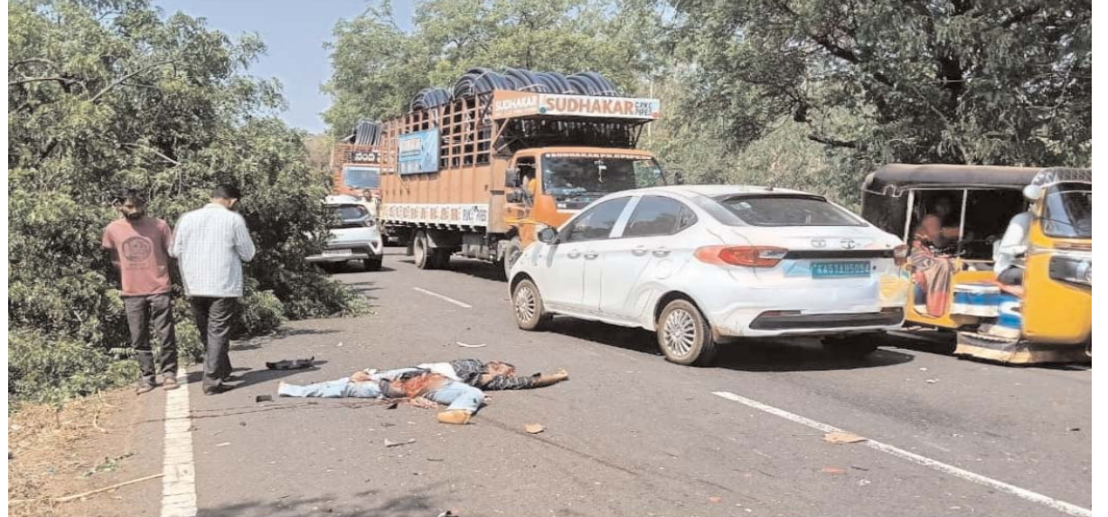
న్యూట్ కల్ మండలానికి చెందిన వారిని సమాచారం. పూర్తి వివరాలు ఇంకా తెలియాల్సి ఉంది.

జహీరాబాద్, మే 12 ప్రజాబలం ప్రతినిధి: తెలంగాణ కర్ణాటక సరిహద్దులో బీదర్ - జహీరాబాద్ రోడ్డుపై శంషల్పూర్ సమీపంలో ఘోర రోడ్డు ప్రమాదం జరిగింది. ఈ దుర్ఘటనలో ఐదుగురు మృతి చెందగా నలుగురు పరిస్థితి విషమంగా ఉంది. క్షతగాత్రులను కర్ణాటక బీదర్ ఆసుపత్రికి తరలించి మెరుగైన వైద్య చికిత్స అందిస్తున్నారు. జహీరాబాద్ - బీదర్ రోడ్డు, తెలంగాణ కర్ణాటక సరిహద్దు వద్ద మంగళవారం ఘోర రోడ్డు ప్రమాదం సంభవించింది. బీదర్ నుండి హైదరాబాద్ వచ్చున్న కర్ణాటక ఆర్టీసీ బస్సు ముందుగా వెళ్తున్న ద్వితీయ వాహనాన్ని డీకొని పట్టి కొట్టింది. ఈ ప్రమాదంలో ఐదుగురు మృతి చెందగా నలుగురికి తీవ్ర గాయాలయ్యాయి. మృతుల్లో ఇద్దరు