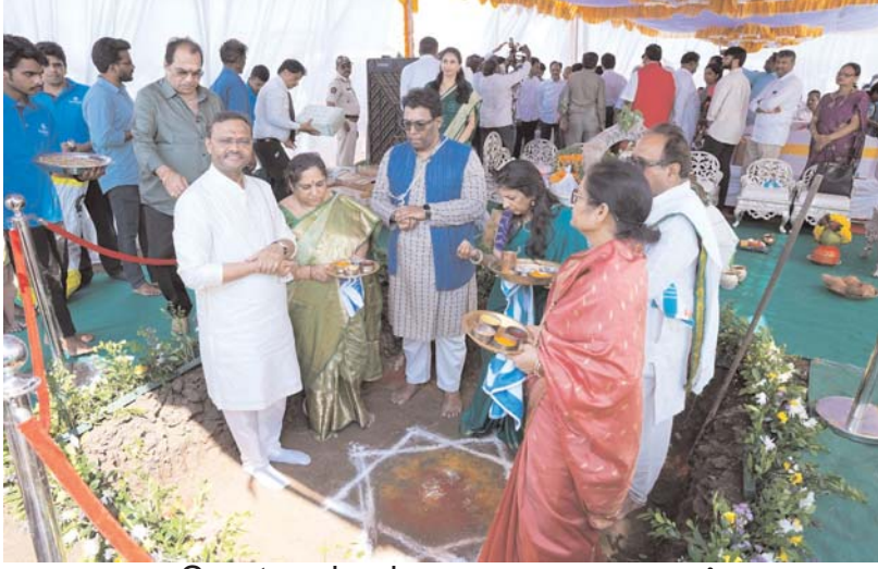
అమరావతిలో Courtyard by Marriott హోటల్ ప్రాజెక్టుకు భూమిపూజ నిర్వహించిన Southern Globe Hotels & Resorts

అమరావతి నగరాన్ని అంతర్జాతీయ స్థాయి హాస్పిటాలిటీ టూరిజం హబ్ గా తీర్చిదిద్దే దిశలో మరో కీలక ముందడుగుగా, Southern Globe Hotels & Resorts ఆధ్వర్యంలో నిర్వహించబడుతున్న ప్రతిష్టాత్మక Courtyard by Marriott హోటల్ ప్రాజెక్టుకు మే 8న ఘనంగా భూమిపూజ కార్యక్రమం నిర్వహించారు. ఈ కార్యక్రమంతో అమరావతి ప్రాంతంలో ప్రపంచ స్థాయి అతిథ్య సేవల అభివృద్ధికి నాంది పలికారు.