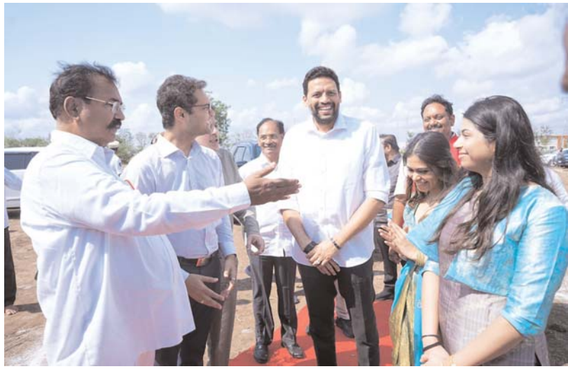
అవకాశాలు మరియు ప్రాంతీయ ఆర్థికాభివృద్ధికి

అమరావతి నగరాన్ని అంతర్జాతీయ స్థాయి హాస్పిటాలిటీ టూరిజం హబ్ గా తీర్చిదిద్దే దిశలో మరో కీలక ముందడుగుగా, Southern Globe Hotels & Resorts ఆధ్వర్యంలో నిర్వహించబడుతున్న ప్రతిష్టాత్మక Courtyard by Marriott హోటల్ ప్రాజెక్టుకు మే 8న ఘనంగా భూమిపూజ కార్యక్రమం నిర్వహించారు. ఈ కార్యక్రమంతో అమరావతి ప్రాంతంలో ప్రపంచ స్థాయి అతిథ్య సేవల అభివృద్ధికి నాంది పలికారు.