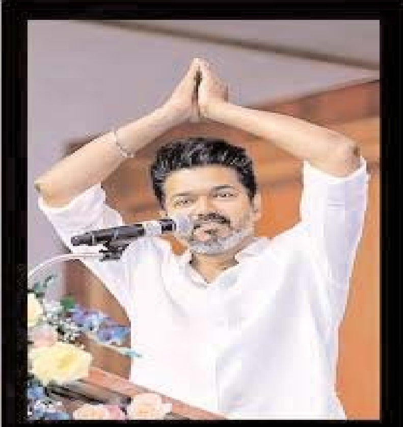
చెన్నై, మే 5, (న్యూస్ వర్క్) విజయ్ పార్టీ గెలిచింది. తను కూడా రెండు స్థానాలలో పోటీచేసి గెలిచారు. అతిపెద్ద పార్టీగా అవతరించి.. అధికారంలోకి రాగలిగాడు. ఒక మంచి రోజు చూసుకోని తమిళనాడు ముఖ్యమంత్రిగా ప్రమాణస్వీకారం చేస్తాడు. కౌతూకం ఏర్పడిన ప్రభుత్వానికి 6 నెలలపాటు హానియూస్ పీరియడ్ ఉంటుంది. ఆ తర్వాత అసలు సవారి మొదలవుతుంది. ప్రతిపక్షాలు అప్పటిదాకా ఎదురుచూస్తాయి. ఆ తర్వాత విమర్శలు మొదలు పెడతాయి. రాజకీయం అంటేనే అలా ఉంటుంది కదా.. అప్పటిదాకా విజయ్ ని అభిమానించిన వారు విమర్శలు చేస్తారు. ఏక వాక్యంతో సంతోషిస్తారు. అననరమైతే వ్యక్తిగత విషయాలను కూడా లాగుతారు. పైగా తమిళనాడు రాజకీయాలు అత్యంత దారుణంగా ఉంటాయి. విజయ్ ఎన్నికల ప్రచారంలో తమిళ ప్రజలకు అనేక హామీలు ఇచ్చారు.. మహిళలకు ప్రతినెల 2500 అడ్డంకి సాయం చేస్తామని ప్రకటించారు. పెళ్ళికానుకగా వధువుకు వినిమిది గ్రాముల బంగారం, పట్టువీర ఇస్తామని వెల్లడించారు. ఉద్యోగాలు లేని గ్రామీణులకు ప్రతినెల 4000 రూపాయల భృతి ఇస్తామని వెల్లడించారు. దివ్యాంగులకు, వృద్ధులకు ప్రతినెల