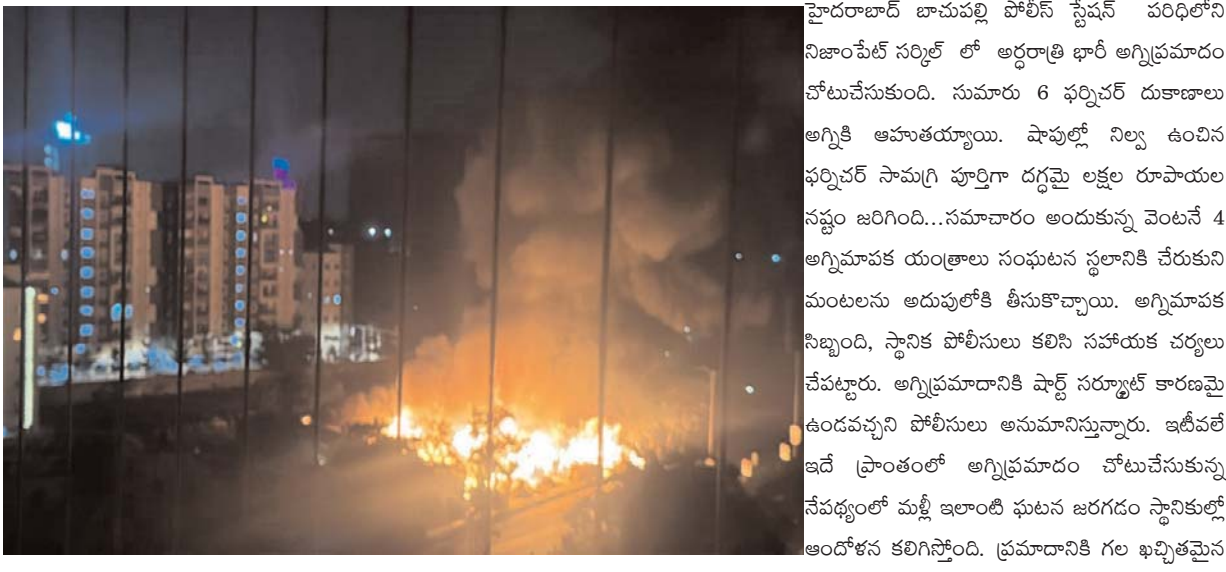
హైదరాబాద్ బాచుపల్లి పోలీస్ స్టేషన్ పరిధిలోని నిజాంపేట్ సర్కిల్ లో అగ్రరాత్రి ఛార్జి అగ్నిప్రమాదం చోటుచేసుకుంది. సుమారు 6 ఫర్చర్ దుకాణాలు అగ్నికి ఆహుతయ్యాయి. షాపుల్లో నిల్వ ఉంచిన ఫర్చర్ సామగ్రి పూర్తిగా దగ్ధమై లక్షల రూపాయల నష్టం జరిగింది... సమాచారం అందుకున్న వెంటనే 4 అగ్నిమాపక యంత్రాలు సంఘటన స్థలానికి చేరుకుని మంటలను అదుపులోకి తీసుకొచ్చాయి. అగ్నిమాపక సిబ్బంది, స్థానిక పోలీసులు కలిసి సహాయక చర్యలు చేపట్టారు. అగ్నిప్రమాదానికి పాల్పడ్డ సర్కారుపై కారణమై ఉండవచ్చని పోలీసులు అనుమానిస్తున్నారు. ఇటీవలే ఇదే ప్రాంతంలో అగ్నిప్రమాదం చోటుచేసుకున్న నేపథ్యంలో మళ్లీ ఇలాంటి ఘటన జరగదని స్థానికుల్లో అందోళన కలిగిస్తోంది. ప్రమాదానికి గల ఖచ్చితమైన కారణాలపై పోలీసులు దర్యాప్తు చేస్తున్నారు. ఈ ఘటనలో ఎవరికి ఎలాంటి ప్రాణాపాయం జరగకపోవడం ఉపశమనంగా మారింది. ప్రమాదానికి గల ఖచ్చితమైన కారణాలపై పోలీసులు దర్యాప్తు చేస్తున్నారు.