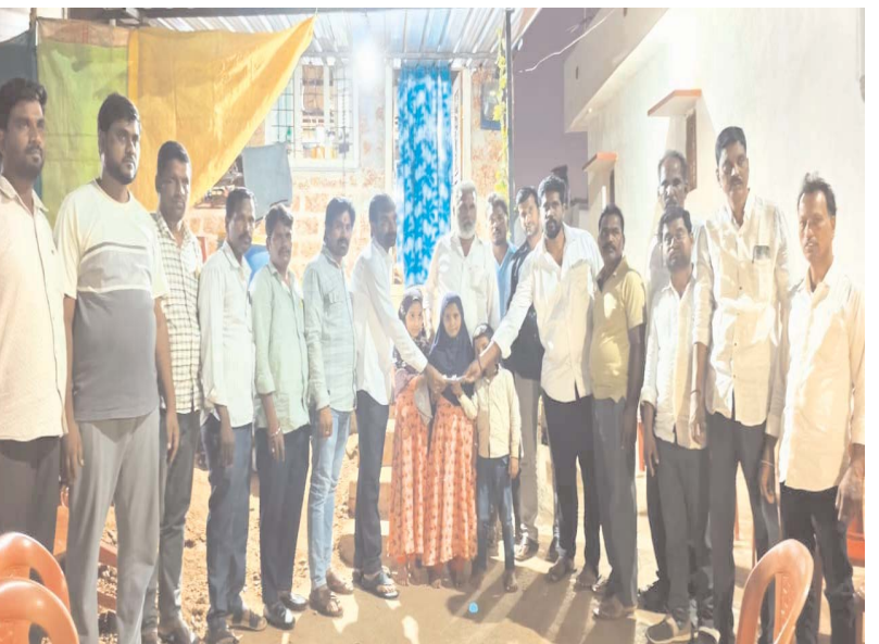
అంతేకాకుండా భవిష్యత్తులో కూడా ఎలాంటి సమస్యలు వచ్చినా తమ దృష్టికి తీసుకురావాలని, తమ వంతు సహాయం ఎల్లప్పుడూ కొనసాగుతుందని మిత్రులు హామీ ఇచ్చారు. కష్టకాలంలో స్నేహితులు ముందుకు రావడం నిజమైన స్నేహబంధానికి నిదర్శనమని గ్రామస్థులు అభిప్రాయపడ్డారు.

సర్వర్ ఇటీవల హార్ట్ ప్రోబ్లెమ్ తో ఆకస్మికంగా మృతి చెందాడు. కుటుంబానికి అతడే ప్రధాన ఆదారం కావడంతో భార్యతో పాటు నలుగురు చిన్నారులు తీవ్ర విషాదంలో మునిగిపోయారు. కుటుంబం ప్రస్తుతం ఆర్థిక ఇబ్బందులను ఎదుర్కొంటోంది. ఈ దుర్ఘటన తెలుసుకున్న సర్వర్ 10వ తరగతి స్నేహితులు వెంటనే స్పందించి తమ మానవత్వాన్ని చాటుకున్నారు. తమకు తోచినంతగా విరాళాలు సేకరించి శుక్రవారం రాత్రి మృతుడి కుటుంబానికి అందజేశారు. ఈ సందర్భంగా సర్వర్ కుటుంబ సభ్యులను వరామర్చించి, వారికి ధైర్యం చెప్పి అండగా నిలిచారు.