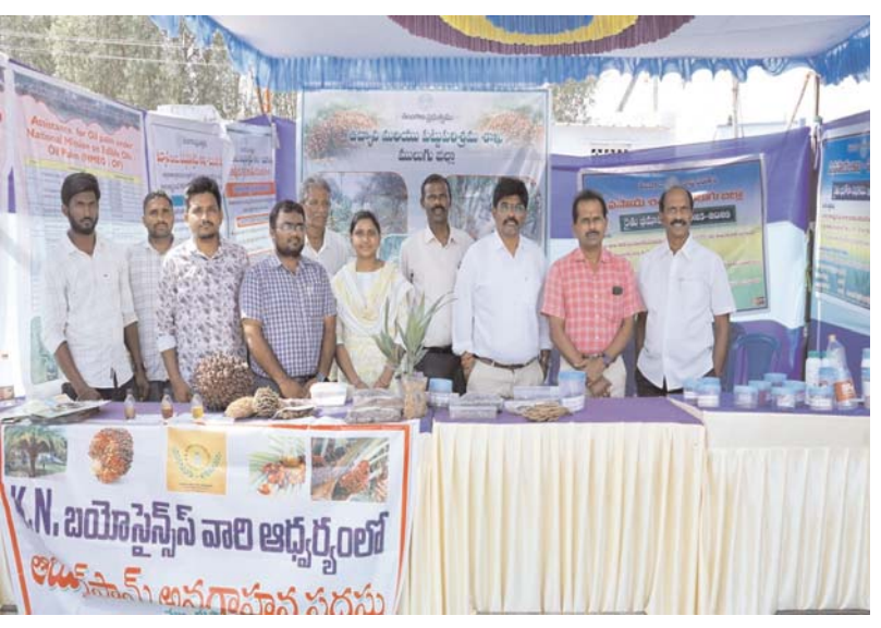
ప్రతినిధులు సమన్వయంతో ప్రభుత్వం అమలు చేస్తున్న సంక్షేమ పథకాలను ప్రజలలోకి తీసుకువెళ్లాలి కోరారు.

ఈ సందర్భంగా సంబంధిత శాఖ అధికారులు 99 రోజుల ప్రజా పాలన ప్రగతి ప్రణాళిక