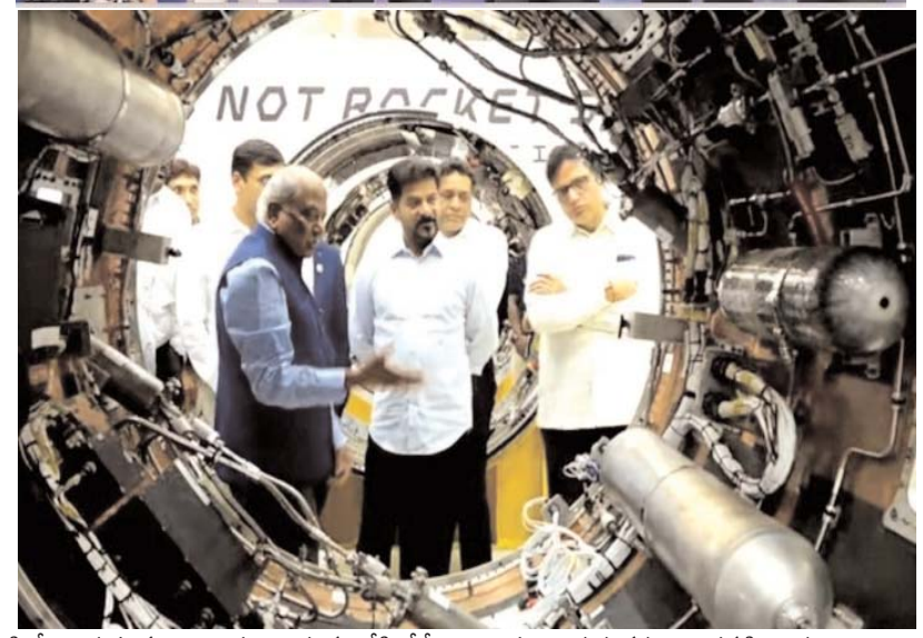
కిలోల బరువు గల రాకెట్లను అంతరిక్షంలోకి చేర్చే ఉందని ఆయన గర్వంగా ప్రకటించారు. సామర్థ్యం తాము రూపొందించిన విక్రమ్-1 కు