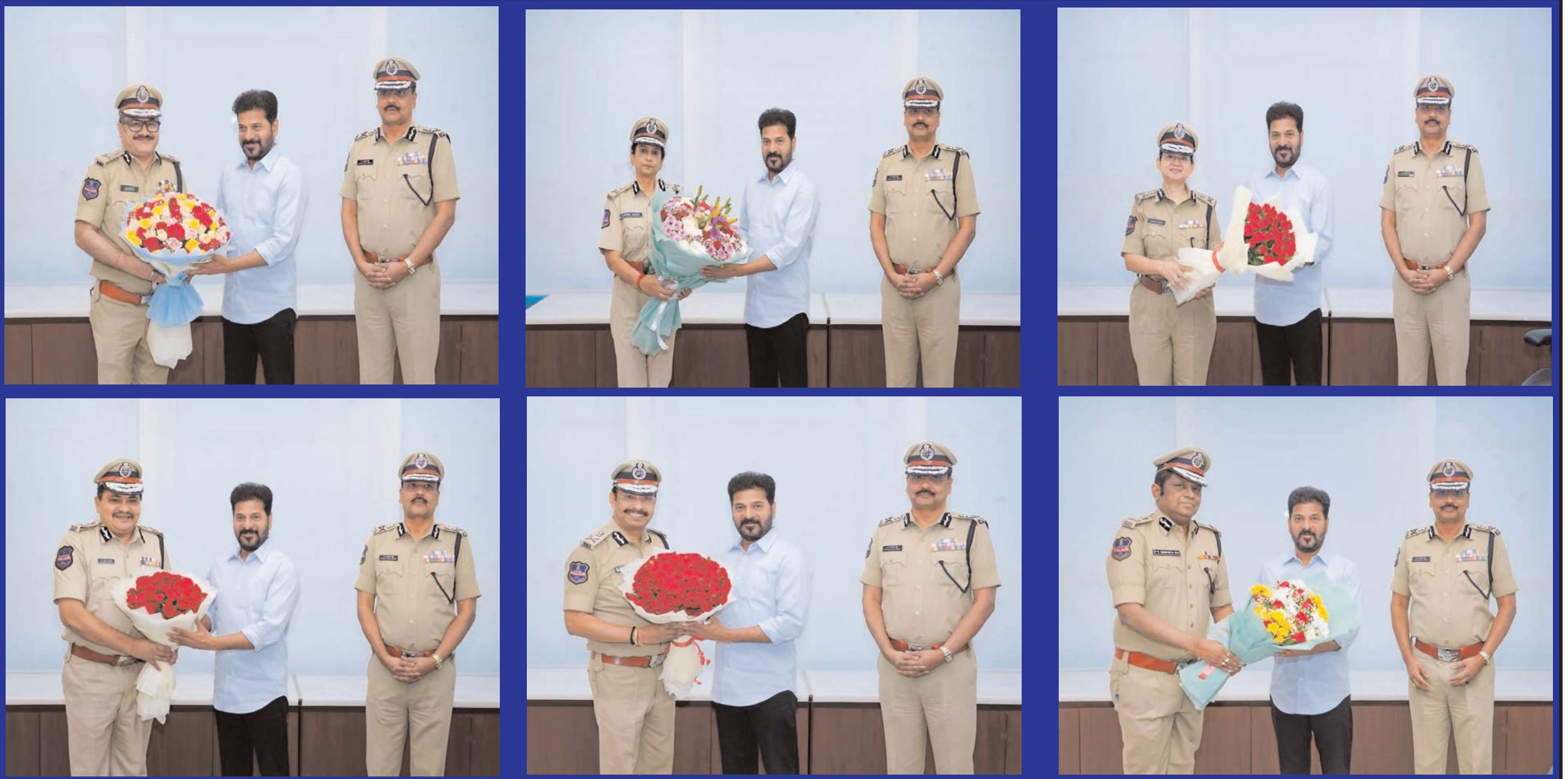
హైదరాబాద్ ప్రజాబలం ప్రతినిధి ముఖ్యమంత్రి రేవంత్ రెడ్డి ని ఐసీసీసీ లో మర్యాదపూర్వకం గా కలిసిన డీ.జి.పీ (DGP) ర్యాంక్ ప్రమోషన్ పొందిన సీనియర్ ఐపీఎస్ అధికారులు వి.వి. శ్రీనివాసరావు ,స్వాతి లక్ష్మి ,మహేష్ భాగవత్ ,చారు సిన్హా,డా. అనిల్ కుమార్ ,వి.సి. సజ్జనార్ .