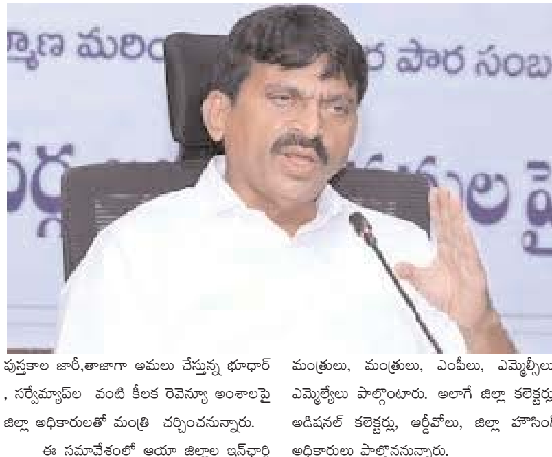
పుస్తకాల జారీ, తాజాగా అమలు చేస్తున్న భూదార మంత్రిలు, మంత్రిలు, ఎంపీలు, ఎమ్మెల్యేలు, సర్వేమ్యాపిల వంటి కీలక రెవెన్యూ అంశాలపై ఎమ్మెల్యేలు పాల్గొంటారు. అలాగే జిల్లా కలెక్టర్లు, జిల్లా అధికారులతో మంత్రి చర్చించనున్నారు. అడిషనల్ కలెక్టర్లు, ఆర్టీసీలు, జిల్లా హౌసింగ్ అధికారులు పాల్గొనున్నారు.

హైదరాబాద్ :- ఇందిరమ్మ ఇళ్లు, రెవెన్యూ దశలవారీగా నిర్వహించనున్నారు. రాష్ట్రంలో అంశాలపై రాష్ట్ర రెవెన్యూ, హౌసింగ్, సమాచార శాఖ మంత్రి పొంగులేటి తొలి విడతగా మూడున్నర లక్షల ఇందిరమ్మ ఇళ్ల పౌరసంబంధాల శాఖ మంత్రి పొంగులేటి మంజూరు. సుమారు లక్షకు పైగా ఇళ్లు గృహ శ్రీనివాసరెడ్డి సోమవారం నుండి క్షేత్రస్థాయి ప్రవేశాలకు సిద్దమైన నేపథ్యంలో మంత్రి గారు సమీక్షలకు శ్రీకారం చుట్టినారు. ఈ మేరకు నిర్వహించే ఈ సమావేశం ప్రాధాన్యతను హిమాచల్ నగర్ లోని హౌసింగ్ కార్పొరేషన్ సంతరించుకుంది. అసంపూర్ణ గా ఉన్న డబల్ బెడ్ రూమ్ ఇళ్ల పూర్తి, కేటాయింపు, మౌలిక వసతుల కల్పన వంటి విషయాలను కూడా చర్చించనున్నారంతగా త్వరలో రెండవ విడత ప్రతినిధులు, కలెక్టర్లతో సమీక్ష సమావేశం ఇళ్ల మంజూరుకు సంబంధించి కూడా ఈ సమావేశంలో చర్చించే అవకాశాలు ఉన్నాయి. రాష్ట్రంలోని అన్ని జిల్లాలకు సమావేశంలో చర్చించే అవకాశాలు ఉన్నాయి. అదేవిధంగా భూ వివాదాలు, పట్టణాల పాస్