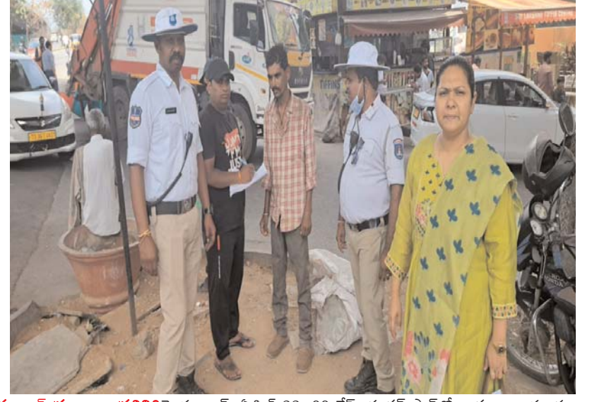
హైదరాబాద్ ప్రజాబలం ప్రతినిధి హైదరాబాద్, ఏప్రిల్ 22: 99 డేస్ యాక్షన్ ప్లాన్ లో భాగంగా బుధవారం