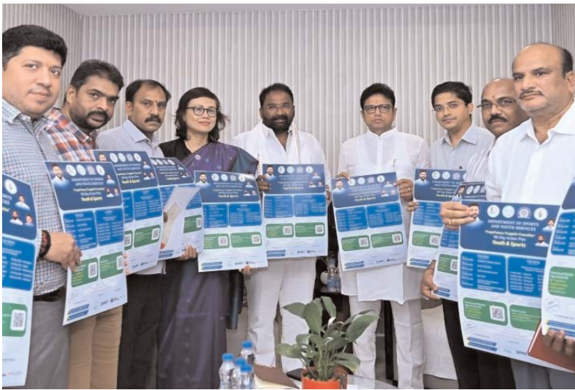
జిల్లాల్లో ఉద్యోగ మేళాలు నిర్వహిస్తున్నట్లు వారు తెలిపారు.

ఇందులో భాగంగా మే ఒకటవ తేదీ మహబూబ్ నగర్ జిల్లాలో 2 తేదీ నల్గొండ జిల్లాలో నాలుగవ తేదీ ఖమ్మం జిల్లాలో 5వ తేదీ వరంగల్ జిల్లాలో ఆరవ తేదీ కరీంనగర్ పెద్దపల్లి జిల్లాలో 7 మే నాడు అదిలాబాద్ జిల్లాలో 8వ మే నాడు నిజామాబాద్ జిల్లాలో 11వ తేదీ నాడు రంగారెడ్డి జిల్లాలో 12వ తేదీ హైదరాబాద్