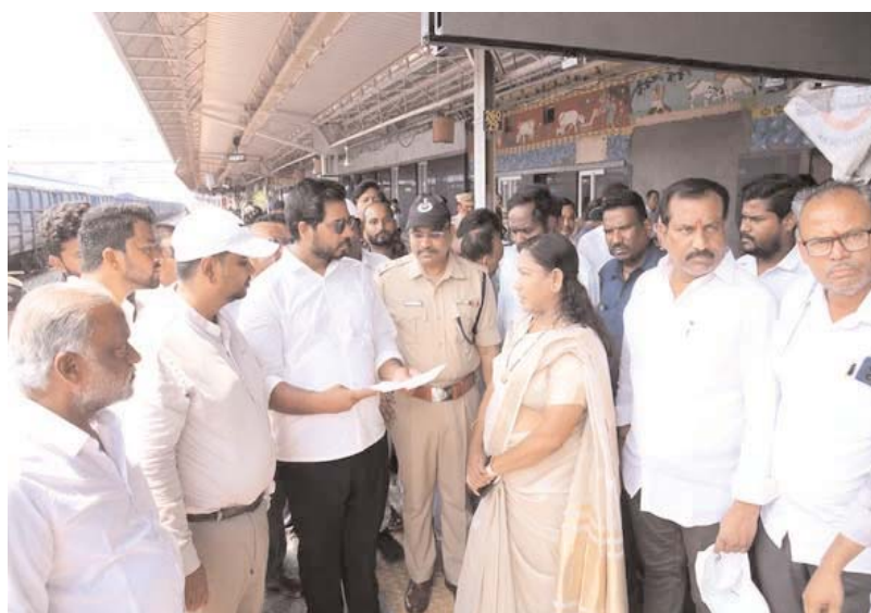
సమస్యలను వెంటనే పరిష్కరించే విధంగా అధికారులను స్పందించాలని, ప్రజలకు ఎలాంటి ఇబ్బందులు లేకుండా సేవలు అందించాలని ఆదేశించారు. ఈ కార్యక్రమంలో జిల్లా కలెక్టర్, డీసీపీ, ప్రజాప్రతినిధులు, కార్యకర్తలు పాల్గొన్నారు.

మంచుర్యాల పెద్దపల్లి పార్లమెంట్ సభ్యుడు గడ్డం వంశీకృష్ణ మంగళవారం మంచుర్యాల రైల్వే స్టేషన్ ను సందర్శించి, అమ్మత్ భారత్ స్టేషన్ పథకం కింద జరుగుతున్న అభివృద్ధి పనులను సవివరంగా పరిశీలించారు. పనుల నాణ్యతపై ఎలాంటి రాజీ ఉండకూడదని స్పష్టం చేస్తూ, ప్రతి పని సమయానికి పూర్తి కావాలని అధికారులను ఆదేశించారు. ప్రయాణికులకు సురక్షితమైన, ఆధునిక సౌకర్యాలు అందించడమే ప్రధాన లక్ష్యమని పేర్కొన్నారు. స్టేషన్ పరిసరాల పరిశుభ్రత, తాగునీరు, కూర్చునే సదుపాయాలు, లైటింగ్, పార్కింగ్ వంటి అంశాలపై ప్రత్యేక దృష్టి సారించాలని సూచించారు. అదనంగా, వృద్ధులు, మహిళలు, దివ్యాంగుల కోసం ప్రత్యేక సౌకర్యాలు కల్పించాలన్నారు. ప్రయాణికుల