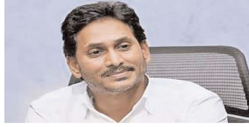
విదేశీ ప్రయాణాలకు కోర్టు అనుమతి తప్పనిసరి కావడంతో జగన్ ఈ పిటిషన్ దాఖలు చేశారు. అయితే, ఈ విదేశీ పర్యటన సంబంధించి న్యాయస్థానం కొన్ని కఠినమైన ప్రశ్నలను విధించింది. ప్రయాణానికి ముందే తన పూర్తి పర్యటన వివరాలు, కాంటాక్ట్ నెంబర్లు, ఈ-మెయిల్ ఐడీ, అవసరమైన షూటింగ్ వివరాలను సీబీఐ అధికారులకు సమర్పించాలని ఆదేశించింది. ప్రస్తుతం ఏపీటీ రాజకీయ సమీక్షలను మారుతున్న తరుణంలో, జగన్ సుమారు మూడు వారాల పాటు విదేశీ పర్యటనకు వెళుతుండటం రాజకీయ వర్గాల్లో అసంతోషం చర్చకు దారితీసింది. కుటుంబ సభ్యులతో కలిసి వ్యక్తిగత పర్యటన ముగించుకున్నాక, మే పుర్వో ఆయన తిరిగి రాష్ట్రానికి చేరుకోనున్నారు.

వైసీపీ అధినేత జగన్ మరోసారి విదేశీ పర్యటనకు సిద్ధమయ్యారు. తన కుటుంబ సభ్యులతో కలిసి యూకేతో పాటు యూరప్లోని పలు దేశాలను సందర్శించేందుకు అనుమతి కోరుతూ ఆయన దాఖలు చేసిన పిటిషన్ నీబీఐ ప్రత్యేక న్యాయస్థానం సానుకూలంగా స్పందించింది. ఈ నెల 20వ తేదీ నుంచి మే 15వ తేదీ వరకు, అంటే మొత్తం 25 రోజుల పాటు విదేశాల్లో గడిపేందుకు కోర్టు ఆయనకు అనుమతి మంజూరు చేసింది. అక్రమస్తుల కేసు విచారణలో ఉన్న నేపథ్యంలో, విదేశీ ప్రయాణాలకు కోర్టు అనుమతి తప్పనిసరి కావడంతో జగన్ ఈ పిటిషన్ దాఖలు చేశారు. అయితే, ఈ విదేశీ పర్యటన సంబంధించి న్యాయస్థానం కొన్ని కఠినమైన ప్రశ్నలను విధించింది. ప్రయాణానికి ముందే తన పూర్తి పర్యటన వివరాలు, కాంటాక్ట్ నెంబర్లు, ఈ-మెయిల్ ఐడీ, అవసరమైన షూటింగ్ వివరాలను సీబీఐ అధికారులకు సమర్పించాలని ఆదేశించింది. ప్రస్తుతం ఏపీటీ రాజకీయ సమీక్షలను మారుతున్న తరుణంలో, జగన్ సుమారు మూడు వారాల పాటు విదేశీ పర్యటనకు వెళుతుండటం రాజకీయ వర్గాల్లో అసంతోషం చర్చకు దారితీసింది. కుటుంబ సభ్యులతో కలిసి వ్యక్తిగత పర్యటన ముగించుకున్నాక, మే పుర్వో ఆయన తిరిగి రాష్ట్రానికి చేరుకోనున్నారు.