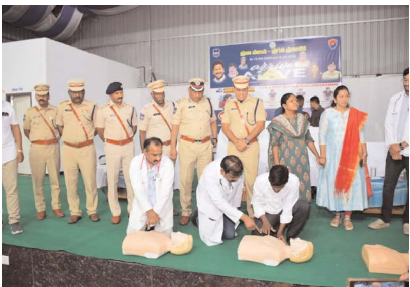
రాజన్న సిరిసిల్ల జిల్లా, ఏప్రిల్ - 17(ప్రజాబలం ప్రతినిధి)వాహనాలు నడిపే సమయంలో జాగ్రత్తలు పాటించడం ద్వారా రోడ్డు ప్రమాదాలను నివారించవచ్చని రాష్ట్ర రైల్వే, రోడ్డు భద్రత ఐజీపీ నాయుడు ఐపీఎస్ పేర్కొన్నారు.ప్రజాపాలన- ప్రగతి ప్రణాళిక 99

రోజుల కార్యచరణలో భాగంగా జిల్లా పోలీస్ శాఖ,రవాణా శాఖ ఆధ్వర్యంలో ఈ నెల 13వ తేదీ నుంచి 18వ తేదీ నుంచి వారోళ్ళువాల సందర్భంగా అరైవ్.. అరైవ్ కార్యక్రమాన్ని జిల్లా కేంద్రంలోని కే కన్వెన్షన్ హాల్ లో జిల్లాలోని ఆర్టీసీ, విద్యాసంస్థలు, ఆటో, మున్సిపల్, ఇతర