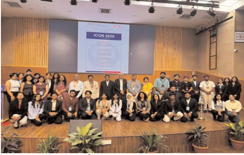
హైదరాబాద్, ఏప్రిల్ 17, 2026: ఐసీఎఫ్ఐఐ లా స్కూల్, ఐఎఫ్ఐఐఐ హైదరాబాద్లో ఐసీఎఫ్ఐఐ కాన్ఫరెన్స్ ఆఫ్ నేషన్స్ (ICON 2026) 10వ ఎడిషన్కు శుభారంభం జరిగింది.