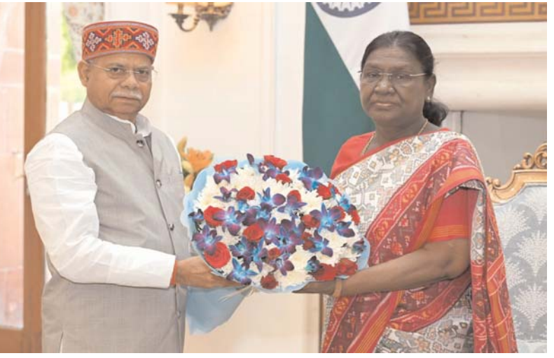
హైదరాబాద్, ఏప్రిల్ 10, తెలంగాణ గవర్నర్ శివప్రతాప్ శుక్లా కుకవారం ఢిల్లీలో రాష్ట్రపతి ద్రౌపదిముర్ము తో భేటీ అయ్యారు. తెలంగాణ గవర్నర్ గా బాధ్యతలు చేపట్టిన తర్వాత ఆయన తొలిసారి రాష్ట్రపతి భవన్ లో రాష్ట్రపతిని మర్యాదపూర్వకంగా కలిశారు.