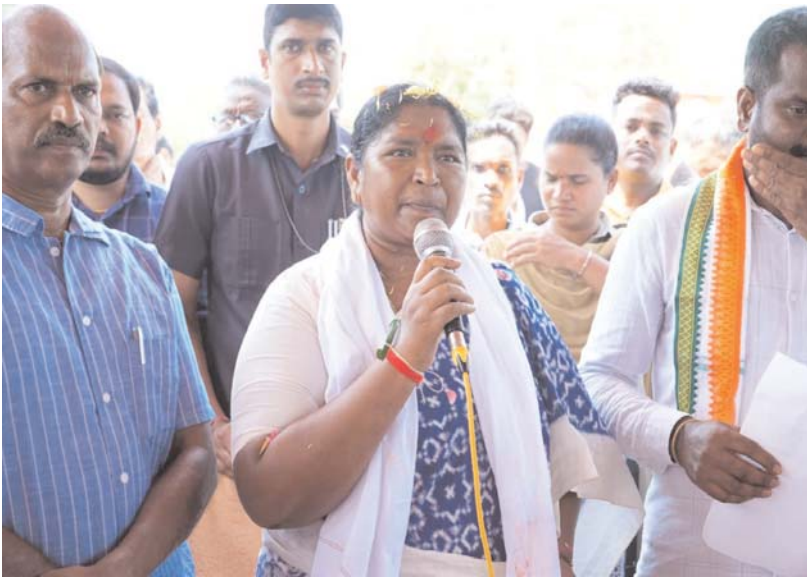
ములుగు జిల్లా ప్రజాబలం ప్రతినిధి ఏప్రిల్ 10 సుమారు 83 లక్షలతో ఆర్ అండ్ బి రోడ్డు నుండి ,04 2026కుక్కువారం ములుగు జిల్లా సమృద్ధి అంకంపల్లి వరకు బిడి రోడ్డు నిర్మాణానికి రాష్ట్ర సారలము తాదాము మండలం గంగారం గ్రామ పంచాయతీ పరిధిలోని అన్నారం గ్రామంలో పంచాయతీరాజ్ ఇంజనీరింగ్ విభాగం అదే గ్రామానికి చెందిన ఇందిరమ్మ ఇండ్ల ఆధ్వర్యంలో 15 లక్షల రూపాయలతో అర్బిడారుల ఇందిరమ్మ ఇళ్లకు రిబ్బన్ కట్ చేసి సి.సి. ఆర్ నిధుల తో చేపట్టనున్న అంతర్గత గృహ ప్రవేశం చేశారు. పలువురు అర్బిడారులకు సి.సి. రోడ్ నిర్మాణ వనరులకు, అంకంపల్లి ఇందిరమ్మ ఇళ్ల మంజూరు పట్టాలను పంపిణీ గ్రామంలో ఇన్స్పెక్టర్ అడిడిఎ నిధులు చేశారు. స్థానిక అంగన్వాడీ కేంద్రాన్ని సందర్శించి

మౌలిక సదుపాయాల కల్పన పలు అంశాలపై నెరవేరుస్తూ ముఖ్యమంత్రి రేవంత్ రెడ్డి అంగన్వాడీ చిన్నారులను స్వయంగా అడిగి తెలుసుకున్నారు. ఈ సందర్భంగా మంత్రి సీతక్క మాట్లాడుతూ జిల్లా అభివృద్ధి పేదల సంక్షేమమే ప్రజా ప్రభుత్వ ధ్యేయమని మారుమూల ప్రాంతాల అభివృద్ధి, గిరిజన సంక్షేమం కోసం ప్రత్యేక దృష్టి సారించిందని పేర్కొన్నారు. అంకంపల్లి గ్రామాన్ని అదర్భ గ్రామంగా ఎంపిక చేసి సైలెంట్ ప్రాజెక్ట్ ద్వారా అన్ని మౌలిక వసతులు కల్పిస్తూ మంజూరు అయిన ఇందిరమ్మ ఇండ్ల నిర్మాణాలు తుది దశకు చేరుకున్నాయని, గతంలో రోడ్డు సౌకర్యం లేకపోవడంతో స్థానిక ప్రజలు అనేక ఇబ్బందులు ఎదురున్నారని ప్రజలకు రవాణా సౌకర్యాలను కల్పించడం కోసం ఆర్ అండ్ బి రోడ్డు నుంచి గ్రామం వరకు బీడి రోడ్డు నిర్మాణానికి శంకుస్థాపన చేయడం జరిగిందని అత్యంత నాణ్యత ప్రమాణాలు పాటిస్తూ రోడ్డు పనులు చేపట్టాలని సూచించారు. ప్రజా ప్రభుత్వం అధికారంలోకి వచ్చిన నాటి నుండి పేదల సంక్షేమం కోసం అనేక పథకాలు ప్రవేశపెట్టినందున తెలిపారు. గూడు లేని ప్రతి పేదవాడికి సొంత ఇంటి కల