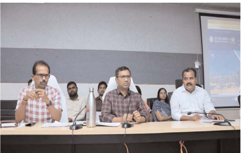
వాహనం" అమలు మన ములుగు జిల్లా లోని 10

ములుగు జిల్లా ప్రజాబలం ప్రతినిధి ఏప్రిల్ 9 ములుగు నేటి నుండి వది మండలాలలో "మన ఇసుక వాహనం" అమలుగురువారం జిల్లా కలెక్టరేట్ సమావేశ మందిరంలో జిల్లాలో జరుగుతున్న అభివృద్ధి పనులపై సంబంధిత అధికారులతో జిల్లా కలెక్టర్ దివాకర టి.ఎస్. సమీక్ష సమావేశాన్ని నిర్వహించారు.