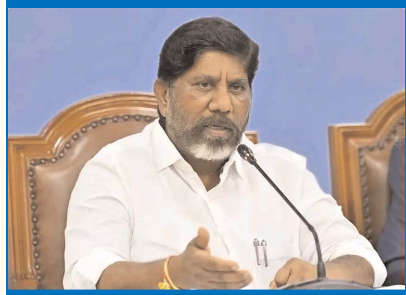
హైదరాబాద్ ఏప్రిల్ 9: జూన్ 2వ తేదీ నుంచి ప్రభుత్వ పాఠశాలల్లో అల్పాహార పథకం ప్రారంభించనున్నట్లు Dy.CM భట్టి విక్రమార్య తెలిపారు. అలాగే రానున్న విద్యా సంవత్సరం నుంచి ఇంటర్ విద్యార్థులకు మధ్యాహ్నం భోజనం అందించనున్నట్లు వివరించారు. అలాగే 100 యంగ్ ఇండియా స్కూల్స్ నిర్మాణం చేపట్టామన్నారు. ప్రతి నియోజకవర్గంలో తెలంగాణ పబ్లిక్ స్కూల్ ప్రారంభిస్తామని చెప్పారు. అంతరాలు లేని, ఆదర్శ సమాజం విద్య ద్వారానే సాధ్యమని వివరించారు.