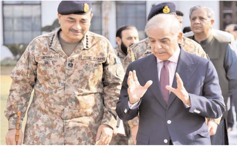
అంతర్జాతీయ రాజకీయాల్లో కీలక పరిణామంగా భావించిన అమెరికా-ఇరాన్ కాల్పుల విరమణ ఒప్పందంపై తీవ్ర గందరగోళం నెలకొంది. ఇరు దేశాల మధ్య ఉద్రిక్తతలను తగ్గించేందుకు పాకిస్తాన్ చేసిన మధ్యవర్తిత్వంతో రెండు వారాల పాటు కాల్పుల విరమణకు అంగీకారం కుదిరింది. అయితే, ఈ ఒప్పందంలో లెబనాన్ ను చేర్చడంపై పాకిస్తాన్, అమెరికా పరస్పర విరుద్ధ ప్రకటనలు చేయడంతో చర్చలకు ముందే దౌత్యపరమైన వివాదం రాజుకుంది.

పాకిస్తాన్ ప్రధాని షేహబాజ్ షరీఫ్ సోషల్ మీడియా ద్వారా స్పందిస్తూ, "ఇరాన్, అమెరికా సహా వాటి మిత్రదేశాల మధ్య లెబనాన్ తో సహా అన్నిచోట్లా తక్షణమే కాల్పుల విరమణ అమల్లోకి వచ్చింది" అని ప్రకటించారు. శనివారం నుంచి ఇస్లామాబాద్ లో ఇరు దేశాల ప్రతినిధులు చర్చలు జరుపుతారని ఆయన తెలిపారు. అయితే, షేహబాజ్ షరీఫ్ ప్రకటన చేసిన కొద్దిసేపటికే అమెరికా, ఇజ్రాయెల్ వర్గాలు దీనిని ఖండించాయి. ఈ ఒప్పందం కేవలం ఇరాన్ కు మాత్రమే పరిమితమని, ఇందులో లెబనాన్ ప్రస్తావన లేదని స్పష్టం చేశాయి. అమెరికా ఉపాధ్యక్షుడు జేడ్ బైడెన్ మాట్లాడుతూ, "కాల్పుల విరమణలో లెబనాన్ కూడా ఉందని ఇరాన్ భావించి ఉండవచ్చు, కానీ అది వాస్తవం కాదు. మేం అలాంటి హామీ ఎప్పుడూ ఇవ్వలేదు" అని తేల్చిచెప్పారు. ఈ విరుద్ధ ప్రకటనలతో పాకిస్తాన్ మధ్యవర్తిత్వం