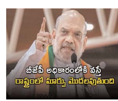
బీజేపీ అధికారంలోకి వస్తే రాష్ట్రంలో మార్పు మొదలవుతుంది

పశ్చిమ బెంగాల్ లో ఒక్కసారి బీజేపీ అధికారంలోకి వస్తే రాష్ట్రంలో మార్పు మొదలవుతుందని కేంద్రమంత్రి అమిత్ షా అన్నారు. అసోంలోని బరాక్ లోయలో జరిగిన ఎన్నికల ప్రచార సభలో ఆయన మాట్లాడుతూ, పశ్చిమ బెంగాల్ లో అభివృద్ధి జరగాలన్నా, అక్రమ చౌరబాటుదారులను తరిమికొట్టాలన్నా అది బీజేపీకి సాధ్యమని అన్నారు. అసోంలోని బరాక్ ప్రాంతంలో బెంగాలీలు ఎక్కువగా ఉంటారు. దీనితో ఆయన ఇక్కడ చౌరబాటుల అంశాన్ని ప్రస్తావించారు. పౌరసత్వ చట్టసవరణ ప్రకారం గూఢచర్యం చేసే వ్యక్తులకు దేశంలో స్థానం లేదని అన్నారు. కానీ ఈ చట్టాన్ని కాంగ్రెస్ వ్యతిరేకిస్తోందని ఆగ్రహం వ్యక్తం చేశారు. రెడ్ కాపర్స్ వేసి మరీ అక్రమ చౌరబాటుదారులకు ప్రవేశం కల్పిస్తోందని విమర్శించారు. అక్రమ చౌరబాటుదారులకు ఆశ్రయమిచ్చేందుకు భారత్ ఏమీ ధర్మసత్రం కాదని వ్యాఖ్యానించారు. బెంగాల్ లో బీజేపీకి అధికారం ఇస్తే మార్పు చేసి చూపిస్తామని హామీ ఇచ్చారు. బెంగాల్ లో ఇప్పటికే తిప్పవేసిన చౌరబాటుదారులను వారి దేశానికి తరిమికొడతామని హెచ్చరించారు. కాంగ్రెస్ నాయకులకు అసలు ప్రజల కష్టాలు తెలుసుకోవాలనే ఉద్దేశం ఉందని విమర్శించారు. రాహుల్ గాంధీ నిరసనకారులను కూడా ప్రశంసిస్తారని ఎద్దేవా చేశారు. అస్సామ్, బెంగాలీలను సంప్రదాయ భాషలుగా ప్రకటించేందుకు మోదీ ఆలోచన చేస్తున్నారని తెలిపారు.