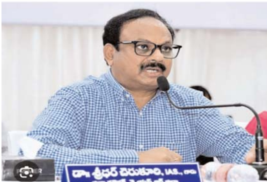
అక్రెడిటేషన్ కలిగిన జర్నలిస్టులు ఈ సౌకర్యాలను సద్వినియోగం చేసుకోవాలని కోరారు. రక్త పరీక్షలు, లిపిడ్ ప్రొఫైల్ పరీక్షల కోసం, ఖాళీ కరువుతో రావాలని, అలాగే గతంలో చేయించుకున్న వైద్య పరీక్షల రిపోర్ట్ ఏవైనా ఉంటే వాటిని తీసుకురావాలని సూచించారు. తేదీలు: ఏప్రిల్ 08,09 (రెండు రోజులు)సమయం: ఉదయం 9 నుండి మధ్యాహ్నం 2వరకువెన్నూ: కడప రిమ్సీ, క్యాంప్ సూపర్ స్పెషాలిటీ హాస్పిటల్, న్యూక్వియర్ మెడిసిన్ విభాగం

కడప జిల్లా పాత్రికేయులు సద్వినియోగం చేసుకోండి