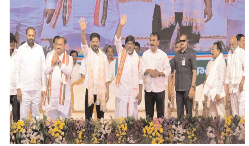
సంక్షేమ పథకాలలో విషవత్తుక మార్పులు గత ప్రభుత్వాలు చేయని పలు విషవత్తు నిర్ణయాలను తమ ప్రభుత్వం అమలు చేస్తోందని సీఎం వెల్లడించారు. మహిళల సాధికారతకు ప్రాధాన్యం ఇస్తూ, ఆర్డీసీ బస్సుల్లో ఉచిత ప్రయాణ సౌకర్యం కల్పించామని, దీనిపై ఇప్పటివరకు సుమారు 10 వేల కోట్లు వ్యయం చేశామని తెలిపారు. మహిళలను కేవలం ప్రయాణికులుగా కాకుండా బస్సుల యజమానులుగా మారుస్తున్నామని, సోలార్ విద్యుత్ ఉత్పత్తిలోనూ వారికి అవకాశాలు కల్పిస్తున్నామని చెప్పారు. మహిళా సంఘాల ఉత్పత్తుల విక్రయానికి హైదరాబాద్ హైటెక్ సిటీలో ప్రత్యేక విక్రయ కేంద్రాలు ఏర్పాటు చేసినట్లు తెలిపారు. పేదల సంక్షేమం కోసం 200 యూనిట్ల వరకు ఉచిత విద్యుత్ అందిస్తున్నామని, 22,500 కోట్ల వ్యయంతో 4.50 లక్షల ఇందిరమ్మ ఇళ్లను మంజూరు చేశామని వెల్లడించారు. ఇప్పటికే లక్షలకు పైగా భూకట్లలో 5,400 కోట్లు జమ చేసినట్లు చెప్పారు. మిగతా 2లో