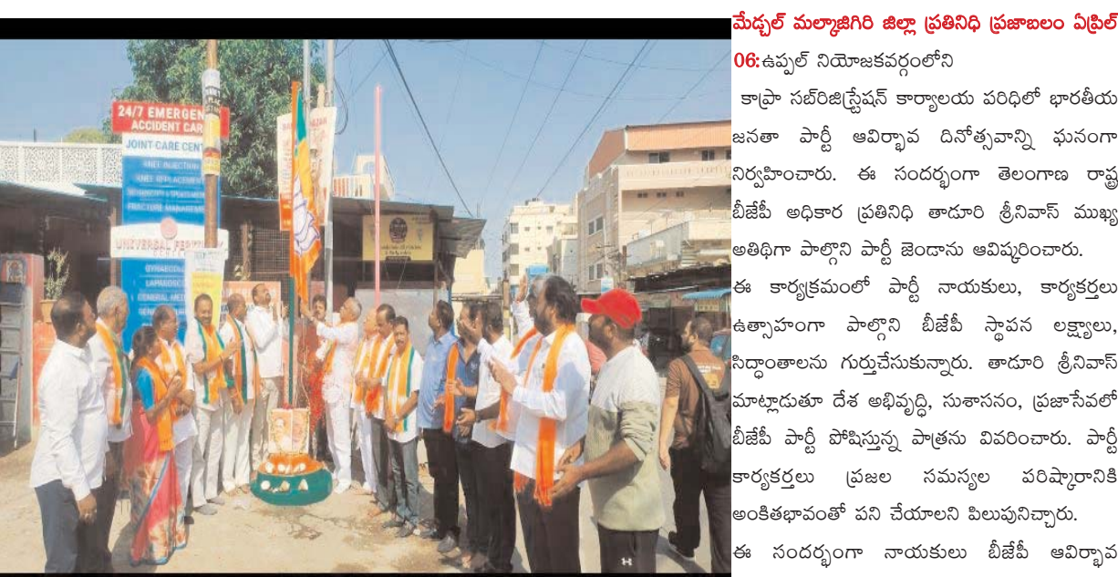
బలోపేతానికి కృషి చేయాలని సంకల్పం వ్యక్తం చేశారు. కార్యక్రమంలో స్థానిక నాయకులు, కార్యకర్తలు పెద్ద సంఖ్యలో పాల్గొన్నారు.