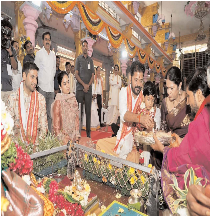
నిర్మల్ ప్రజాబలం ప్రతినid: ముఖ్యమంత్రి రేవంత్ రెడ్డి కుటుంబ సభ్యులతో బాసర శ్రీ జ్ఞాన సరస్వతి అలయంలో అమ్మవారిని దర్శించుకున్నారు. దేవస్థానం పునరుద్ధరణ కార్యక్రమాలకు శంకుస్థాపన చేయడానికి ముందు అమ్మవారికి ప్రత్యేక పూజలు నిర్వహించారు. అనంతరం ముఖ్యమంత్రి కి వేద పండితులు ఆశీర్వాదనం అందించారు. ఇదే సందర్భంగా ముఖ్యమంత్రి మనవడికి అక్షరాభ్యాసం చేయించారు.