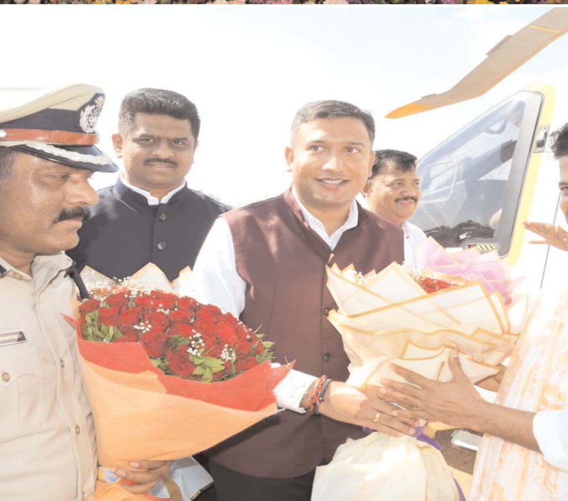
ఆదిలాబాద్ ప్రజాబలం ప్రతినid: ఏప్రిల్ 06, 2026 -- ఆదిలాబాద్ జిల్లా సమగ్ర అభివృద్ధి తమ ప్రభుత్వ లక్ష్యమని రాష్ట్ర ముఖ్యమంత్రి రేవంత్ రెడ్డి స్పష్టం చేశారు. రాజకీయాల కేవలం ఎన్నికల వరకే పరిమితం కావాలని, అభివృద్ధి విషయంలో పార్టీలకు అతీతంగా అందరినీ కలుపుకుని ముందుకు సాగుతామని తెలిపారు. బజార్ హత్వార్డ్ మండలం పిప్లి గ్రామంలో నిర్వహించిన "ప్రజా బాలన్--ప్రగతి బాట" బహిరంగ సభలో ముఖ్యమంత్రి ప్రసంగించారు. ఈ సందర్భంగా ఆదిలాబాద్ అభివృద్ధిపై తన ప్రభుత్వ ఉక్తి సంగతాన్ని చాటారు. కొమురం భీమ్ పోరాట స్ఫూర్తి ఉన్న ఈ నేలను పాలమూరు జిల్లాతో సమానంగా అభివృద్ధి చేయడమే లక్ష్యమని పేర్కొన్నారు.