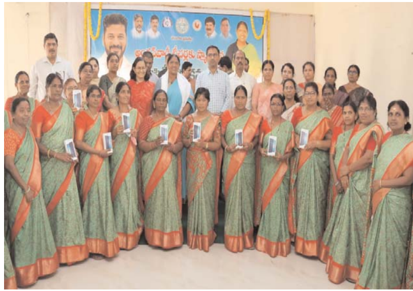
బంగారు భవిష్యత్తుకు బాటలు వేస్తుందని తెలిపారు. అంగన్వాడి కేంద్రాల పనితీరును మెరుగుపరచడానికి, డిజిటలైజేషన్ ప్రక్రియను సులభతరం చేయడానికి ప్రభుత్వం నూతన స్టార్ట్ ఫోస్లను అందిస్తుందని స్పష్టం చేశారు. నూతన స్టార్ట్ ఫోస్ ద్వారా అంగన్వాడి తీవ్రత గర్భిణీలు, బాలింతలు, 0-6 నవవర్షాల పిల్లల వివరాలను సమాధు చేసి వారి వివరాలను డిజిటల్ రికార్డులో భద్రపరచడం జరుగుతుందని, అంగన్వాడి కేంద్రానికి వచ్చే పిల్లలు మహిళలు రోజువారీ హాజరు సమాధు చేయాలని, పిల్లల ఎత్తు, బరువు, పోషక ఆహారం పంపిణీ