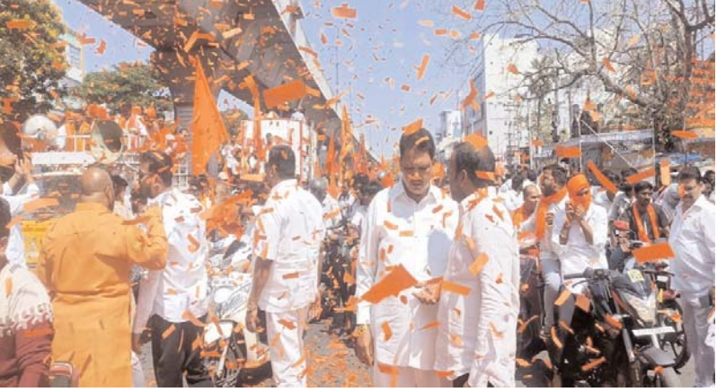
హైదరాబాద్ హనుమాన్ జన్మోత్సవం సందర్భంగా హైదరాబాద్ గౌరవనీయుల రామ్ మందిర్ నుంచి ప్రారంభమైన శోభాయాత్రలో వేలాది భక్తులు పాల్గొన్నారు. బైక్ ర్యాలీలో పెద్ద ఎత్తున పాల్గొన భక్తులు, పోలీసులు కట్టుదిట్టమైన బందోబస్త్ విర్రాటు చేశారు. యాత్ర మార్గం పొడవునా స్వాగత స్టేజీలు ఏర్పాటు చేసి, మజ్జిగ, నీరు, డిపీసీసీ, అన్నదాన కార్యక్రమాల నిర్వహించారు.