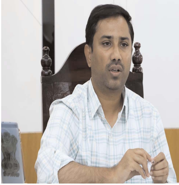
అందించేందుకు ఈ నిర్వహణ ఉపయోగపడుతుందని జిల్లా కలెక్టర్ ఆ ప్రకటన లో వెల్లడించారు.

ములుగు జిల్లా ప్రజాబలం ప్రతినిధి ఏప్రిల్ 2 ములుగు ఏప్రిల్ 3 రాత్రి 10 గంటల నుంచి ఏప్రిల్ 5 ఉదయం 8 గంటల వరకు నిర్వహణ పనులు కొనసాగనున్నట్లు తెలిపారు. సర్వర్ పనితీరు మెరుగుదల, భద్రత వ్యవస్థల సాంకేతిక సమస్యల నివారణ కోసం ఈ నిర్వహణ చేపడుతున్నట్లు పేర్కొన్నారు. ఈ సమయంలో సంబంధిత విభాగాలకు చెందిన ఆన్లైన్ సేవలు డిజిటల్ లావాదేవీలు, వెబ్ పోర్టల్ సేవలు తాత్కాలికంగా పనిచేయవని, జిల్లా ప్రజల అత్యవసర సేవలను ముందుగానే వినియోగించుకోవాలని సూచించారు. నిర్వహణ పూర్తయిన అనంతరం సేవలు సాధారణ స్థితికి చేరుకుంటాయని తెలిపారు. సాంకేతిక వ్యవస్థలను అధునీకరించడంలో భాగంగానే ఈ చర్యలు చేపడుతున్నామని, భవిష్యత్తులో వేగవంతమైన అంతరాయం లేని సేవలను