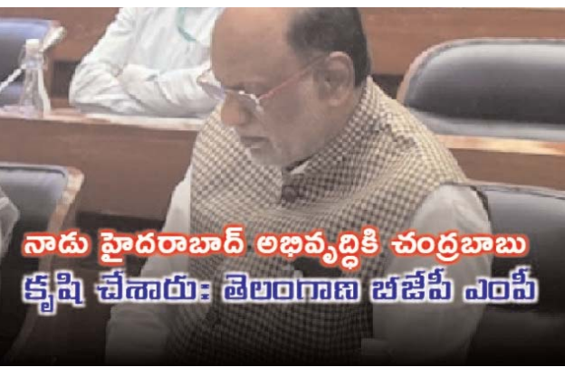
నాడు హైదరాబాద్ అభివృద్ధికి చంద్రబాబు కృషి చేశారు: తెలంగాణ భవనం

దూరదృష్టి గల నాయకుడిగా అనాడు హైదరాబాద్ అభివృద్ధికి చంద్రబాబునాయుడు కృషి చేశారని, విభజన తర్వాత ఏపీకి అమరావతి రాజధానిగా సంకల్పం తీసుకుని ముందుకు సాగుతున్నారని తెలంగాణ బీజేపీ నాయకుడు, రాజ్యసభ ఎంపీ డాక్టర్ కె. లక్ష్మణ్ అన్నారు. అమరావతికి ప్రధాని మోదీ శంకుస్థాపన చేశారని, రెండు రాష్ట్రాల అభివృద్ధికి ఎన్నో కట్టుబడి ఉందని అన్నారు. అమరావతి చట్టబద్ధత బిల్లుపై రాజ్యసభలో చర్చ సందర్భంగా ఆయన మాట్లాడారు. వికసిత ఆంధ్రప్రదేశ్ కోసం వికసిత రాజధాని అవసరమని ఆయన అన్నారు. రాజధాని అమరావతి కోసం 29 వేలమంది రైతులు 33 వేల ఎకరాలు ఇచ్చారని గుర్తు చేశారు. భవ్య రాజధాని కోసం ఏపీ ప్రజలు కలలు కన్నారని పేర్కొన్నారు. ప్రధాని మోదీ వికసిత భారత్ సంకల్పం సాకారమయ్యేందుకు వికసిత ఆంధ్ర నిర్మాణం అవశ్యమన్నారు. రాజధాని అవసరమని, కానీ జగన్ తన హయాంలో మూడు ముక్కలాడి రైతులు, మహిళలను ఇబ్బందులకు గురి చేశారని ఆరోపించారు. రాజధాని కోసం చాలాకాలంగా పోరాడిన మహిళలకు, రైతులకు ఆయన శిరస్సు వంచి సమస్యనిర్వహణ తెలిపారు. అమరావతి బిల్లు కోసం దేశం మొత్తం ఆసక్తిగా చూస్తోందని అన్నారు. తెలుగు వారికి ప్రత్యేక ఆంధ్రరాష్ట్రం కావాలని నాడు పొట్టి శ్రీరాములు 58 రోజులు నిరాహార దీక్ష చేసినా, నాటి కాంగ్రెస్ ప్రభుత్వం స్పందించలేదని మండిపడ్డారు. ఆంధ్ర రాష్ట్రం కోసం ఆయన ప్రాణాలు త్యాగం చేశారని అన్నారు. ఆయన మరణానంతరం ప్రభుత్వం స్పందించి ఆంధ్ర రాష్ట్రం ఇచ్చిందని అన్నారు.