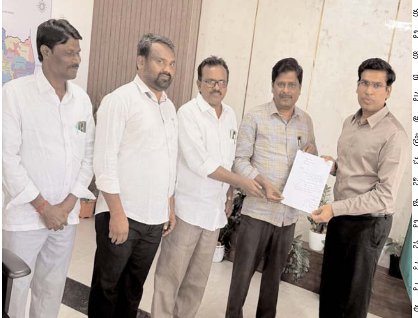
ఇబ్బంది పెడుతున్నారని... దీనికి అధికార పార్టీ నేతలు తానా తండానా అంటూ వ్యవహరించటం దారుణమని కలెక్టర్ దృష్టికి తీసుకువచ్చారు. ఇద్దరు పనిపిల్లలతో ఒంటరి మహిళా జీవన్ముక్తి సౌజన్య పట్ల అధికార పార్టీ నేతలు మూకుమ్మడి దౌర్జన్యాలకు పాల్పడడం సమంజసం కాదని, వారి దౌర్జన్యాలకు వత్తానుగా సిడిపిఓ... ఓ మహిళ అయి సహకరించటం మరింత అన్యాయమని ఆరోపించారు. సౌజన్యకు నోటీసులు ఇవ్వకుండానే ఇప్పటికే రెండు నోటీసులు ఇచ్చినట్లుగా రికార్డులు సృష్టించారని, అనవసర వివాదాలను ఆమె చుట్టూ సృష్టించడమే కాకుండా స్వయంగా ఐడిఎస్ అధికారులు ప్రాజెక్ట్ స్థాయిలో కక్ష కట్టి వ్యవహరిస్తున్నారని, వీటిపై సమగ్ర విచారణ జరిపించాలని అధికార పార్టీ నేతలకు అధికారి ఆయ్యుండి సహకరిస్తున్న సిడిపిఓపై కఠిన చర్యలు తీసుకోవాలని వినతి పత్రంలో పేర్కొన్నారు. జరిగిన ఘటనలపై సమగ్ర విచారణ జరిపిస్తామని బాధితులకు న్యాయం చేయటానికి కృషి చేస్తామని జిల్లా కలెక్టర్ హామీ ఇచ్చారు.

శ్రీకాళహస్తి సిడిపిఓపై చర్యలు తీసుకోవాలి జిల్లా కలెక్టర్ కు సీబీడీయూ నేతల విజ్ఞప్తి