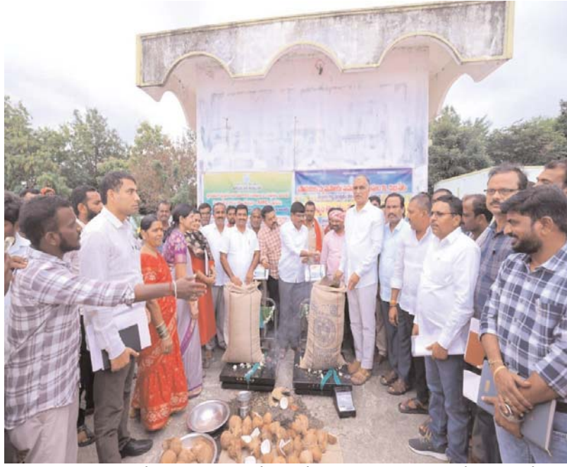
రాష్ట్ర ప్రభుత్వం ఈ రోజు మక్కల కొనుగోలు కేంద్రాలను ప్రారంభించడంలో అలసంగ్ చేయడం జరిగింది.

ఇప్పటికే సిద్దిపేట మార్కెట్ యార్డ్ లో 14 వేల క్వింటాళ్ల మక్కలు దళారుల పాలయింది. కొనుగోలు కేంద్రాలు అలసంగ్గా ప్రారంభించడం వల్ల మక్కల రైతులు మద్దతు ధర కంటే తక్కువకు 1600 రూపాయలకు దళారులకు అమ్ముకోవడం జరిగింది. ప్రతి ఎకరాకు కేవలం 18 క్వింటాళ్లు మాత్రమే కొంటామని ప్రభుత్వం కొత్త నిబంధన పెట్టడం దుర్మార్గం. రైతు 25 నుంచి 30 క్వింటాళ్ల మక్కలు వండిస్తే 18 క్వింటాలు మాత్రమే ప్రభుత్వం కొంటా అంటే మిగతాది దళారుల పాలవుతుంది. పండిన పంట అంతా కొంటాం. కొని బోనస్ ఇస్తామన్న రేవంత్ రెడ్డి ఎందుకు కోతలు పెడుతున్నారు. ప్రతి గింజకు మద్దతు ధర ఇచ్చుకుంటా అని, ప్రతి పంటకు బోనస్ పొందమన్న ప్రభుత్వం జాడ లేదు. కొనుగోలు కేంద్రాలను కూడా అడగంగా అడగంగా అరిగోసపెట్టి కొనుగోలు కేంద్రాలను ప్రారంభిస్తున్న ప్రభుత్వం మక్కలు కొనుగోలు మీద పెట్టిన నియంత్రణను ఎత్తివేయాలని, పండించిన మక్క పంటను పూర్తిగా కొనాలని ప్రభుత్వాన్ని డిమాండ్ చేస్తున్నాం. రుణమాఫీ చేస్తానని సగం చేసి సగం ఎగ్గొట్టింట్లు. రైతుబంధు ఇస్తా అని రెండు పంటలకు ఇచ్చి రెండు పంటలకు కోత పెట్టింట్లు. బోనస్ కూడా ఒక పంటకు ఇచ్చి ఒక పంటకు ఎగ్గొట్టింది కాంగ్రెస్ పార్టీ. రేవంత్ రెడ్డి పాలన అంతా సగం సగం అంతా అగం అగం.మిగిలిన రుణమాఫీని ప్రభుత్వం తక్షణమే పూర్తి చేయాలి. అన్ని పంటలకు బోనస్ ఇవ్వాలి. పండించిన ప్రతి గింజను ప్రభుత్వం కొనుగోలు చేయాలని డిమాండ్ చేస్తున్నాను.