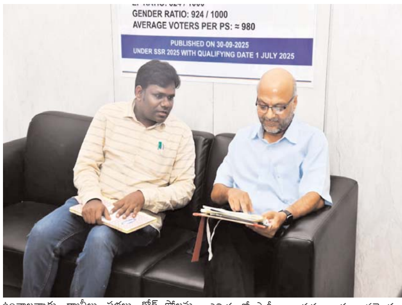
ఉంచాలన్నారు. ర్యాలీలు, సభలు, రోడ్ షోలను నిర్వహించే షెడ్యూల్, అభ్యర్థుల ఖర్చుల నమోదు, రికార్డింగ్ చేయాలన్నారు. ఖర్చుల వివరాలను మోడల్ కోడ్ ఆఫ్ కండక్ట్ అమలు తదితర ఏరోజుకారోజు రికార్డుల్లో నమోదు చేయాలని అంశాలపై చర్చించారు.