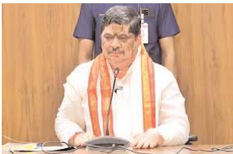
పాల్గొన్న గురుకుల సెక్రటరీ సైదులు , అడిషనల్ సెక్రటరీలు , అర్చివ్ లు , ట్రైనింగ్ లు ఇటీవల గురుకులాల్లో జరిగిన వరుస సంఘటనల పై ప్రభుత్వం సీరియస్ గా ఉంది.. ఎక్కడైనా పాఠశాల జరిగి నిర్లక్ష్యం జరిగితే కఠిన చర్యలు తప్పవు...

తప్పవు.. సీజనల్ వ్యాధులు వ్యాప్తి చెందకుండా ప్రత్యేక చర్యలు తీసుకోవాలి.. అదివారాలు ఇతర సెలవు దినాల్లో విద్యార్థులకు మరింత భద్రత రక్షణ కు తీసుకోవాల్సిన చర్యలపై సమావేశంలో చర్చ .. ట్రైనింగ్ లు స్వయంగా విధులు పర్యవేక్షించాలి ప్రాంతీయ సమన్వయ అధికారులు పాఠశాలలు ,కళాశాలలు ఆకస్మిక తనిఖీలు చేయాలి.. విద్యార్థుల క్రమశిక్షణ పై ప్రత్యేక పర్యవేక్షణ చేయాలి. నిర్దేశిత ఆహార మెనూ ను కచ్చితంగా అమలు చేయాలి.. విద్యార్థుల వాచ్ రూమ్స్ క్రమం తప్పకుండా శుభ్రపరచాలి.. ప్రజా ప్రతి నిధులు విధిగా గురుకుల హాస్టల్ లు సంరక్షించాలి.. పిల్లలను అనుమతి లేకుండా బయటకు పంపించడానికి లేదు.. నైట్ ద్యూటీ లో ఉన్న టీచర్ విధిగా అన్ని రూమ్ లు పరిశీలిస్తూ ఉండాలి.. స్టడీ హాల్స్ లో విద్యార్థులపై ప్రత్యేక దృష్టి సారించాలి.. విద్యార్థులకు శాస్త్రానింగ్ కార్యక్రమాలు విధిగా నిర్వహించాలి.. విద్యార్థులకు నాణ్యమైన సురక్షితమైన తాగునీరు అందించాలి.విద్యార్థులకు సమయానికి వేడి భోజనం అందించాలి వాచ్ రూమ్ తలుపులు ,కిక్ టి మెష్ లు సక్రమంగా ఉండేలా సంరక్షించాలి పాఠశాల ప్రాంగణం క్రమం తప్పకుండా శుభ్రపరచాలి.. ఎలుకులు, పాములు వంటి ప్రాణులు నుండి ప్రమాదం కలుగకుండా పొదలు చెత్త తొలగించాలి హెల్త్ సూపర్వైజర్లు విద్యార్థులలో దీర్ఘకాలిక వ్యాధులు గుర్తించి వెంటనే వారి తల్లిదండ్రులకు సమాచారం అందించాలి..