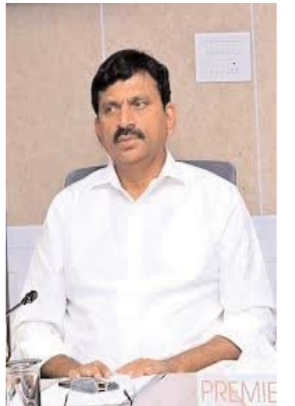
అయిన తరువాత మరో లక్ష రూపాయలను విడుదల చేస్తామన్నారు. దేశంలో ఏ రాష్ట్ర ప్రభుత్వం కూడా పేదవాళ్ల ఇందిరమ్మ ఇండ్లను కట్టలేదు. పట్టణ ప్రాంతాల్లో ఇచ్చిన హామీ మేరకు రాష్ట్రంలో అర్హులైన ప్రతి ఒక్కరికీ ఇందిరమ్మ ఇండ్లు నిర్మించి ఇవ్వడమే ఈ ప్రభుత్వ లక్ష్యమని అన్నారు. గ్రామీణ ప్రాంతాల్లో ఇందిరమ్మ ఇండ్ల నిర్మాణం ఒక ఎత్తు అయితే, పట్టణ ప్రాంతాల్లో మరో ఎత్తు అని, ఇది ప్రభుత్వానికి ఒక సవాల్ అని దీనిని దృష్టిలో ఉంచుకుని, పట్టణ ప్రాంతాల్లో ఇందిరమ్మ ఇండ్ల నిర్మాణంపై ప్రధానంగా దృష్టి సారించాలని అధికారులను ఆదేశించారు.

స్టాబుతో వకా ఇంటిని నిర్మించాలంటే తగిన స్థలం అందుబాటులో లేదు. ఈ సమస్యను అధిగమించడానికి పట్టణ ప్రాంతాల్లో జి షన్ 1 నిర్మాణాలకు అనుమతినస్తూ, ఇందిరమ్మ ఇండ్ల పథకం ద్వారా అందచేస్తున్న రూ .5 లక్షల ఆర్థిక సహాయాన్ని దశల వారీగా నిర్మాణపు పనుల స్థాయిని బట్టి లబ్ధిదారులకు అందజేస్తామన్నారు. పట్టణ ప్రాంతాల్లో ఇంటి నిర్మాణం ఎలా ఉండాలంటే... జి1 విధానంలో పట్టణ ప్రాంతాల్లోని లబ్ధిదారులు 96 చదరపు అడుగుల విస్తీర్ణంలో , 70 అడుగుల విస్తీర్ణంలో వేర్వేరుగా రెండు గదులతోపాటు, కనీసం 35.5 చదరపు అడుగుల్లో పంటగడిని నిర్మించుకోవాలి, ప్రతి ఇంటికి ప్రత్యేకంగా టాయిలెట్, బాత్ రూంలు తప్పనిసరిగా ఉండాలని, ఈ ఇంటి నిర్మాణం ఆర్ సి సి స్ట్రాట్ తో ఉండాలని, ఇందుకు సంబంధించిన స్ట్రక్చరల్ డిజైన్లకు డిజిఇ (హౌసింగ్)అనుమతి తీసుకోవాలని స్పష్టం చేశారు. నాలుగు దశల్లో రూ.5 లక్షలు చెల్లింపు... మొదటి అంతస్తు %-% రాఫ్ లెవల్ వరకు నిర్మాణం అయితే రూ. 1 లక్ష , అటు తరువాత గ్రౌండ్ ఫ్లోర్ %-% రాఫ్ వేసిన తరువాత రూ.1 లక్ష, ఆపైన ఫస్ట్ ఫ్లోర్ లో కాలమ్స్, స్టాల్, గోడల నిర్మాణాలు పూర్తి అయిన పిదప రూ.2 లక్షలను, ఇంటి నిర్మాణపు పూర్తి