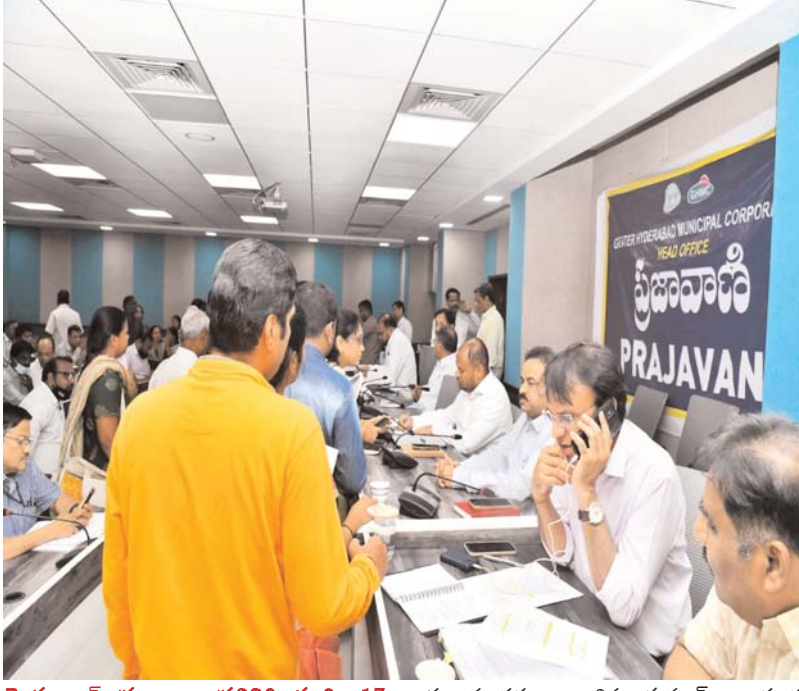
హైదరాబాద్ ప్రజాబలం ప్రతినిధి మార్చి 17:

జీహెచ్ఎంసీ వ్యాప్తంగా ప్రజావాణికి 165 ఆర్డీలు