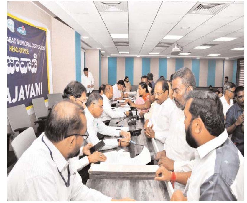
జోన్ లో 20, ఎల్పీనగర్ జోన్ లో 4, చార్మినార్ జోన్ లో 3, ఖైరతాబాద్ జోన్ లో 2 ఆర్డీలు