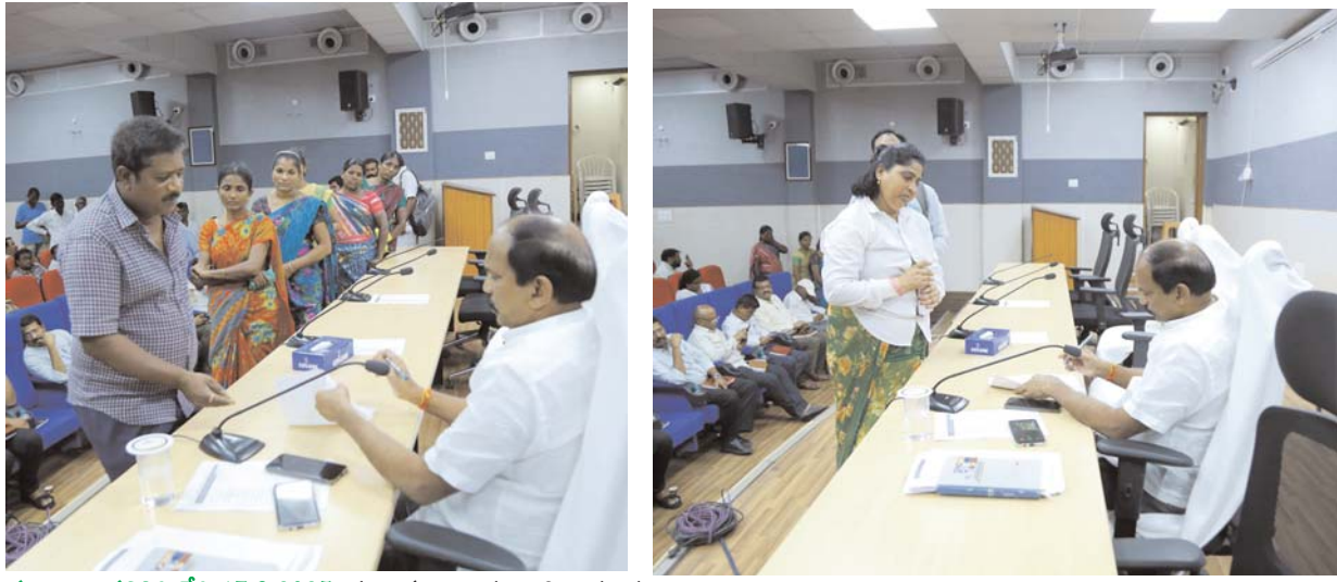
ప్రజాబలం ప్రతినిధి తేదీ. 17.3.2025. ములుగు జిల్లా ప్రజా ఫిర్యాదులను