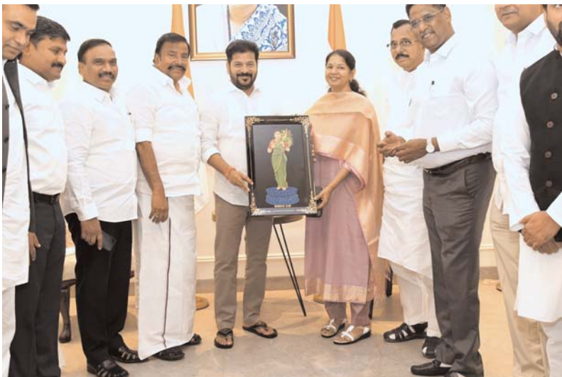
ధిల్లీ: నియోజకవర్గాల పునర్విభజనతో దక్షిణాది రాష్ట్రాలపై కేంద్ర ప్రభుత్వం చేస్తున్న కుట్రను తిప్పికొట్టే కార్యచరణ చేపడతామని గౌరవ ముఖ్యమంత్రి పి.రేవంత్ రెడ్డి స్పష్టం చేశారు. అది నియోజకవర్గాల పునర్విభజన కాదని దక్షిణాది రాష్ట్రాల ప్రాధాన్యతను కుదింపే ప్రయత్నమని (%వ్యూహం అం అశీ నవశ్రీఅవతార్అశీ... ట్ అం శ్రీఅవతార్అశీ అటోమీ ంశీవప్ర%) సీఎం అన్నారు. నియోజకవర్గాల పునర్విభజనతో దక్షిణాది రాష్ట్రాలకు కలిగే నష్టాలు.. చేపట్టాల్సిన కార్యచరణపై చర్చించేందుకు చెన్నైలో ఈ నెల 22న జరిగే సమావేశానికి హాజరుకావాలంటూ గౌరవ ముఖ్యమంత్రి పి.రేవంత్ రెడ్డిని తమిళనాడు గౌరవ ముఖ్యమంత్రి స్టాలిన్ ఆహ్వానించారు. ఈ మేరకు తమిళనాడు సీఎం రాసిన లేఖను ఆ రాష్ట్ర పురపాలక శాఖ మంత్రి కె.ఎన్.నెహ్రూ ఆధ్వర్యంలోని డీఎంకే ప్రతినిధి బృందం ఢిల్లీలో గౌరవ ముఖ్యమంత్రి రేవంత్ రెడ్డికి గురువారం అందజేసింది. 2026 తర్వాత చేపట్టే జన గణన వరకు నియోజకవర్గాల పునర్విభజన చేపట్టకూడదని నిబంధనలున్నా కేంద్ర ప్రభుత్వం మాత్రం అంతకుముందు గానే ఈ ప్రక్రియను తెరచి తెప్పించిన తమిళనాడు సీఎం స్టాలిన్ తన లేఖలో పేర్కొన్నారు. నియోజకవర్గాల పునర్విభజనపై తమ రాష్ట్రంలో ఇప్పటికే అఖిలపక్ష సమావేశం ఏర్పాటు చేశామని లేఖలో వెల్లడించారు. ఈ విషయంలో తమిళనాడు, కేరళ, ఆంధ్రప్రదేశ్, తెలంగాణ, కర్ణాటక, పశ్చిమ బెంగాల్, ఒడిశా, పంజాబ్ రాష్ట్రాలతో కూడిన బళ్ల కార్యచరణ కమిటీలో (జేపీపీ) చేరేందుకు అంగీకారం తెలపాలని స్టాలిన్ లేఖలో కోరారు. భవిష్యత్ కార్యచరణ చేపట్టేందుకు జేపీసీలో తెలంగాణ కాంగ్రెస్ పార్టీ

నియోజకవర్గాల పునర్విభజన కాదు దక్షిణాది ప్రాధాన్యతను కుదింపే ప్రయత్నం... దక్షిణాది రాష్ట్రాలపై ప్రతీకారం తీర్చుకుంటున్న బీజేపీ గౌరవ ముఖ్యమంత్రి శ్రీ.వి.రేవంత్ రెడ్డి నియోజకవర్గాల పునర్విభజనపై చర్చకు రావాలని గౌరవ ముఖ్యమంత్రికి తమిళనాడు సీఎం స్టాలిన్ ఆహ్వానం గౌరవ సీఎంను కలిసి ఆహ్వానించిన డీఎంకే ప్రతినిధి బృందం..