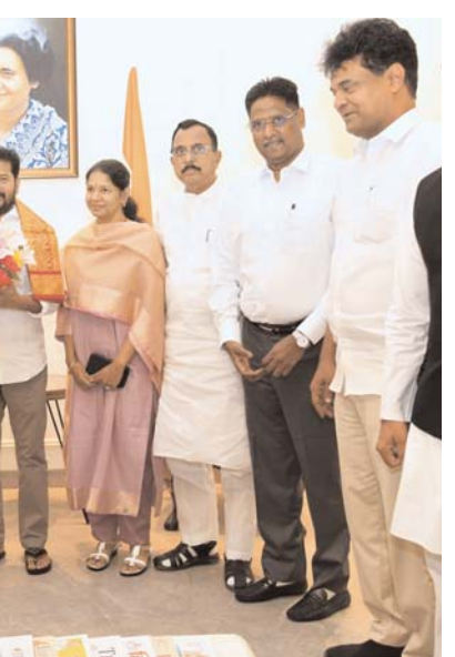
ఇళంగో, కళానిధి వీరస్వామి, అరుణ్ నెహ్రూ ఉన్నారు. డీఎంకే ప్రతినిధుల బృందం కలిసిన తర్వాత ముఖ్యమంత్రి రేవంత్ రెడ్డి విలేజరులతో మాట్లాడారు. దక్షిణాది రాష్ట్రాల ప్రాధాన్యతను నియోజకవర్గాల పునర్విభజనపై తమ రాష్ట్రంలో ఇప్పటికే అఖిలపక్ష సమావేశం ఏర్పాటు చేశామని లేఖలో వెల్లడించారు. ఈ విషయంలో తమిళనాడు, కేరళ, ఆంధ్రప్రదేశ్, తెలంగాణ, కర్ణాటక, పశ్చిమ బెంగాల్, ఒడిశా, పంజాబ్ రాష్ట్రాలతో కూడిన బళ్ల కార్యచరణ కమిటీలో (జేపీపీ) చేరేందుకు అంగీకారం తెలపాలని స్టాలిన్ లేఖలో కోరారు. భవిష్యత్ కార్యచరణ చేపట్టేందుకు జేపీసీలో తెలంగాణ కాంగ్రెస్ పార్టీ

నేతృత్వంలోని కేంద్ర ప్రభుత్వం చేస్తున్న కుట్రలను అడ్డుకుంటామని గౌరవ ముఖ్యమంత్రి రేవంత్ రెడ్డి తెలిపారు. కేంద్ర ప్రభుత్వ కుట్రలను ఎదుర్కోవాలని కాంగ్రెస్ పార్టీ సూత్రప్రాయంగా ఇప్పటికే నిర్ణయించింది సీఎం వెల్లడించారు. కాంగ్రెస్ పార్టీ అధిష్టానం అనుమతి తీసుకొని తాను చెన్నై సమావేశానికి హాజరువుతానని గౌరవ ముఖ్యమంత్రి రేవంత్ రెడ్డి తెలిపారు. నియోజకవర్గాల పునర్విభజనపై తెలంగాణ రాష్ట్రంలోనూ చర్చలు జరిపేందుకు అఖిలపక్ష సమావేశం ఏర్పాటు చేయాలని తాము నిర్ణయించుకున్నట్లు గౌరవ ముఖ్యమంత్రి రేవంత్ రెడ్డి తెలిపారు. ఈ మేరకు అన్ని పార్టీల నేతలను అఖిలపక్ష సమావేశానికి ఆహ్వానించాలని ఉప ముఖ్యమంత్రి శ్రీ మల్లు భట్టి విక్రమార్కు మాజీ మంత్రి జానా రెడ్డిలకు సూచించినట్లు సీఎం తెలిపారు. తాము నిర్వహించే సమావేశానికి బీజేపీ రాష్ట్ర అధ్యక్షునిగా ఉన్న కేంద్ర మంత్రి కిషన్ రెడ్డిని ఆహ్వానిస్తున్నామని... ఆయన సమావేశంలో పాల్గొని అక్కడ వెల్లడైన అభిప్రాయాలను కేంద్ర క్యాబినెట్ దృష్టికి తీసుకెళ్లాలని సీఎం అన్నారు. మా హక్కుల రక్షణకు తెలంగాణ నుంచి కేంద్ర మంత్రిగా ఉన్న కిషన్ రెడ్డి పాటుపడాలి ఉన్నందున ఆయనను పిలుస్తామని, ఆయన డీనికి సమాధానం చెప్పాల్సి ఉంటుందని గౌరవ ముఖ్యమంత్రి రేవంత్ రెడ్డి అన్నారు. రాజకీయ పార్టీలకు అతీతంగా దక్షిణాది రాష్ట్రాల హక్కుల పరిరక్షణకు అంతా పాటుపడాలని గౌరవ ముఖ్యమంత్రి రేవంత్ రెడ్డి