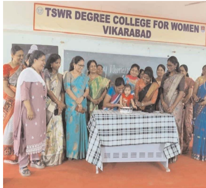
చిరునవ్వు ఉండాలని అంతర్జాతీయ మహిళా దినోత్సవం సందర్భంగా వికారాబాద్ డిగ్రీ టిఎస్ డబ్ల్యు ఆర్ కళాశాల ప్రిన్సిపాల్ శుభాకాంక్షలు తెలిపారు.

వికారాబాద్ నియోజకవర్గ ప్రతినిధి మార్చి 8 (ప్రజాబలం న్యూస్) వికారాబాద్ జిల్లా వికారాబాద్ టీఎస్ డబ్ల్యు ఆర్ డిగ్రీ కళాశాలలో ఘనంగా అంతర్జాతీయ మహిళా దినోత్సవం జరుపుకున్నామని ప్రిన్సిపాల్ తెలిపారు.పదమూడు తెలియని పెదవులకు అమృత వాక్యం అమ్మ అనే మాట తో మొదలైంది అంతర్జాతీయ మహిళా దినోత్సవం సందర్భంగా మహిళా అధికారులకు మహిళలకు మహిళలకు విద్యార్థులకు మహిళలకు హక్కుల కోసం కృషి చేస్తున్న మహిళ సోదరిమణులకు అందరికీ అంతర్జాతీయమహిళా దినోత్సవ శుభాకాంక్షలు అమ్మగా చెల్లిగా రైతుగా సైనికరాల్లిగా అధికారిగా రాణిస్తున్న ప్రతి మహిళకు శుభాకాంక్షలు ప్రతి మహిళ ఆర్థికంగా బలపడడం సమాజంలో గౌరవంగా బ్రతకడం మహిళల అందరి ముఖంలో