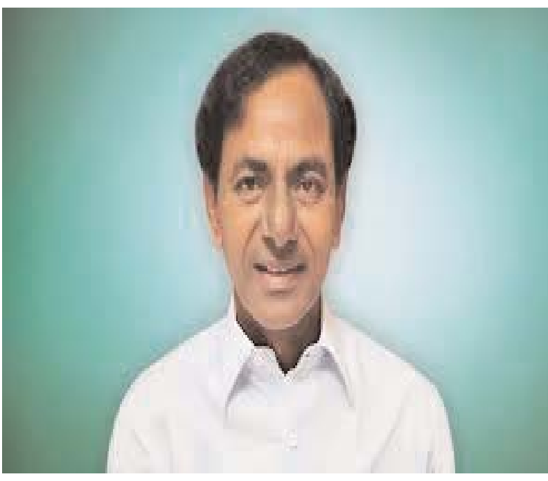
హైదరాబాద్ ప్రజాబలం ప్రతినిధి మార్చి 8, తెలంగాణ మాజీ ముఖ్యమంత్రి, బిఆర్ఎస్ అధినేత కేసీఆర్ ఏడాది గ్యాస్ తరువాత అసెంబ్లీకి వచ్చేందుకు సిద్ధమైయ్యారనే వార్త బిఆర్ ఎస్ క్యాడర్ లో మాంచి జోష్ నింపింది. అవును మీరు వింటున్నది నిజమే , ఈ నెల 12వ తేదీ నుండి జరగనున్న తెలంగాణ అసెంబ్లీ బడ్జెట్ సమావేశాలకు హాజరయ్యేందుకు కేసీఆర్ నిర్ణయించుకున్నారు. సరిగ్గా ఏడాది క్రితం బడ్జెట్ సమావేశాలకు అసెంబ్లీకి వచ్చినా , అది ఒక్కరోజే , అలా బడ్జెట్ అవ్వగానే, ఇలా మీడియా పాయింట్ లో మాట్లాడి వెళ్లిపోయారు. అది మొదలు ఆ తరువాత అసెంబ్లీ వైపే కన్నెత్తి చూడలేదు గులాబి బాన్ . కానీ సారి అలా కాదట, అది కొత్త ప్రభుత్వం కాబట్టి వదిలేశాం , ఇప్పుడు అలా కాదు.. గులాబి గట్టిదెబ్బ ఎలా ఉంటుందో చూపిస్తామంటున్నారు కేసీఆర్. తాజాగా క్యాబినెట్ నిర్ణయంతో అసెంబ్లీ సమావేశాల తేదీలు ఖరారయ్యాయి. ఈనెల 12వ తేదీ