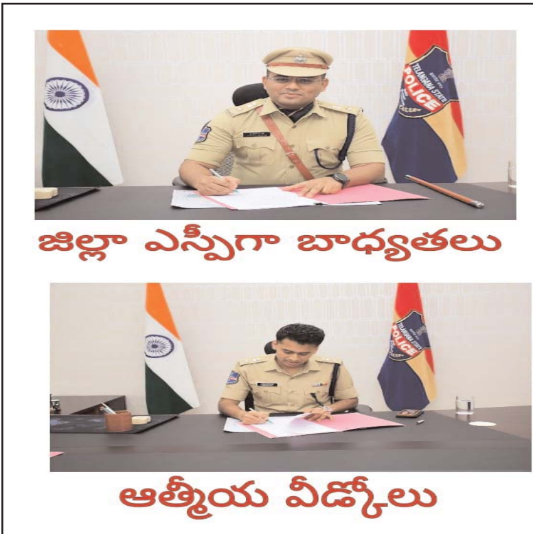
జిల్లా ఎస్పీగా బాధ్యతలు