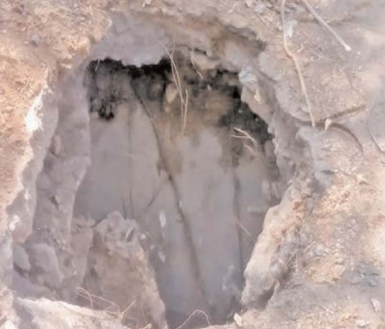
విర్బడిన గుంత వారికి కానరావడం లేదా అని ప్రజలు ప్రశ్నిస్తున్నారు, అధికారులు ఇప్పటికైనా స్పందించి ఈ రోడ్డు కల్వర్షు పై విర్బడిన గుంతను, వెంటనే పూడ్చి ఈ రోడ్డు వెంబడి వెళ్లే ప్రయాణికులకు ఎలాంటి ఇబ్బంది కలగకుండా నిర్ణయంగా ప్రయాణించేలా చూడాలని సంబంధిత అధికారులను ప్రజలు కోరుతున్నారు...

అందోల్ నియోజకవర్గం ప్రతినిధి మార్చి 6 ( ప్రజాబలం ) సంగారెడ్డి జిల్లా: అందోల్ నియోజకవర్గం లోని అల్లూరు మండల పరిధిలో గల ముప్పారం గ్రామానికి వెళ్లే చక్కని బీటీ రోడ్డుపై నిర్మించిన కల్వర్షుపై పెద్ద గుంత (5, ఫీట్ లోతు వరకు) ఏర్పడి ప్రమాదకరంగా మారిన అధికారులకు గాని, పాలకులకు గాని, పట్టించు లేకుండా పోయింది, కల్వర్షుపై ఏర్పడ్డ గోతిలో పడి వ్యక్తులు క్షతగాత్రులు అయితే కానీ అధికారులు పాలకులు అటువైపు మర మతులు చేసేలా లేదని, ప్రయాణికులు అందోల్ వ్యక్తం చేస్తున్నారు, ఈ రోడ్డు గుండా నిత్యం అనేక వాహనాలు రాకపోకలు సాగుతుంటాయి, చిన్నపాటి వ్యయంతో ఈ గుంతకు మరుమతులు చేసే అవకాశం ఉన్న ఎవరికి పట్టకపోవడం విమలని ప్రజలు నిలదీస్తున్నారు ఈ రహదారి గుండానే అధికారులు ముప్పారం వైపు వెళ్తున్న ఈ కల్వర్షు పై ప్రమాదకరంగా