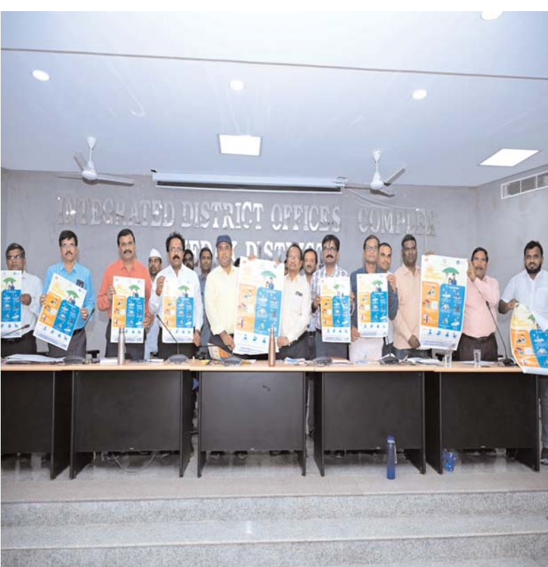
మెదక్ మార్చి-06 ప్రజాబలం ప్రతినిధి :- ఈ భగీరథ అధికారుల సమన్వయంతో తాగునీటి వేసవిలో నీటి సరఫరాలో అంతరాయం లేకుండా, సంబంధించి గ్రామస్థాయి ప్రత్యేక యాక్షన్ ప్లాన్ తయారు చేయాలని గ్రామాల్లో, మండలాల్లో తయారు చేయాలని గ్రామాల్లో, మండలాల్లో , మున్సిపాలిటీల్లో త్రాగునీటి ఎద్దడి లేకుండా అధికారులను అదేరించారు. గత గురువారం కలెక్టరేట్ సమావేశ హాలులో సమర్ యాక్షన్ ప్లాన్ పై అదనపు కలెక్టర్ నగేష్, జడ్పి సీ.ఈ.ఎల్. ఎల్లయ్య, డి.పి. యాదయ్య, జిల్లా వైద్య అధికారులను అదేరించారు. గత అనుభవాలను దృష్టిలో పెట్టుకొని ముందుకు సాగాలన్నారు . త్రాగునీటి పంపిణీలో సమస్యలు ఏర్పడితే ప్రత్యామ్నాయ చర్యలు ద్వారా నీటిని సరఫరా చేసేందుకు నిర్దిష్టమైన కార్యచరణ రూపొందించాలని అన్నారు. క్షేత్రస్థాయిలో ఇంటింటికీ తిరిగి గృహాణులను అడిగి నీటి సరఫరా గురించి అడిగి వేసవిని దృష్టిలో పెట్టుకొని పక్కా ప్రణాళికతో అధికారులతో సమీక్షించారు. ఈ సందర్భంగా కలెక్టర్ మాట్లాడుతూ గ్రామాల వారిగా ఎంపీటీసీ, పంచాయతీ సెక్రటరీ, మిషన్

పేర్కొన్నారు. ఎంపీటీసీలు, ఎంపీఓలు, పంచాయతీ సెక్రటరీలు గ్రామాల్లో ప్రతినిత్యం పర్యటించాలని, ఎక్కడా ఇబ్బందులు లేకుండా చూసుకోవాలని సూచించారు. ఎట్టి పరిస్థితుల్లో వేసవిలో నీటి సమస్యలు లేకుండా చూడాలని అన్నారు. ట్యాంకులను క్రమం తప్పకుండా శుభ్రం చేయాలని, క్లోరినేషన్ చేయాలని అన్నారు. ఇందిరమ్మ ఇండ్లు నిర్మాణం చేపట్టడంలో ప్రభుత్వ ఆదేశాల ప్రకారం ముందుకు సాగాలన్నారు ధాన్యం కొనుగోలుపై ప్రత్యేక యాక్షన్ ప్లాన్ సిద్ధం చేయాలని చెప్పారు. వాతావరణ అసమతుల్యత వల్ల పర్లాలు పడే అవకాశం ఉంటే టార్ పైన్ సీట్స్ సిద్ధం చేసుకోవాలన్నారు. వేసవి తాపాన్ని దృష్టిలో పెట్టుకుని తీసుకోవాల్సిన చర్యలపై ప్రజలకు అవగాహన కల్పించాలన్నారు. ఉపాధి హామీ పథకం పనులు చేసే కూలీలకు పనిచేసే దగ్గర త్రాగునీరు, ఓఆర్ఎస్ ప్యాకెట్లు అందుబాటులో ఉంచుకోవాలన్నారు. జిల్లా ఆస్తులలో, ప్రాథమిక ఆరోగ్య కేంద్రాల్లో అన్ని మందులు అందుబాటు ఉంచుకోవడంతోపాటు వేసవి కాలాన్ని దృష్టిలో పెట్టుకుని 50%నా ప్యాకెట్లు అందుబాటులో పెట్టుకుని సస్ స్ట్రెక్ సోకిన వారిని ప్రాథమిక చికిత్సలు ఎలా చేయాలనే దానిపై ఆశా కార్యకర్తలకు అవగాహన కల్పించాలన్నారు. క్షేత్రస్థాయిలో పనిచేస్తున్న పర్సన్ల కు వేసవి తాపాన్ని దృష్టిలో పెట్టుకొని పని వేళలో మార్పులు చేయాలన్నారు. నిరంతరాయ విద్యుత్ సరఫరాపై మున్సిపాలిటీలు, గ్రామాలలో విద్యుత్ సమస్యలు ఏమైనా ఎదుర్కొంటే విద్యుత్ విభాగం టోల్ ఫ్రీ నెంబర్ 1912 కు సంప్రదించాలన్నారు. ఈ కార్యక్రమంలో ప్రత్యేక అధికారులు, ఎంపీటీసీలు, డిప్యూటీ ఎస్, గ్రామపంచాయతీ, మిషన్ భగీరథ, అధికారులు తదితరులు పాల్గొన్నారు.