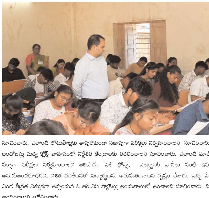
నూచించారు. ఎలాంటి లోటుపాట్లకు తావులేకుండా సజావుగా పరీక్షలు నిర్వహించాలని సూచించారు. పరీక్ష పూర్తయిన వెంటనే జవాబు పత్రాలను పోలీసు బందోబస్తు మధ్య క్లౌస్ వాహనంలో నిర్దేశిత కేంద్రాలకు తరలించాలని సూచించారు. ఎలాంటి హల్ ప్రాక్టీసుకు అవకాశం లేకుండా పూర్తి పారదర్శకంగా, పక్కాగా పరీక్షలు నిర్వహించాలని తెలిపారు. సెల్ ఫోన్స్, ఎలక్ట్రానిక్ వాచీలు వంటి ఉపకరణాలను ఎట్టి పరిస్థితుల్లోనూ పరీక్షా కేంద్రాల్లోకి అనుమతించకూడదని, సెల్ ఫోన్లతో విద్యార్థులను అనుమతించాలని స్పష్టం చేశారు. వైద్య సేవల కేంద్రాన్ని పరీక్షించిన మండలను పరీక్షించారు. ఎంద తీవ్రత ఎక్కువగా ఉన్నందున ఓ.ఆర్.ఎస్ ప్యాకెట్లు అందుబాటులో ఉంచాలని సూచించారు. విద్యార్థులు ఏదేని అస్వస్థతకు గురైతే తక్షణ వైద్య సేవలు అందించాలని ఆదేశించారు.