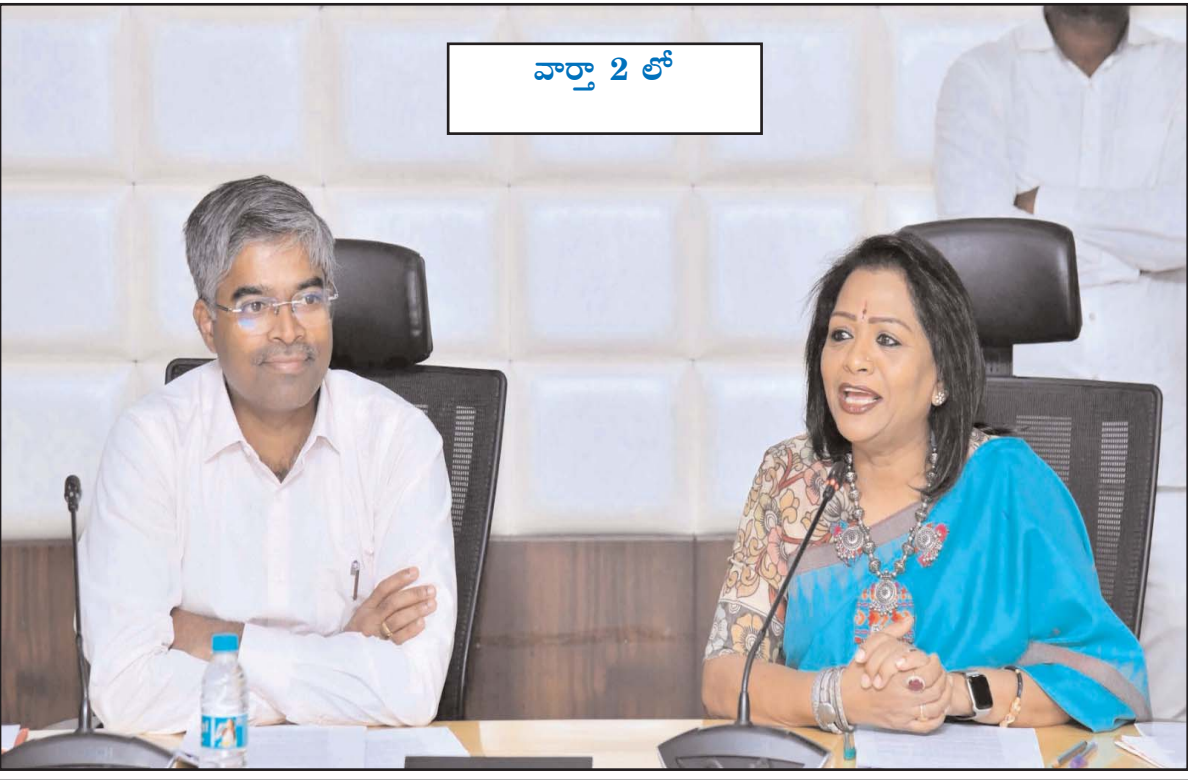
వార్తా 2 లో

15 అంశాలకు 6 టేబుల్ ఐటమ్ లకు కమిటీ ఆమోదం ప్రభుత్వం జీహెచ్ఎంసీకి 700 కోట్లు విడుదల చేయడంపై కృత్జతలు తెలిపిన కమిటీ సభ్యులు