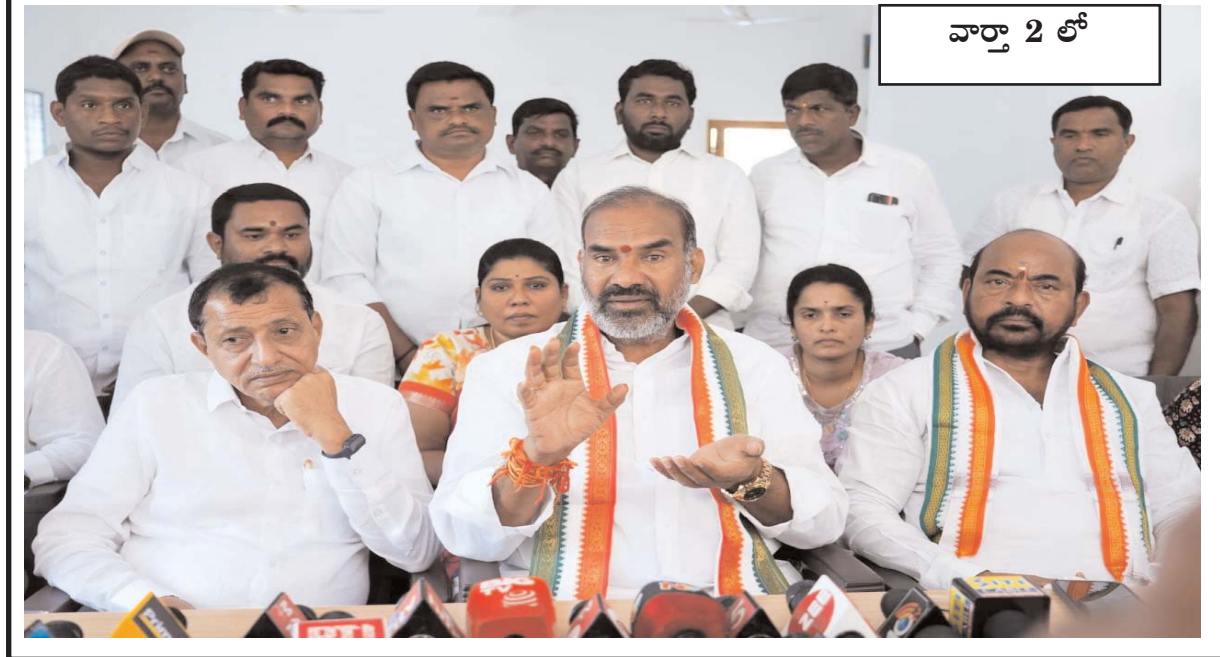
వార్తా 2 లో