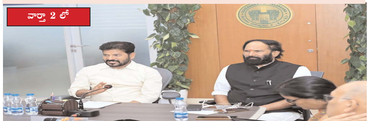
వార్తా 2 లో