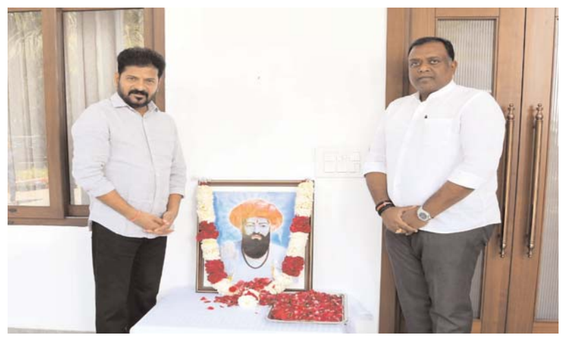
ప్రజాబలం ప్రతినిధి: హైదరాబాద్ బంజారా జాతికి ఆధ్యాత్మిక మార్గదర్శిగా సంత సేవాలాల్ మహారాజ్ నిలిచారని ముఖ్యమంత్రి రేవంత్ రెడ్డి కొనియాడారు. సంత సేవాలాల్ మహారాజ్ జయంతిని పురస్కరించుకుని ఆయన చిత్రపటానికి ముఖ్యమంత్రి రేవంత్ రెడ్డి శనివారం పూలమాల వేసి నివాళు లర్పించారు.