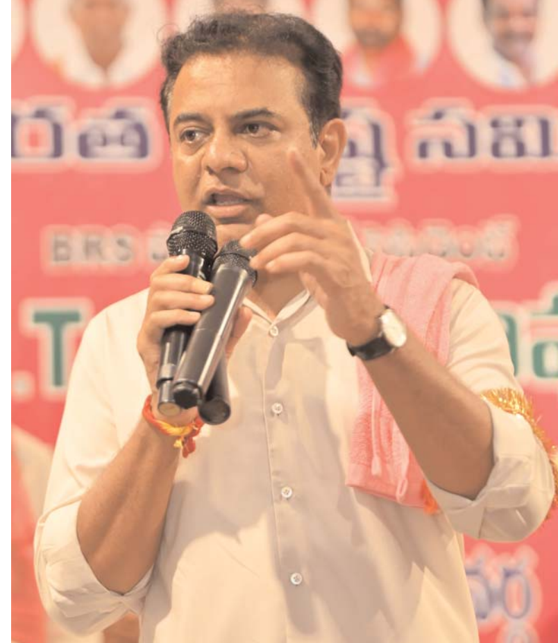
అరచేతిలో స్వర్ణం చూపించి అధికారంలోకి వచ్చిన కాంగ్రెస్ నాయకుల గల్లలు పట్టుకుని ప్రజలు కాట్టే రోజులు దగ్గర్లోనే ఉన్నాయన్నారు

తెలంగాణ ప్రజలు ఉన్నారన్నారు. ఇవాళ హైదరాబాద్ లోని మాజీ మంత్రి పువ్వాడ అజయ్ ఇంట్లో ఖమ్మం జిల్లా నాయకులు, కార్యకర్తల ఆత్మీయ సమావేశానికి కేటీఆర్ హాజరయ్యారు. మొన్నటి ఖమ్మం వరదల సమయంలో అక్కడి ప్రజలకు మాజీ మంత్రి పువ్వాడ అజయ్ గుర్తుకొచ్చారని చెప్పారు. బిల్డే ఫంక్షన్ లకు పోవడానికి హెలికాప్టర్ లను ఉపయోగిస్తున్న మంత్రులు, ఖమ్మం వరదలప్పుడు మాత్రం హెలికాప్టర్ లు పంపలేదని విమర్శించారు. కాంగ్రెస్ ప్రభుత్వ నిర్లక్ష్యం, చేతకానినానికి ఓ కుటుంబం వరదల్లో కొట్టుకుపోయిందని కేటీఆర్ ఆరోపించారు. ప్రజలు తిరుతున్న తిట్లను వింటే పొరుషమున్ను ఎవడైనా బకెట్ నీళ్లలో దూకి చచ్చేవాడు. కానీ కానీ రేవంత్ రెడ్డికి రేకం లేదు కాబట్టి అన్ని దులుపుకొని తిరుగుతున్నారు. మా స్కూటీ ఏమైందని కాలేజీ పిల్లలు కూడా పోస్ట్ కార్డు ఉద్యమం మొదలుపెట్టారు. కాంగ్రెస్ ప్రభుత్వం చేతిలో మోసపోయామని అనుకోని వర్షం ఏది ఈ రాష్ట్రంలో లేదు. కెసిఆర్ ముఖ్యమంత్రిగా లేకపోయేసరికి ఎంతో నష్టపోయామన్న భావనలో తెలంగాణలోని ప్రతి ఒక్కరూ ఉన్నారు. ముఖ్యమంత్రి నియోజకవర్గం లోని పనులతో పాటు తెలంగాణలోని ప్రతి పని కాంట్రాక్టు కూడా ఇన్వెస్ట్ ఖమ్మం జిల్లాకు చెందిన మంత్రికే దక్కుతుంది. కాంట్రాక్టు మంత్రి, ఆయన కమిషన్ కోసమే ముఖ్యమంత్రి పని చేస్తున్నారని నిన్ను కొడంగల్ లో చెప్పా . డిప్యూటీ సీఎం 30% కమిషన్ తీసుకొని పనులు చేస్తున్నారని సొంత పార్టీ ఎమ్మెల్యేనే చెప్పన్నారు.