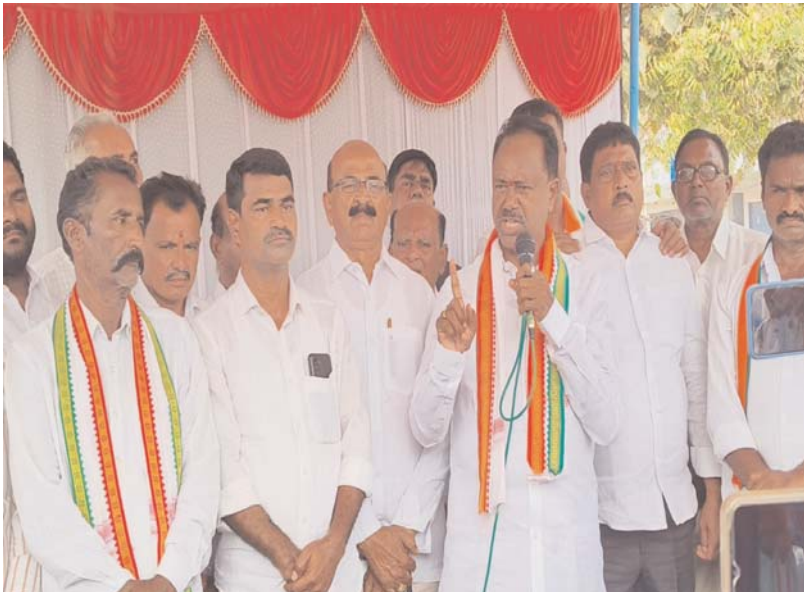
సాధ్యమైనంత మేరకు ఎక్కువ స్థానాలు ఏకగ్రీవం అయ్యేలా కృషి చేయాలని నేతలకు ఎమ్మెల్యే పిలుపునిచ్చారు. పార్టీ శ్రేణులు గ్రామాలలో కలిసికట్టుగా పనిచేయాలని, వర్గాలు విడిపోయి గ్రామాలలో ఇబ్బందికర పరిస్థితులను సృష్టించే ఊరుకునేది లేదని ఎమ్మెల్యే అన్నారు.

హైదరాబాద్ ప్రజాబలం ప్రతినిధి: తెలంగాణ రాజకీయం ఆసక్తి కరంగా మారతోంది సీఎం రేవంత్ స్థానిక సంస్థల ఎన్నికల నిర్వహణ పైన ఫోకస్ చేశారు. అటు ఎన్నికల సంఘం ఈ ఎన్నికల పై కనరత్తు చేస్తోంది. ఇటు ఇదే సమయంలో కేసీఆర్ అలర్ట్ అయ్యారు. రాజకీయంగా తిరిగి యాక్టివ్ కావాలని నిర్ణయం తీసుకున్నారు. భారీ బహిరంగ సభల ద్వారా తిరిగి ప్రజా క్షేత్రంలోకి వచ్చేలా కార్యాచరణ సిద్ధం చేస్తున్నారు. అందులో భాగంగా రెండు సభలకు నిర్ణయించారు. రేవంత్ ప్రభుత్వం లక్ష్యాలు కేసీఆర్ సమరానికి సిద్ధం అవుతున్నారు. తెలంగాణ రాజకీయాల్లో కీలక పరిణామాలు చోటు చేసుకుంటున్నాయి. అసెంబ్లీ ఎన్నికల్లో ఓటమి తరువాత కేసీఆర్ కేవలం పార్లమెంట్ ఎన్నికల సమయంలో మాత్రమే ప్రజల్లోకి వచ్చారు. విపక్ష నేత అసెంబ్లీ సమావేశానికి ఒక్క సారి మాత్రమే హాజరయ్యారు. పార్టీ నేతలతో అప్పుడప్పుడూ భేటీ అవుతున్నారు. కేసీఆర్ ఫ్రాంట్ లోనే పరిమితం కావటం పైన సీఎం రేవంత్ మంత్రులు పలు సందర్భాల్లో విమర్శలు చేశారు. ఆ సెంటిమెంట్ వచ్చి ప్రభుత్వానికి నూచనలు చేయాలని సూచించారు. ఇక, ఇప్పుడు స్థానిక సంస్థల ఎన్నికల దిశగా చర్చ సాగుతోంది. కాంగ్రెస్ ప్రభుత్వం ఏర్పడి 14 నెలలు పూర్తయింది. ఈ సమయంలో కేసీఆర్ కీలక నిర్ణయం తీసుకున్నారు. బీసీ రైతాంగం అంశాలపై:తాను మోసంగా