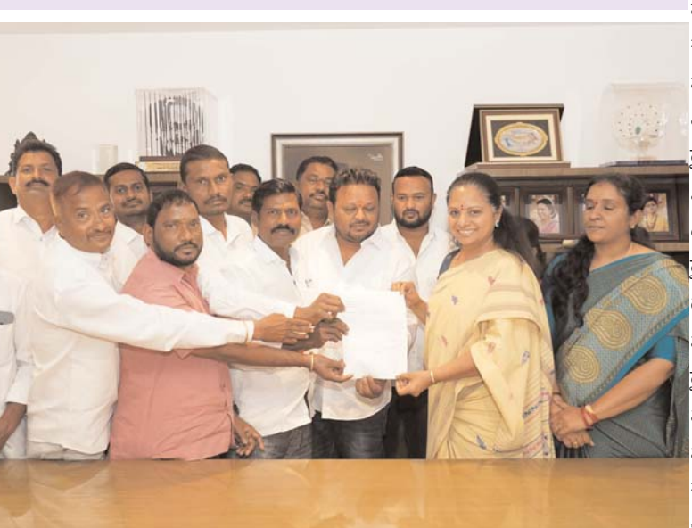
విడుదల చేయకపోవడం ఏంటని ప్రశ్నించారు. ఇది రైతులకు ప్రోహం చేయడమేనని స్పష్టం చేశారు. రైతులను మోసం చేయాలని ప్రయత్నం చేస్తే తాము రాష్ట్ర వ్యాప్తంగా పెద్ద ఎత్తున ఉద్యమిస్తామని హెచ్చరించారు. ఇక సర్పంచులకు పెండింగ్ బిల్లులపై స్పందిస్తూ.. సర్పంచుల పదవీకాలం పూర్తయి ఏడాది అయినా ఇంకా నిధులు విడుదల చేయకపోవడం కాంగ్రెస్ ప్రభుత్వ అసమర్థతను తెలియజేస్తున్నదని మండిపడ్డారు. ప్రజలకు సేవ చేసిన గ్రామస్థాయి ప్రజా ప్రతినిధులు అత్యుచిత్ర చేసుకునే పరిస్థితి ఏర్పడిందని ఆవేదన వ్యక్తం చేశారు. ప్రభుత్వం తక్షణమే సర్పంచులకు పెండింగ్ బిల్లులను విడుదల చేయాలని డిమాండ్ చేశారు.

సర్పంచులకు పెండింగ్ బిల్లులు తక్షణమే విడుదల చేయాలి లేదంటే రాష్ట్రవ్యాప్తంగా పెద్ద ఎత్తున ఉద్యమిస్తాం బీఆర్ఎస్ ఎమ్మెల్యే కల్వకుంట్ల కవిత