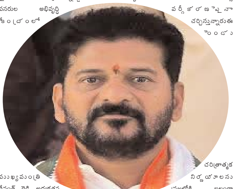
చరిత్రాత్మక నిర్ణయాలను ప్రజల్లోకి బలంగా తీసుకెళ్లాలని రేవంత్ రెడ్డి ఎమ్మెల్యేలకు దిశానిర్దేశం చేస్తున్నారు. బడ్జెట్ ప్రాధాన్యాలను, పార్టీ సంస్థాగత నిర్మాణం తదితర అంశాలపైనా కూడా చర్చ జరగనుంది. ఎన్నో వర్గీకరణ అమలు, స్థానిక సంస్థల్లో 42 శాతం సీట్లు ఇస్తామనే హామీపై ఎలా ముందుకెళ్లాలనే అంశంపై సీఎం

ధర్మిక వెళ్లను సీఎం సీఎల్పీ మిటింగ్ తర్వాత సాయంత్రం సీఎం రేవంత్ రెడ్డి, డిప్యూటీ సీఎం భద్రీ విక్రమార్క ధర్మిక వెళ్లారు. వీరితో పాటు పీసీసీ చీఫ్ మహేష్ కుమార్ గౌడ్ వెళ్లారు. ధర్మిలో ఏబీసీ అందరినీ వికలాధిపైకి తెచ్చేందుకు ఎమ్మెల్యేలు, ఎమ్మెల్యేలతో సీఎం రేవంత్ రెడ్డి తాజాగా సమావేశం అయ్యారనే వార్తలు కూడా వినిపిస్తున్నాయి. జిల్లాల వారీగా ఎమ్మెల్యేలు, ఇన్ ఛార్జ్ మంత్రులతో మాట్లాడి సమన్వయం పెరిగేలా సీఎం దిశానిర్దేశం చేస్తున్నారని పార్టీ వర్గాలు తెలిపాయి. పార్టీ ఫిరాయించిన పది మంది ఎమ్మెల్యేలు సైతం తాజా సీఎల్పీ సమావేశానికి హాజరు కావాలని అధికారులు ఆహ్వానం పంపారు. అయినప్పటికీ వారు చివరి నిమిషంలోనూ భేటీకి హాజరు కాలేదు. పార్టీ