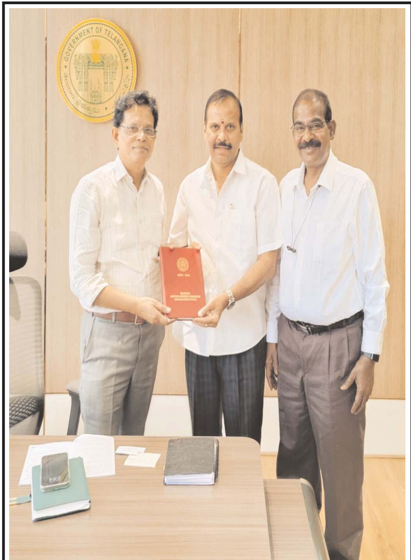
ఛార్మీనార్ ప్రజాబలం ప్రతినిధి: హైదరాబాద్ జిల్లా టీజీవో డైరీ 2025 నీ ఆకునూరు మురళి విద్యా కమిషన్ చైర్మన్ గారికి బహుకరించడం జరిగింది.