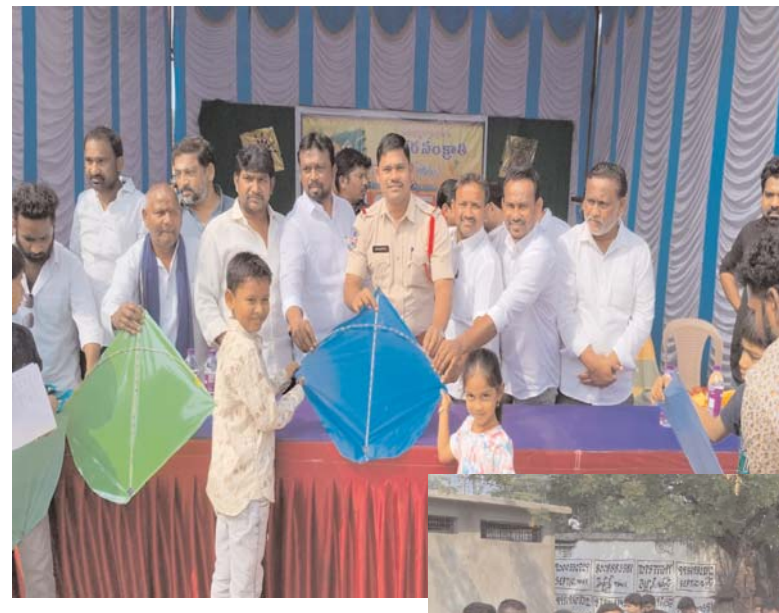
ప్రజాబలం చెన్నూరు నియోజకవర్గ రిపోర్టర్ జనవరి