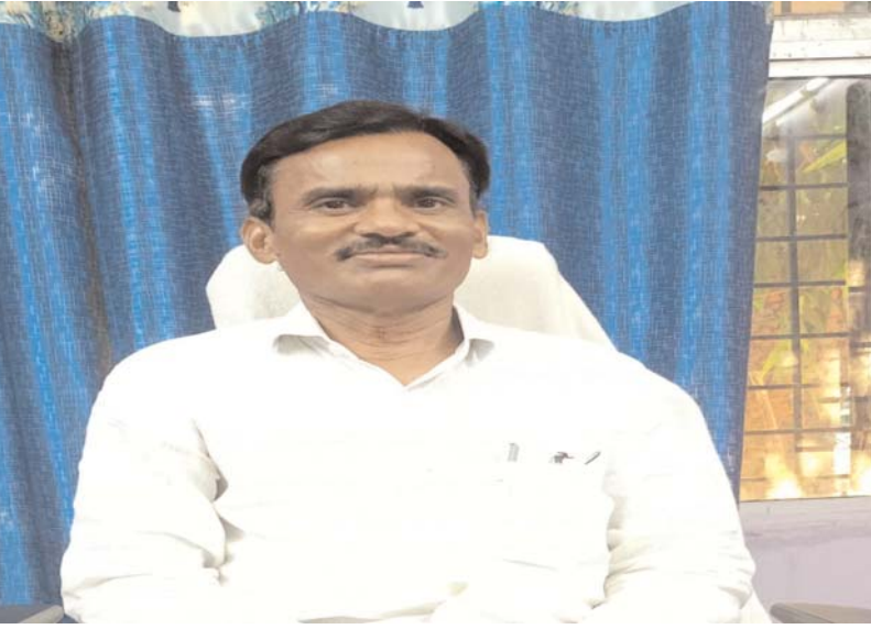
ప్రజాబలం చెన్నూరు నియోజకవర్గ రిపోర్టర్ జనవరి