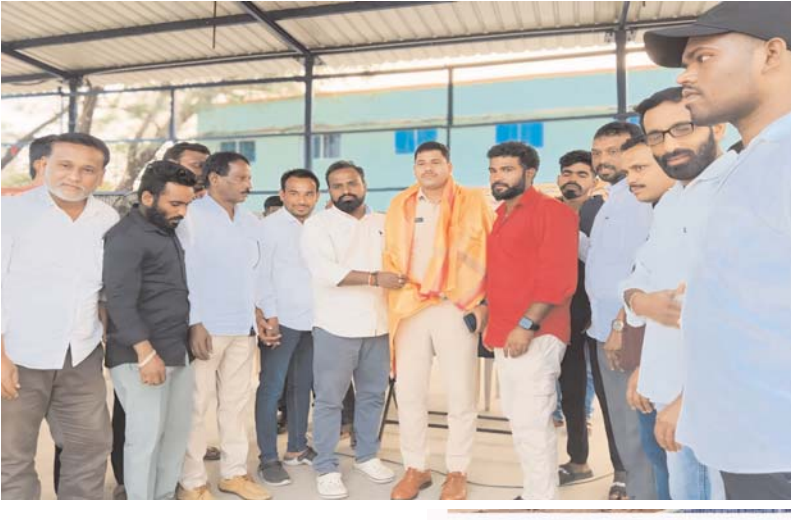
ప్రజాబలం చెన్నూరు నియోజకవర్గ రిపోర్టర్ జనవరి