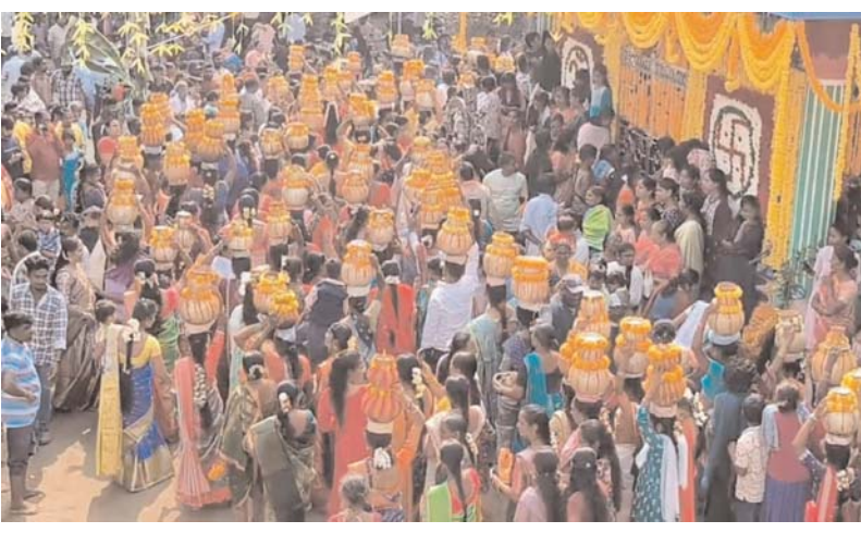
ముంధని మున్సిపల్ పరిధిలోని ఆరవ వార్డు బోయిన్

పేట మునిసిపల్ సంఘం ఆధ్వర్యంలో లక్ష్మీదేవి బోనాల జాతర మునిసిపల్ సంఘం ఆధ్వర్యంలో అంగరంగ వైభవంగా నిర్వహించారు. స్వతాగగా బంతిపూలతో దేవాలయం చుట్టూ సువర్ణ సుందరంగా అలయాన్ని తీర్చిదిద్దారు. సంక్రాంతి పండుగ పురస్కరించుకొని లక్ష్మీదేవికి మహిళలు భారీ సంఖ్యలో పాల్గొని అమ్మవారికి బోసం ఎత్తుకొని అమ్మవారికి మొక్కులు చెల్లించారు. లక్ష్మీ దేవర పట్టణం వేసి అమ్మవారి బండారినీ తీసుకొని ముడుపులు చెల్లించారు. ప్రతి సంవత్సరం సంక్రాంతి రోజున నిర్వహించే ఈ లక్ష్మీ దేవర బోనాల జాతరకు