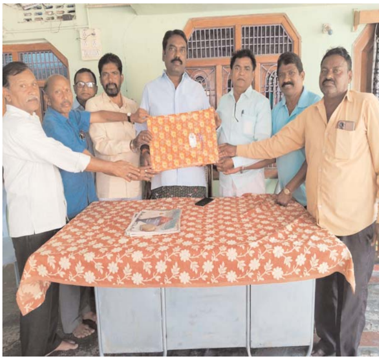
ప్రజాబలం చెన్నూరు నియోజకవర్గ రిపోర్టర్ జనవరి