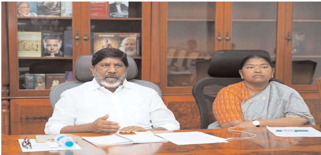
హైదరాబాద్ ప్రజాబలం ప్రతినిధి

అందుబాటులో ఉన్న భూమిని గుర్తించండి, అందుబాటులో ఉన్న ప్రభుత్వ భూమిని గుర్తించాలని కలెక్టర్లను ఆదేశించారు. మహిళా సంఘాలు ఫ్లాట్ల ఏర్పాట్లలో ఆర్థిక సహాయం కోసం బ్యాంకు అధికారులతో నమస్వయం చేయాలని సూచించారు. మహిళా సంఘాల