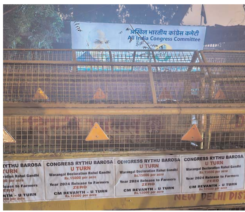
న్యూఢిల్లీ రాహుల్ గాంధీ తెలంగాణకు వచ్చి పరంగల్ డిక్లరేషన్ పేరుమీద తెలంగాణ రైతులకు ఎకరానికి 15000 రూపాయలు చొప్పున ఇస్తామని ప్రకటించి, కాంగ్రెస్ అధికారంలో వచ్చిన తర్వాత 2024 సంవత్సరంలో రైతులకు ఒక్క రూపాయి కూడా విడుదల చేయకపోవడం, ఇటీవల సిఎం రేవంత్ యూటర్న్ తీసుకుంటూ ఎకరాకు 15000 ఇవ్వమని ప్రకటించడంపై ఏకంగా ఏఐసీసీ కాంగ్రెస్ కార్యాలయం వద్ద "కాంగ్రెస్ రైతు భరోసా యూటర్న్" పేరుతో పోస్టర్లు వెలిసాయి.