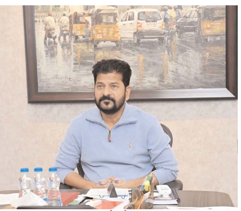
హైదరాబాద్ ప్రజాబలం ప్రతినిధి: పువ్వచర్ల సీటీ, శామీర్ పేట్, మేడ్చల్ మెట్రో మార్గాలకు హైదరాబాద్ నగరంలో మెట్రో విస్తరణ, రేడియల్ రోడ్ల నిర్మాణాలు, ఎలివేటెడ్ కారిడార్ల (డివీజన్లు) మార్బల్ నెలాఖరు నాటికి పూర్తి నిర్మాణాలపై ముఖ్యమంత్రి గారు ఉన్నతస్థాయి చేయాలని ముఖ్యమంత్రి రేవంత్ రెడ్డి సమావేశంలో సమీక్షించారు. అధికారులను ఆదేశించారు. మూడు మెట్రోల డివీజన్లకు కేంద్ర ప్రభుత్వం నుంచి ఆమోదం పొంది ఏప్రిల్ నెలాఖరుకు టెండర్లు పిలవాలని