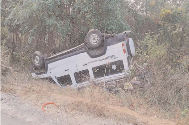
పరంగల్ ఖానాపూరు మండలం చిలకమ్మ నగర్ సమీపంలోని కొత్తగూడ సరిహద్దు ప్రాంతంలో గాడే వాగు మూలములు వద్ద అదుపు తప్పిన తుఫాన్ వాహనం బోల్తా వడింది. ఘటన సమయంలో వాహనం తక్కువ వేగంతో వుండడంతో పెను ప్రమాదం తప్పింది. ఘటనలో ఇద్దరికి తీవ్ర గాయాలు అయ్యాయి. ప్రమాద సమయంలో వాహనంలో 25 మంది ప్రయాణికులు వున్నారు. వీరంతా మద్దతుపడే సుండి ఖమ్మం జిల్లా జులూరుపాడులో మిర్చి ఏరేందుకు వలస వస్తున్న కూలీలు..