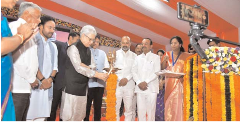
ప్రజాబలం ప్రతినిధి మేధుల్ మల్లాజిగిరి జిల్లా జాతికి అంకితం చేసారు. ఈ సందర్భంగా ప్రధాని జనవరి 6: మేధుల్ మల్లాజిగిరి జిల్లాలో 413 మాట్లాడుతూ వికసిత భారత్ లో భాగంగా కోట్లతో నిర్మించిన చర్లపల్లి టెలిఫోన్ ను భారత ఓడిస్సా, జమ్మూ, తెలంగాణ రాష్ట్రాలలో టెలిఫోన్ ప్రధాని సరేంద్ర మోడీ వర్చువల్ గా ప్రారంభించి ను ప్రారంభించడం ఎంతో హర్షనీయమన్నారు.

తెలంగాణలోని హైదరాబాద్ లో సికింద్రాబాదు, నాంపల్లి, కాచిగూడా లో ఉండే రద్దీ చర్లపల్లి టెలిఫోన్ ఏర్పాటు ద్వారా తగ్గుతుందని, అంతేకాకుండా వస్తురవాణా, వాణిజ్య వ్యాపారానికి ఎంతగానో ఉపయోగపడడమే కాకుండా ఎంతో మందికి జీవనోపాధి, ఉద్యోగ వనతుల కల్పన కలుగుతుందన్నారు. రానున్నరోజుల్లో ఈ టెలిఫోన్ కీలక పాత్ర పోషిస్తుందన్నారు.