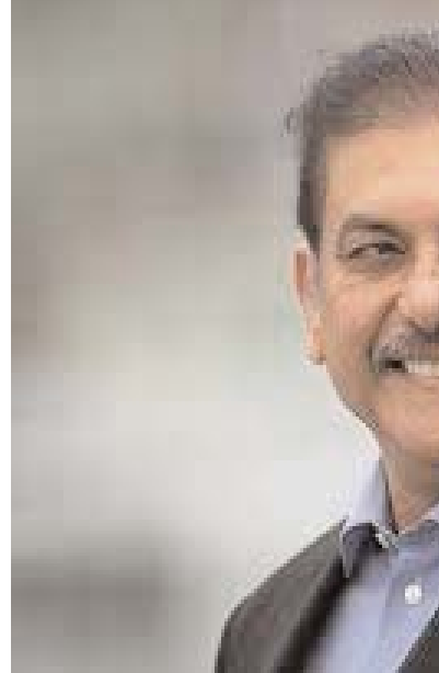
గారి సోబర్ తర్వాత ఇతను రెండో వారు మాత్రమే. టెన్స్ క్రికెట్ ఇతను 11 సెంచరీలు సాధించారు. రవిశాస్త్రి క్రికెట్ కు వీడ్వాలి పలికిన తర్వాత క్రికెట్ కామెంటరీ గా మారిపోయాడు. ఎన్నో మ్యాచ్ లకు తన స్టైల్ క్రికెట్ కామెంట్రీ ఇచ్చి ప్రేక్షకులను అలరించారు రవి శాస్త్రి. కొన్ని రోజుల పాటు డిమిడియా కోర్స్ గా కొనసాగి డిమిడియా విజయాలను ముందుండి నడిపారు.

రవి శాస్త్రి ఆరు సిక్యుల రికార్డ్ కు 40 ఏళ్ళు నిండాయి. 18 సంవత్సరాల వయసులోనే అంతర్జాతీయ క్రికెట్లోకి అడుగుపెట్టిన రవిశాస్త్రి.. కుడి చేతితో బ్యాటింగ్ ఎడమచేతితో స్పిన్ బౌలింగ్ చేయగలడు. 1985 సంవత్సరంలో జనవరి 3వ తేదీన ఆరు బాల్లతో ఆరు ఆరు సిక్కుర్లు కొట్టిన మొట్టమొదటి భారతీయుడిగా రికార్డు సాధించారు రవి శాస్త్రి. ప్రపంచంలో ఈ ఘనత సాధించిన రెండో ఆటగాడిగా రవిశాస్త్రి రికార్డు సృష్టించారు. 1985లో ఆస్ట్రేలియాలో జరిగిన ప్రపంచ ఛాంపియన్ క్రికెట్లో తన క్రీడా జీవితంలోనే అత్యంత ప్రతిభను కనబర్చి ఛాంపియన్ ఆఫ్ ఛాంపియన్స్ గా ఎన్నికైనారు. అదే సీజన్లో ఒక ఓవర్లో వరుసగా 6 సిక్కుర్లు కొట్టి ఈ ఘనతను సాధించిన తొలి భారతీయుడిగా రికార్డు సృష్టించారు. ఫస్ట్ క్లాస్ క్రికెట్లో ప్రపంచంలోనే ఈ ఘనతను సాధించిన వారిలో వెస్ట్ ఇండీస్ కు చెందిన వారు.