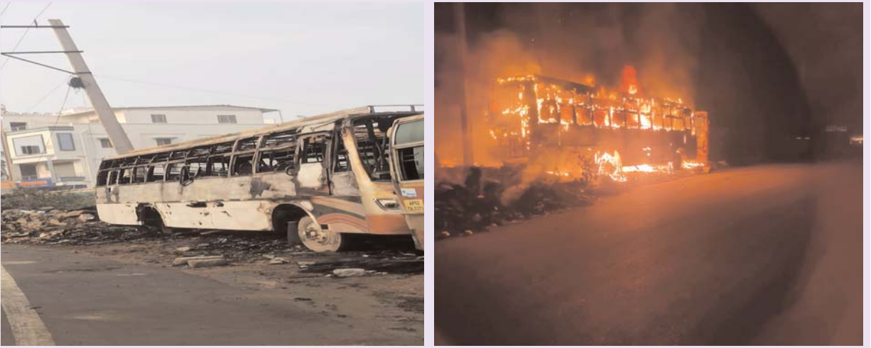
అనంతపురం నగరంలో దివాకర్ బస్సుల ట్రాన్స్పోర్ట్ ఆఫీస్ వద్ద 11 కేబీ విద్యుత్ తీగలు ప్రమాదవశాత్తూ తెగిపోయి బస్సు మీద పడడంతో బస్సు పూర్తిగా కాలిపోయింది. దీంతో పెద్ద ఎత్తున మంటలు వ్యాపించడంతో చుట్టూపక్కల భయభ్రాంతులకు గురయ్యారు. సంఘటన స్థలానికి అగ్నిమాపక సిబ్బంది చేరుకొని మంటలను అదుపులోకి తీసుకున్నారు. గురువారం తెల్లవారజామున ఈ ఘటన చోటు చేసుకోవడంతో నగరంలోని పలు ప్రాంతాలకు విద్యుత్ అంతరాయం ఏర్పడింది.