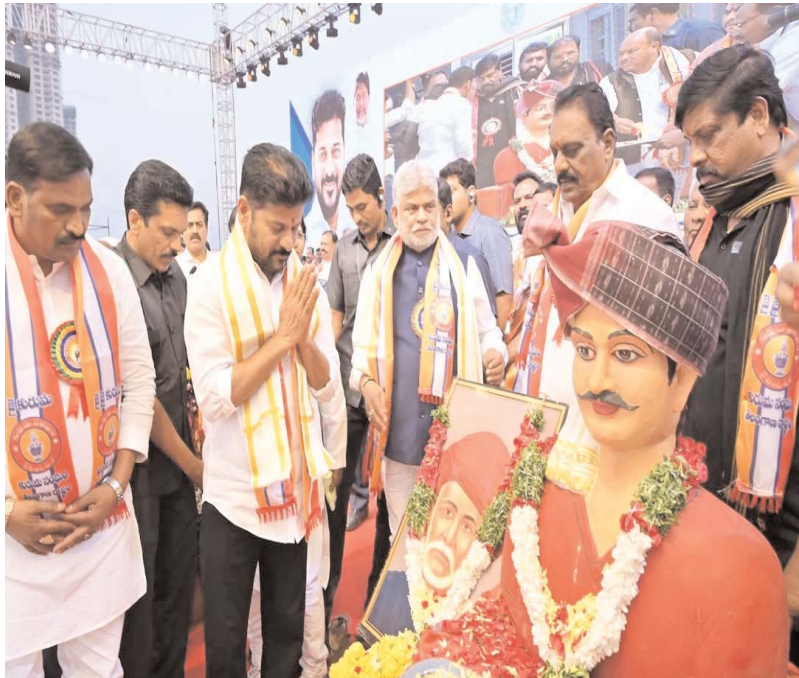
రంగారెడ్డి ప్రజాబలం ప్రతినిధి:జనాభా ప్రాతిపదికన ఫలాలు అందాలన్న సంకల్పంతో తెలంగాణ ప్రభుత్వం చేపట్టిన కులగణన 98 శాతం మేరకు పూర్తయిందని ముఖ్యమంత్రి ఎ.రేవంత్ రెడ్డి చెప్పారు. మిగిలిన రెండు శాతం పూర్తయితే దేశానికే ఆదర్శంగా నిలిచే ఈ కులగణన తెలంగాణ ప్రజల మెప్పుకొందని తెలిపారు.