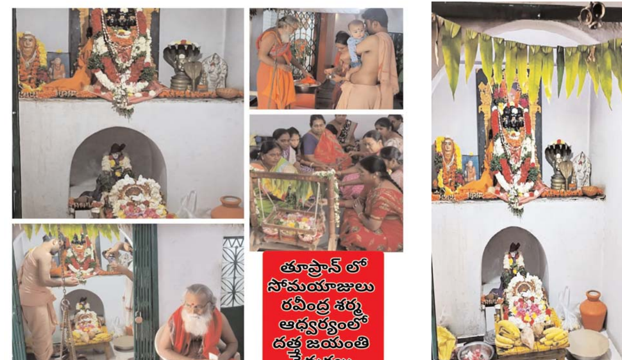
తూ.ప్రా.లో సోమయాజులు రవీంద్ర శర్మ ఆధ్వర్యంలో దత్త జయంతి వేడుకలు