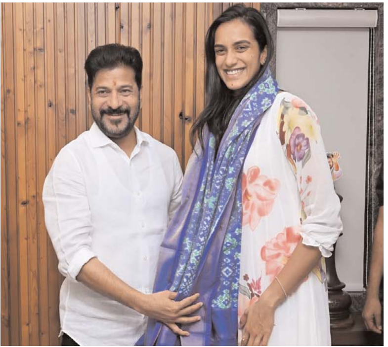
జూబ్లీహిల్స్ ప్రజాబలం ప్రతినిధి త్వరలో పెల్లి చేసుకోబోతున్న ప్రముఖ బ్యాడ్మింటన్ క్రీడాకారిణి పీవీ సింధు గారు ముఖ్యమంత్రి ఎ.రేవంత్ రెడ్డి గారిని కలిసి ఆహ్వానపత్రానిక అందించారు. సింధు గారు కుటుంబ సభ్యులతో జూబ్లీహిల్స్ నివాసంలో ముఖ్యమంత్రి గారిని కలిసి వివాహానికి ఆహ్వానించారు.