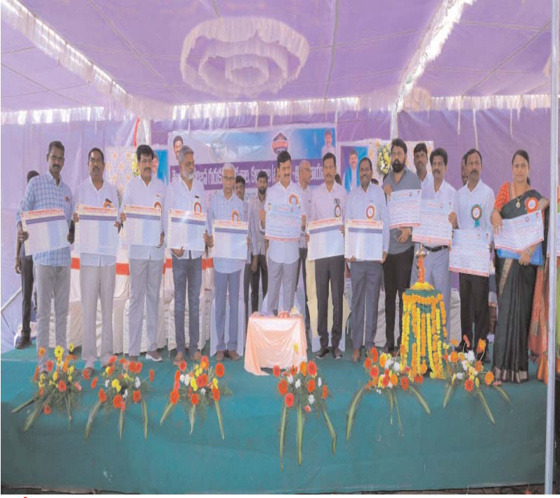
పాలేరు ప్రతినిధి డిసెంబర్ 14 (ప్రజాబలం) ప్రభుత్వం కామన్ డైట్ కార్యక్రమాన్ని అమలు పాలేరు నియోజకవర్గం పిల్లల శారీరక, మానసిక చేస్తుందని తెలంగాణ రెవెన్యూ, గృహ నిర్మాణం, ఎదుగుదలకు తోడ్పడే విధంగా ఇందిరమ్మ సమాచార శాఖల మంత్రి పొంగులేటి శ్రీనివాసరెడ్డి

ఈ సందర్భంగా మంత్రి పిల్లలతో కలిసి భోజనం చేశారు. అంతకుముందు మంత్రి, పాఠశాలలో సిద్ధం చేసిన పంటలను పరిశీలించారు. స్టార్ రూమ్ పరిశీలించారు. సామాగ్రి ఎన్ని రోజులకు పంపిణీ చేయాలి వివరాలు అడిగి తెలుసుకున్నారు. గ్రూప్లను పరిశీలించారు. నిర్మాణంలో ఉన్న పాఠశాల భవన పనులను పరిశీలించారు. రూ. 5 కోట్లతో జి ప్లస్ 3 గా నిర్మిస్తున్న పాఠశాల కాంప్లెక్స్, ప్రిన్సిపాల్, స్టాఫ్ క్వార్టర్స్, సెక్యూరిటీ రూమ్ ల నిర్మాణాలు చేపడుతున్నట్లు తెలిపారు. నాణ్యతలో రాజీ లేకుండా, అగ్రిమెంట్ సమయంలోగా నిర్మాణం పూర్తి చేయాలన్నారు. పాఠశాల కాంపౌండ్ నిర్మాణం పూర్తి చేయాలని, సుందరీకరణ, జనరేషన్, ఆర్కైవ్ షాంట్ ల ఏర్పాటుకు చర్యలు చేపట్టాలని అన్నారు ఈ కార్యక్రమంలో గిరిజన సంక్షేమ శాఖ జాయింట్ సెక్రటరీ శ్రీనివాస రెడ్డి, సీజి అంకర్, డిప్యూటీ డైరెక్టర్ విజయలక్ష్మి, ఇజి తానాజీ, తహసీల్దార్ అన్నావిద్యార్థుల పట్ల ఉపాధ్యాయులు ప్రత్యేక శ్రద్ధ చూపాలని, స్వంత పిల్లల చూసుకోవాలని మంత్రి తెలిపారు