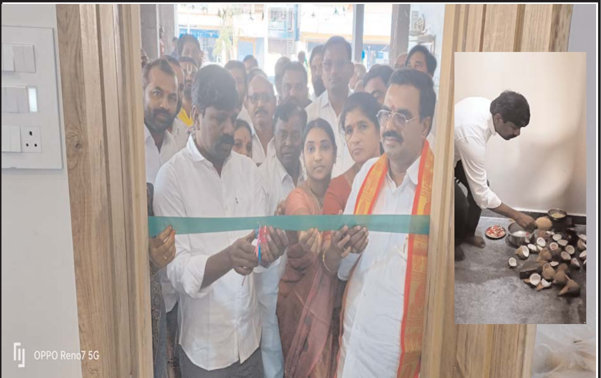
నకిరేకల్ ప్రజా బలం ప్రతినిధి:-నకిరేకల్ మున్సిపాలిటీ పరిధిలోని 08వ వార్డులో వులివర్తి నారాయణ గారు సూతనంగా ఏర్పాటు చేసిన "శ్రీ నారాయణ స్వామి డెయిరీ ఫౌం" ను ప్రారంభించి శుభాకాంక్షలు తెలియజేసిన., నకిరేకల్ ఎమ్మెల్యే వేముల వీరేశం