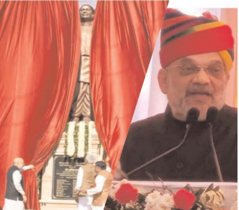
జోధ్ పూర్, డిసెంబర్ 8 సర్దార్ వల్లభాయ్ పటేల్ గజేంద్ర సింగ్ షెకావత్, రాజస్థాన్ విగ్రహాన్ని ఆదివారం జోధ్ పూర్ లో కేంద్ర మంత్రి ఉపముఖ్యమంత్రి ప్రీమీచంద్ బైర్రట్, మంత్రి

ఆయన లేకుంటే ఈరోజు జోధ్ పూర్ పాకిస్థాన్ లో భాగమై ఉండేదేమో: కేంద్ర హోంమంత్రి అమిత్ షా