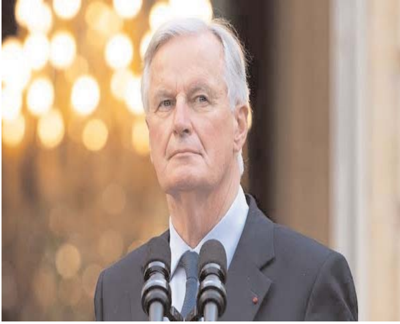
లేదంటున్నారు. అధ్యక్షునిగా మాత్రం చదవీ కాల పరిమితి 2025 నవంబరులో ముగుస్తుంది. పాపెండంటి మెజార్టీ లేకుండా ఎన్నికైన అతని ప్రభుత్వం బడ్జెట్ను ఆమోదించడానికి బలహీనమైన పావులపై ఆధారపడింది. ఈ ఎత్తుగడ ఇప్పుడు బెడిసికొట్టింది.

పారిస్: ప్రధానమంత్రి రాజీనామాతో ఫ్రెంచ్ రాజకీయ సంక్షోభం మరింత ముదిరింది. ప్రతిపక్షాలు ప్రవేశపెట్టిన అవిశ్వాస తీర్మానం నెగ్గడంతో మిచెల్ బార్నియర్ నేతృత్వంలోని సంకీర్ణ ప్రభుత్వం కుప్పకూలింది. మొత్తం 577 స్థానాలున్న పార్లమెంటులో 331 మంది సభ్యులు అవిశ్వాస తీర్మానానికి మద్దతు తెలపడంతో బార్నియర్కు ఘోర పరాభవం ఎదురైంది. ఫ్రాన్స్ చరిత్రలో అతి తక్కువ కాలం పాటు ప్రధానిగా ఉన్న వ్యక్తిగా బార్నియర్ నిలిచారు. ఇప్పుడతని స్థానంలో కొత్త ప్రధానిని నియమించేందుకు అధ్యక్షుడు మాక్రూన్ కనరత్న ప్రారంభించారు. సోదీ అరేబియాలో పర్యటనను అర్ధాంతరంగా ముగించుకుని స్వదేశానికి తిరిగి వచ్చిన బార్నియర్ కుక్రవారం తన రాజీనామా లేఖను అధ్యక్షుడి ఆమోదానికి పంపారు. బడ్జెట్లో సామాజిక భద్రతకు నిధుల కోత పెట్టే పలు పొరుపు చర్యలను ప్రభుత్వం ప్రతిపాదించడంతో అన్ని వైపుల నుంచి తీవ్ర వ్యతిరేకత వచ్చింది. దీంతో పార్లమెంటు ఆమోదంతో నిమిత్తం లేకుండా కార్యనిర్వాహక అధికారులను ఉపయోగించి బడ్జెట్ ఆమోదం పొందినట్లు ప్రభుత్వం ప్రకటించుకుంది. దీనిపై తీవ్ర ఆందోళన వ్యక్తం చేసిన రాడికల్ లెఫ్ట్, పచ్చి మిశ్రమ వేరీ లీపెన్ నాయకత్వంలోనేషనల్ ర్యాలీ పార్టీలు రెండూ అవిశ్వాస తీర్మానానికి అనుకూలంగా ఓటు వేయడంతో ప్రభుత్వం పతనమైంది. ఇది బార్నియర్ ప్రభుత్వ వైఫల్యం మాత్రమే కాదు, అధ్యక్షుడు మాక్రూన్ వైఫల్యం కూడా. అందుకే అధ్యక్షుడిగా మాక్రూన్ కూడా తప్పుకోవాల్సి డిమాండ్ ఉపయోగించింది. దేశ అభివృద్ధికి పెద్ద అడ్డంకి మాక్రూన్ నని రాడికల్ లెఫ్ట్ పార్టీ నాయకుడు మెథిల్లే పనోల్ అన్నారు. బార్నియర్ నిష్క్రమణ మాక్రూన్ ప్రభుత్వ దుర్బుత్వాన్ని తెలియజేస్తోంది. మాక్రూన్ మాత్రం తన పదవీ కాల పరిమితి పూర్తయ్యే దాకా గద్దె దిగే ప్రసక్తే లేదని చెప్పారు.