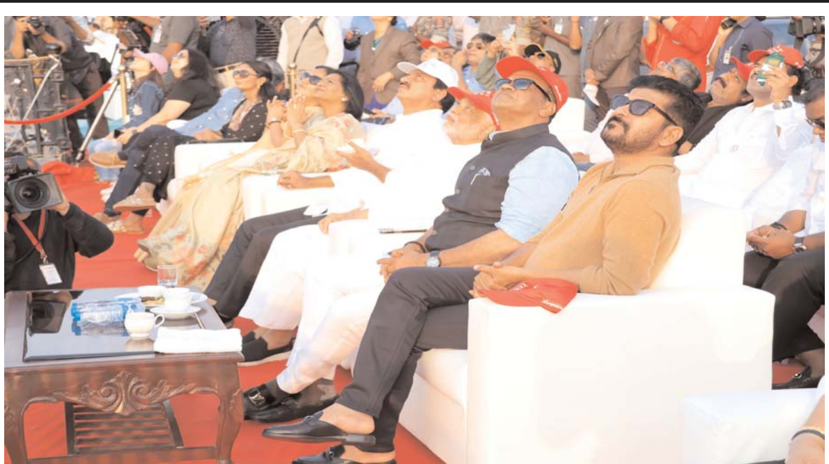
ట్యాంక్ బండ్ వద్ద ప్రజా పాలన - ప్రజా విజయోత్సవ వేడుకలలో భాగంగా ఎయిర్-షో ను తిలకించిన ముఖ్యమంత్రి రేవంత్ రెడ్డి గారు.

తెలంగాణలో కాంగ్రెస్ పాలనకు ఏడాది పూర్తి విజయోత్సవాల్లో భాగంగా వాయుసేన విమానాలతో విన్యాసాలు హాజరైన సీఎం రేవంత్ రెడ్డి, మంత్రులు