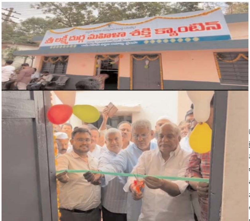
అందించాలని సూచించారు.మహిళా సంఘాల సభ్యులకు ప్రభుత్వం అందిస్తున్న రుణాలను సద్వినియోగం చేసుకోవాలన్నారు.

ఎక్స్ రోడ్(బసంత్ నగర్) ద్వారా కుక్కలగూడూరు, రాజారాంపల్లి, ధర్మాం,చౌప్పడండి ద్వారా కరీంనగర్ వైపు వెళ్ళాలి.మంధని వైపు నుండి కరీంనగర్ వైపు వెళ్ళు 4 వీలర్లు అప్పన్సపేట నుండి ఎడమ వైపు తీసుకుని బొంపల్లి, దొంగతుర్తి,ధర్మాం, చౌప్పడండి ద్వారా కరీంనగర్ వైపు వెళ్ళాలి.కరీంనగర్ నుండి రామగుండం, మంధని వైపు వెళ్ళు భారీ వాహనాలు ముగ్గుంపూర్-ఎక్స్ రోడ్ నుండి కరీంనగర్-లక్ష్మిపేట రోడ్ ద్వారా చౌప్పడండి,ధర్మాం, రాజారాంపల్లి వద్ద కుడి వైపు తీసుకుని కుక్కలగూడూర్, ధర్మాం-ఎక్స్ రోడ్ ద్వారా రాజీవ్ రహదారి (కరీంనగర్-రామగుండం)కు చేరుకుని రామగుండం, మంధని వైపు వెళ్ళాలి.కరీంనగర్ నుండి పెద్దపల్లి, రామగుండం వైపు వచ్చే 4 వీలర్ లు సుల్తానాబాద్ మండలం నారాయణపూర్-ఎక్స్ రోడ్ నుండి నారాయణపూర్, కోడూరుపాక, నిమ్మనపల్లి,పెద్దపల్లి సాగర్ రోడ్, జూనియర్ కాలేజీ రోడ్(ఎమ్ బీ గార్డెన్ రోడ్), అయ్యప్ప జంక్షన్ ద్వారా రామగుండం మరియు మంధని వైపు వెళ్ళవచ్చు. గౌరవ ముఖ్యమంత్రి పర్యటన సందర్భంగా ఎవరైనా శాంతి భద్రతలకు విఘాతం కలిగించే విధంగా కార్యక్రమాలు చేసిన వారిపై చట్ట ప్రకారం చర్యలు తీసుకుంటామని రామగుండం పోలీస్ కమీషనర్ ఐపిఎస్ ఐజీ ఎం. శ్రీనివాస్ హెచ్చరించారు. చట్టవ్యతిరేక ప్రజా శాంతికి,శాంతి భద్రతలకు విఘాతం కలిగించే వారు ఎంతటి వారైనా ఉపేక్షించేది లేదన్నారు.ఎలాంటి సంఘటనలకు తావు లేకుండా ప్రశాంత వాతావరణం ఉండాలని అన్ని వర్గాల ప్రజలు శాంతిభద్రతల సమస్య తలెత్తకుండా పోలీసులతో సహకరించాలని సిపి గారు కోరారు.