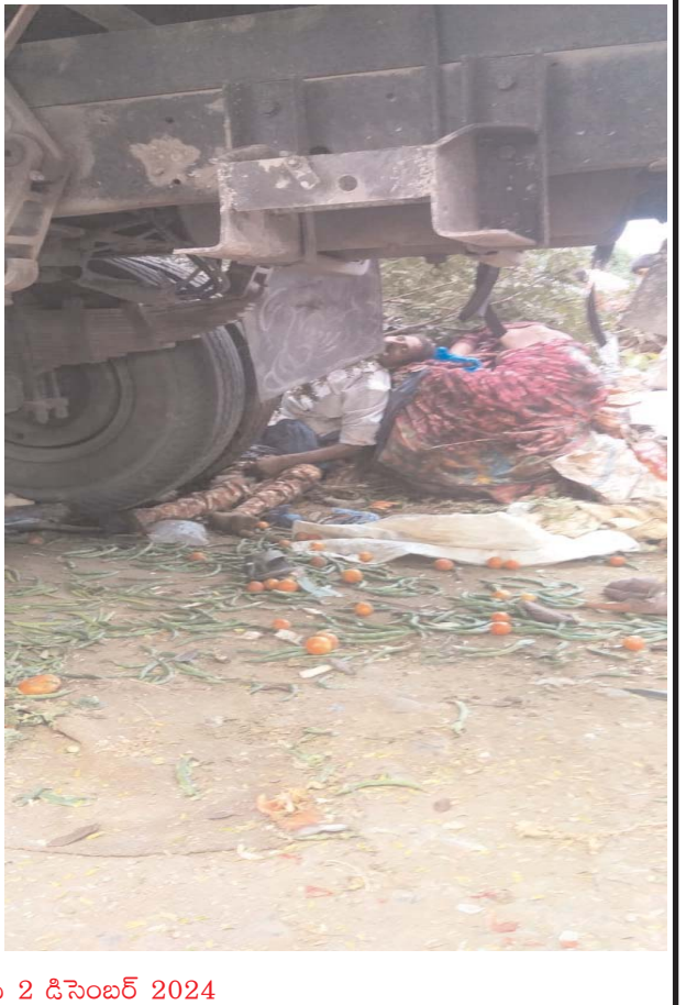
ప్రజా బలం ప్రతినిధి 2 డిసెంబర్ 2024

చేపల్లె మండలం ఆలూరు గేట్ వద్ద ఘోర రోడ్డు ప్రమాదం జరిగింది. ఆలూరు గేట్ వద్ద కూరగాయలు అమ్ముకునే వారి పైకి ఒక్కసారిగా లారీ దూసుకెళ్లడంతో సుమారు 10 మంది వరకూ చనిపోయినట్లు ప్రాథమిక సమాచారం ప్రకారం తెలుస్తోంది.